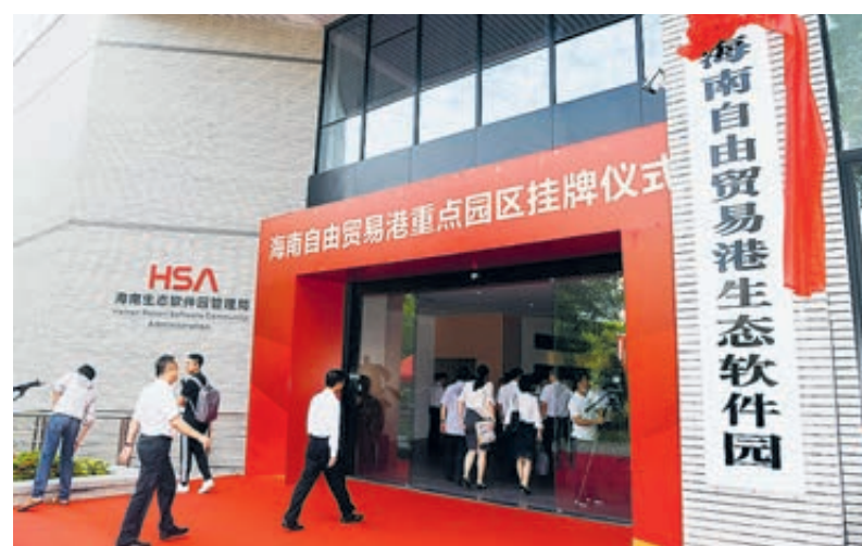
Церемония открытия главного парка порта свободной торговли в провинции Хайнань.

Эти правила вступили в силу 1 января 2020 года и будут действовать до 31 декабря 2024 года.