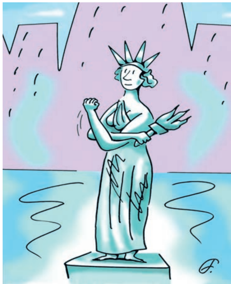
ИЛЛУСТРАЦИЯ ФЕЛЬШТЕЙН АНДРЕЙ/CARTOONBANK.RU

Уверта на куличиках, в далекой Австралии, население которой сопоставимо с Москвой (около 20 млн человек), свое дело ежегодно открывают до трех десятков россиян. Хотя «входной билет» туда начинается от 500 тысяч долларов, которые мигрант должен вложить в облигации Австралии или в местный бизнес. А гражданство Мальты вдвое дороже, но еще в июне тамошняя квота в 1,8 тысячи заявок была полностью выбрана. За паспорт Кипра приходится платить впятеро – однако россияне и это не останавливает.