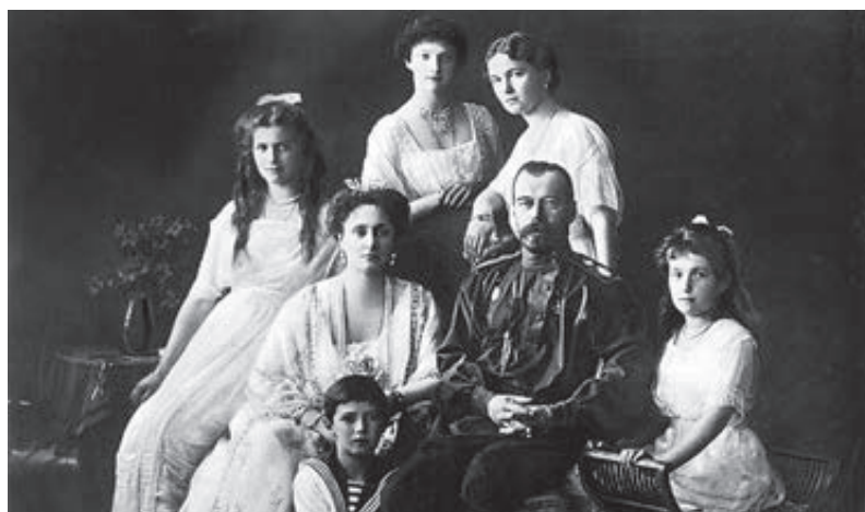
Николай II и члены его семьи. Ровно через 80 лет их останки были захоронены в Санкт-Петербурге.

В Екатеринбурге расстреляны последний российский император