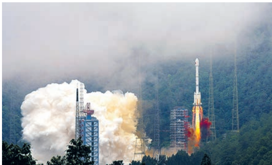
Успешно запущен последний спутник Beidou-3.

По словам директора Канцелярии по управлению спутниковой навигационной системой Китая Жань Чэнци, фактическое тестирование показало, что точность горизонтального и вертикального позиционирования навигационной системы «Бэйдоу» – до 5 метров. По сравнению с американской навигационной системой GPS возможности «Бэйдоу» более обширные. Например, «Бэйдоу» обладает заметными преимуществами