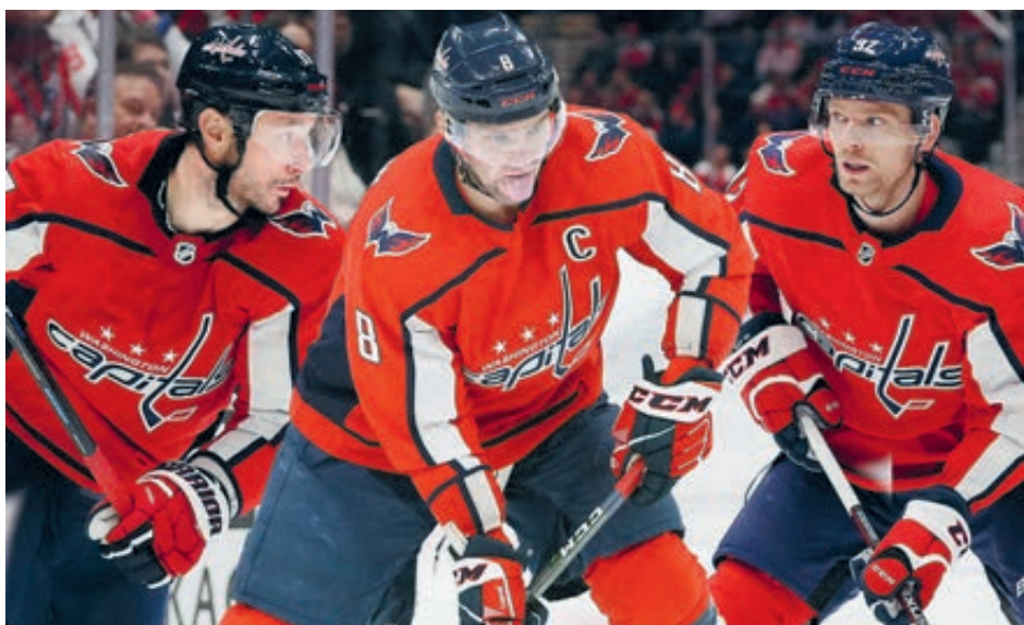
Илья Ковальчук, Александр Овечкин и Евгений Кузнецов теперь будут играть в «столичной» команде в Америке.

Тем временем руководство Континентальной хоккейной лиги (КХЛ) объявило о жестком регламенте, связанном с «антивирусными» мерами безопасности. Так, всех хоккеистов будут проверять на инфекцию раз в пять дней плюс еще после каждого пересечения государственной границы. Напомним: в КХЛ кроме российских выступают еще клубы из Финляндии, Латвии, Белоруссии, Казахстана и Китая. Но легионерам,