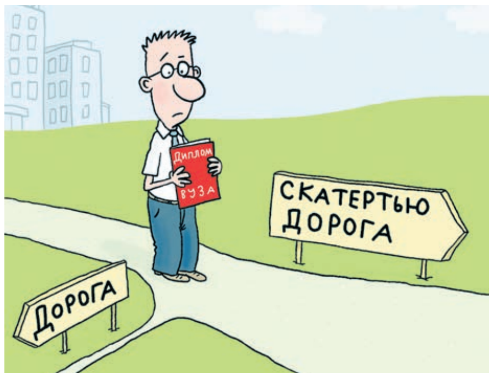
ИЛЛЮСТРАЦИЯ НИКОЛАЯ ВОРОБЬЕВА/CARTOONBANK.RU