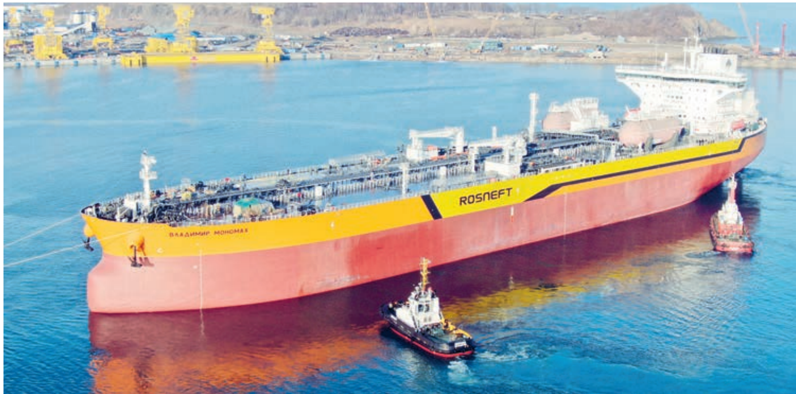
В мае на ССК «Звезда» спущен на воду первый танкер типа Афрамас «Владимир Мономах», а в июле заложен пятый по счету танкер – «Нурсултан Назарбаев»

Заказчиком ледокола стала госкорпорация «Росатом». При этом