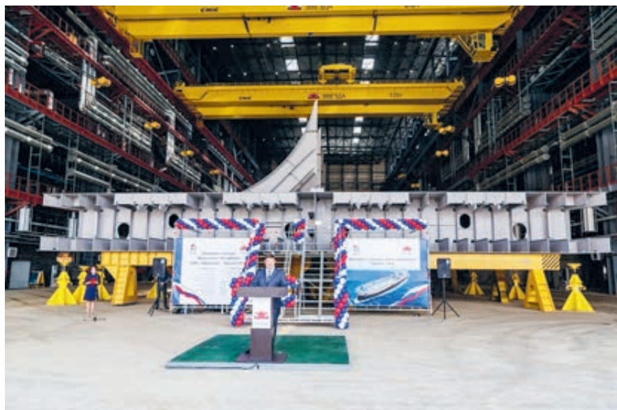
6 июля на ССК «Звезда» приступили к строительству первого ледокола проекта «Лидер».