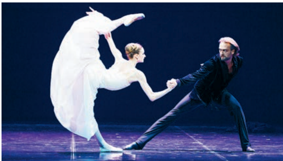
Театр балета Бориса Эйфмана представил «Анну Каренину».