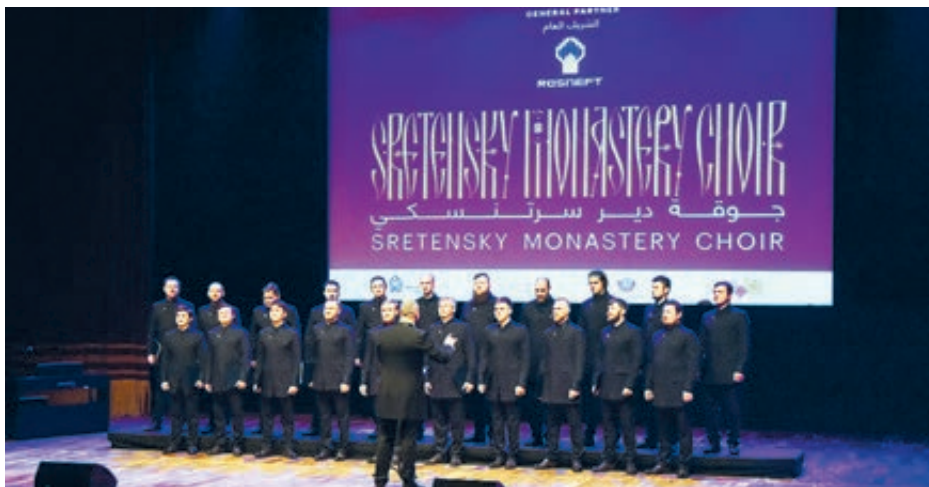
На сцене – Хор Сретенского монастыря.

Конечно, мы могли бы привезти сюда Карла Брюллова или, допустим, соцреализм с его акцентом на нарративе, что произвело бы сенсацию уже самим контрастом по отношению к местным художественным обычаям. Но мы приняли иное решение – отобрали то в отечественном искусстве, что связано геометрией. То есть, с одной стороны, близко психологии исламского зрителя, с другой – не является орнаментикой в чистом виде и представляет собой новый для большинства здешней публики путь развития геометрической идеи. И успех выставки подтвердил нашу правоту.