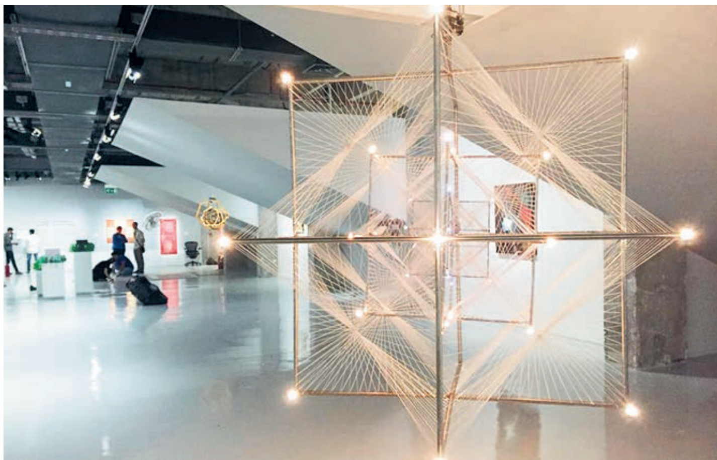
Третьяковка привезла коллекцию русского авангарда.

– Известно, что исламское искусство уже много столетий развивается в нефигуративной традиции, сосредотачиваясь прежде всего на орнаменте.