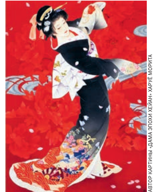
АВТОР: МАРИТТИНИ -ДАМА ЭТОКИ ХЕЙМАН -ХАРУЕ МОРИТА

Есть ли потребность в чем-то подобном в нашей стране? Эксперты считают, что да.