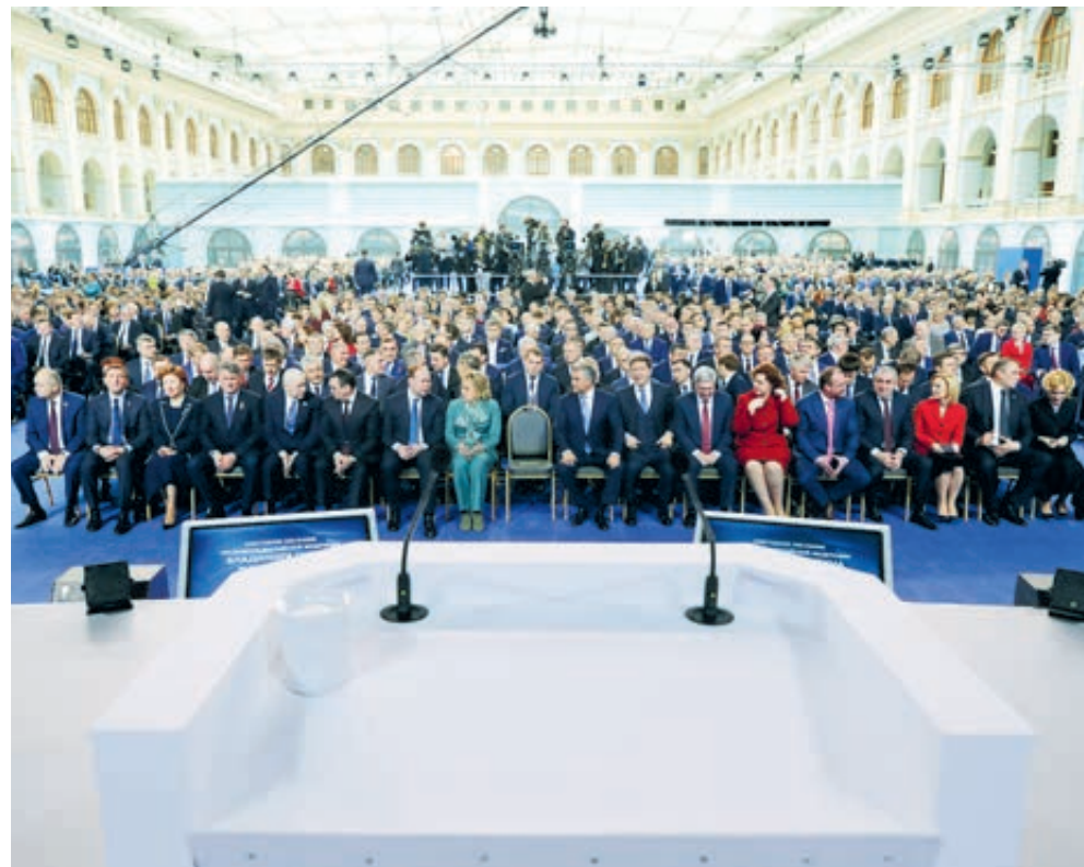
Таким увидел Владимир Путин российский политический истеблишмент в среду, 20 февраля.

Должна быть также снижена налоговая нагрузка на семью. Принцип простой: больше детей – меньше налог. Поэтому следует сократить налогооблагаемую площадь квартир для семей с детьми, а также налоговую нагрузку с дачных участков (не брать налогов с участков до