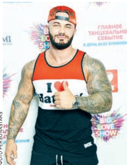
«Ни о чем разговор» – так рэпер Джиган оценил итоги встречи в Госдуме.

хоть на Канатчиковой даче – и даже в новогоднем «Голубом огоньке».