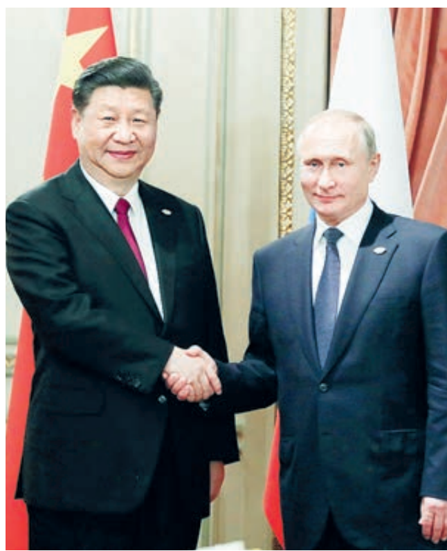
ФОТО СИ ЦЖИНЬПИНА

Си Цзиньпин подчеркнул, что Китай и Россия должны продолжить традицию обмена визитами лидеров государств. Он выразил уверенность в бурном развитии двусторонних связей под руководством глав двух стран. По его словам, необходимо ускорить сопряжение инициативы «Один пояс и один путь» со строительством Евразийского экономического союза, активизировать сотрудничество в торговом-