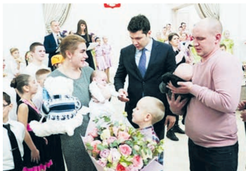
Губернатор Антон Алиханов поздравил семью «миллионеров» Егорцевых. Главным подарком стал новенький автомобиль, собранный в Калининградской области.

К миллионному рубежу Калининградская область шла долго. По итогам первой послевоенной переписи населения 1959 года выяснилось, что за 14 лет число жителей Калининградской области выросло до 610 тысяч, перепись 1970-го показала, что в регионе живут уже 732 тысячи. В 1979-м – 806 тысяч, в 1989-м – 871 тысяча человек. Результаты первой постсоветской переписи 2002 года оказались неутешительными для РФ: численность населения сократилась на 1,8 млн, при этом в самом западном регионе обнаружилась прибавка на 2,3 млн, но Калининградская область, считай, осталась «при своих»: 954,7 тысячи человек против 955,2 тысячи в 2002-м. И вновь удержать пока-