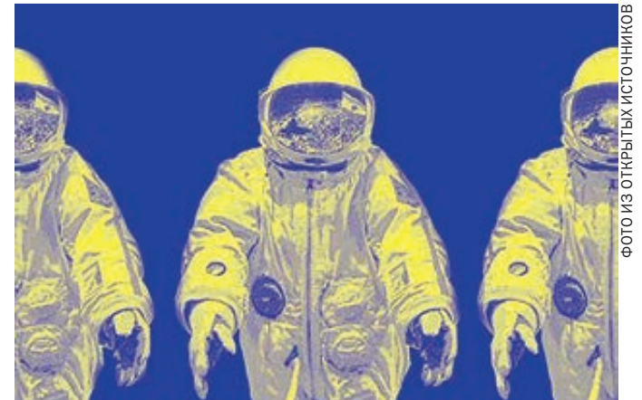
Иван Вырыпаев привез в Москву спектакль-антиутопию.

– Поиски смысла жизни заложены в нас природой. Но сегодня они переходят из метафизических высот в область самой насущной практики. Передовые люди должны вникнуть по-настоящему в устройство мира и найти точки согласия. Иначе шансов нет ни у кого. Еще 100 лет – и все, конец, это вам каждый серьезный ученый скажет. Глобализацию в век интернета не остановить. Сегодня народы разных стран, с совсем разными культурами и традициями, оказались в общем доме и пытаются научиться жить вместе. Но у них это плохо получается. Успеем научиться – все будет хорошо, нет – мир ждет катастрофа.