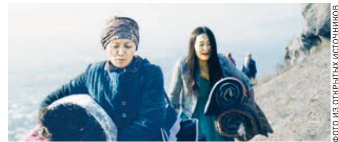
Кадр из фильма «Сулейман Гора».