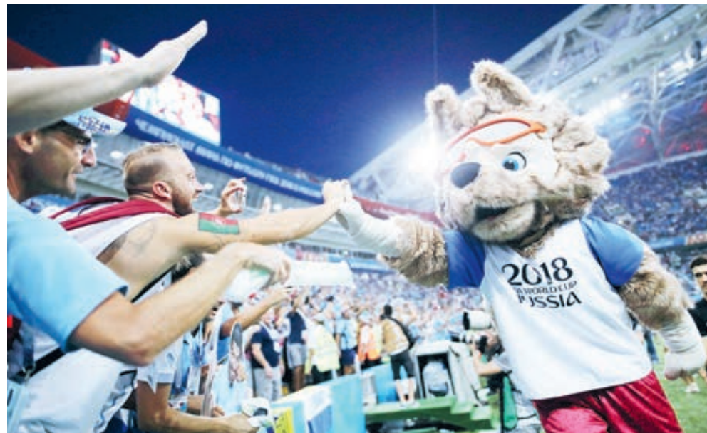
На большой футбол работали тысячи людей в самых разных обличьях.

VAR – 5,5 Сделанный шаг вперед глупо отрицать. Если в прошлом году зрители что на стадионе, что у телеэкранов не догадывались, что видеоассистент просматривает спорный эпизод, то теперь на всеобщее обозрение выносятся и картинку, и классификацию запроса. Дебют системы на ЧМ не вышел комом. Хуже, на мой взгляд, другое. Серьезно отстав от собратьев, футбол пытается замимствовать у наиболее развитых в этом отношении спортивных игр: у волейбола – множество телекамер; у хоккея с шайбой – строгий перечень спорных ситуаций; у регби и американского футбола – возможность отмотать эпизод назад и вернуться в матче к критической точке. Но во всех этих играх нет «грязного» времени (даже в регби, где рефери уже давно вправе останавливать секундомер). При этом противоречит слепое следование чужими тропами может завести футбол в непроходимые дебри.