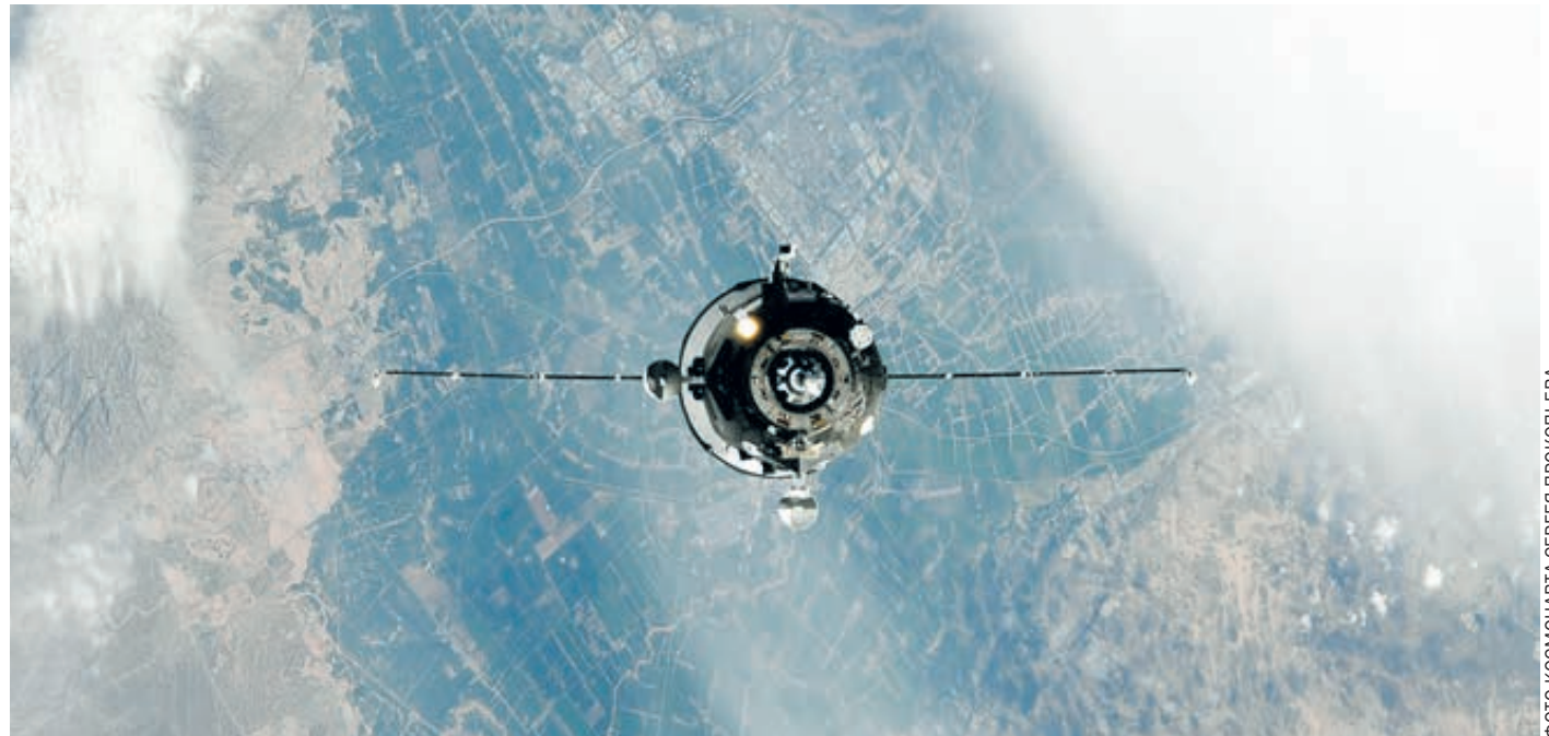
ФОТО КОСМОНАВТА СЕРГЕЯ ПРОКОПЬЕВА

А пока налицо явная нестыковка планов создания нового перспективного корабля и необходимой для его запуска ракеты. Как это получилось – отдельная история. Сейчас важно осознать, что на лунном направлении у российской космонавтики, если не