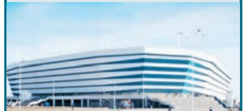
Новый стадион в Калининграде.

– Прямые затраты на чемпионат составили около 650 млрд рублей. Прибыль с учетом доходов от туризма и торговли – 860 млрд. Выиграла страна всего пару сотен миллиардов, 0,2% годового ВВП. Зато от повышения НДС Россия получит как минимум 0,4% ВВП в год. Вот и делайте выводы, где мы нашли, а где потеряли. А главные проблемы вылезут после чемпионата. К примеру, старый