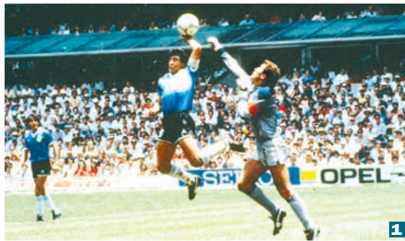
Вот они, мгновения финалов. 1 Марадона и его рука Бога. 1986. 2 А по поводу этого гола споры не затихают до сих пор. Англия. 1966. 3 Пеле после победного матча в Мехико. 1970. 4 Зидан и Матерацци вошли в историю. 2006.

Едва ли надо ждать обилия голов. Конечно, и у французской, и у хорватской сборной большой атакующий потенциал. Неугомонный Гризмани, открытие турнира юный Мбаппе — и неистовый Манджуквич с мудрым Модричем на пару. Но уже по шесть игр за спиной, да и статистика по части результативности не слишком обнадеживает. Начиная с 1990 года в семи финальных встречах было забито лишь 10 мячей. Трижды для