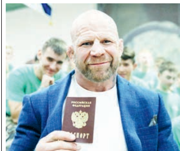
В местные парламенты России потянулись совсем уж экзотичные депутаты...

«Стоп-стоп, – подумает рядовой обыватель, – что это такое я вдруг услышал? Какой Монсон? Какая Скрипаль? В какие, к черту, депутаты? Ну ведь точно разыгрывают, шутники!» И на всякий случай слушатель проверяет, на какую волну настроен его приемник. Выясняется, что нет – не на «Юмор FM». И от этого становится как-то не по себе.