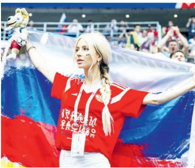
Плохая новость для телеболельщиков: ФИФА против показа в телевизоре красивых девушек на трибунах. Чиновники усмотрели в этом признаки сексизма.

Президента Хорватии Колинду Грабар-Китарович знают во всем