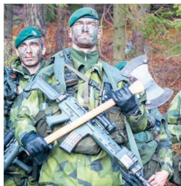
Они и вправду собрались воевать?

Оказывается, психоз, как пожар, пошел с верхних этажей. Не так давно министры обороны США, Финляндии и Швеции Джеймс Мэттис, Юсси Ниинисте