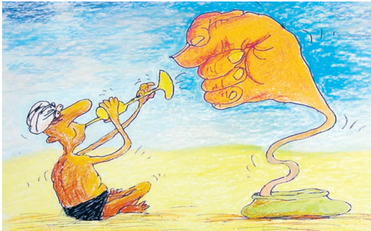
ИЛЛЮСТРАЦИЯ ВЯЧЕСЛАВА ШИЛОВА/CARTOONBANK.RU

Тем временем Госдума обсуждает законопроект о наказании зарубежных компаний за соблюдение европейских и американских санкций. «Если поправки будут приняты, работа западных ком-