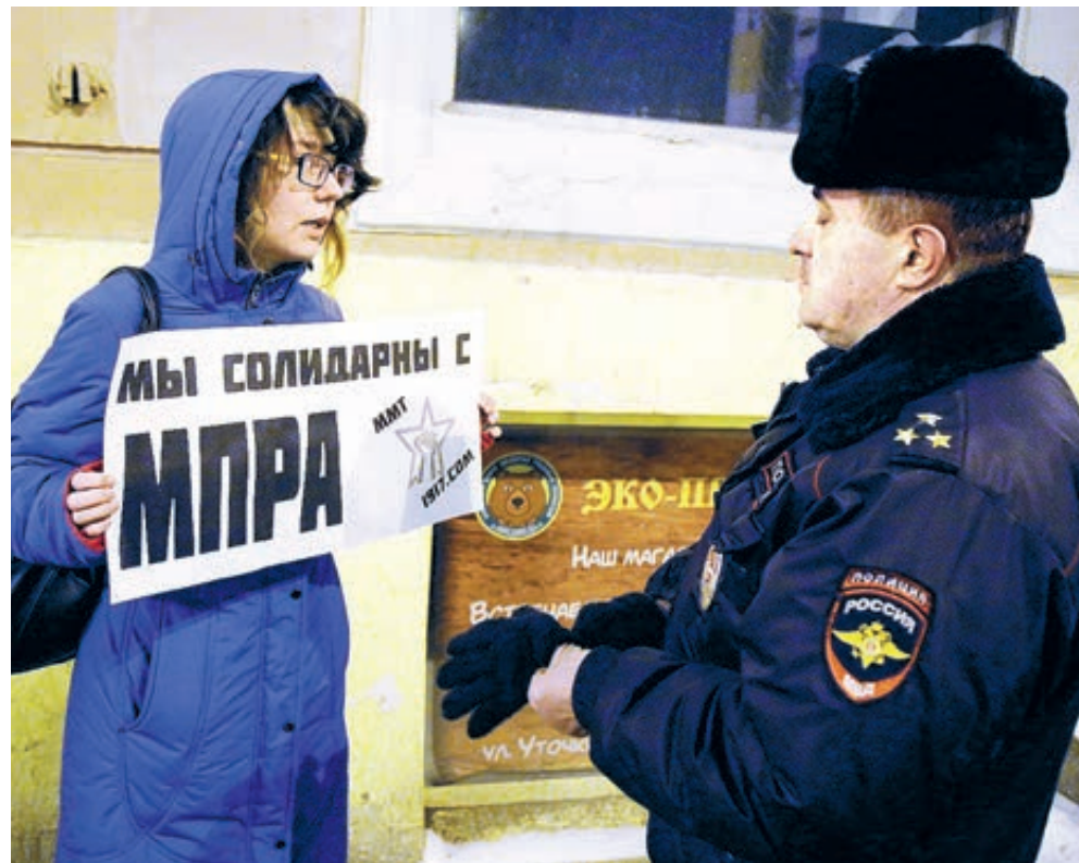
Это тот случай, когда солидарность помогла.

По абсурдной логике надзорного органа, МПРА якобы имеет