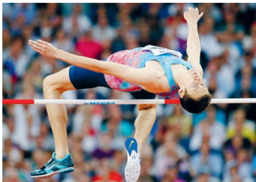
Данил Лысенко прыгнул на 2,32, что принесло ему серебряную медаль в Лондоне.

— Моя травма — перед ней меркнут все остальные сложности. Дней за пять до вылета в Лондон, еще на тренировке в Москве, у меня разболелась левая нога. Дал знать о себе седалищный нерв. Врачи