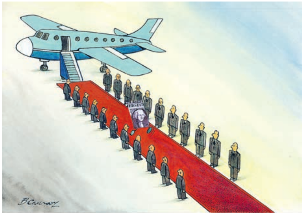
ИЛЛЮСТРАЦИЯ ВЛАДИМИРА СЕМЕРЕНКО/ARTONBANK.RU

Такое обращение не осталось незамеченным, разразился вселенский скандал. Это же как одной своей ногой наступить на другую, да прямо на патристическую мозоль! Давайте успокоимся и разберемся. Спросите, почему надо просить одобрения коммерческой сделки за океаном? Все дело в том, что производится лайнер Superjet у нас, но на 72% эта машина состоит из импортных комплектующих. Поставка самолетов без одобрения OFAC грозит серьезными штрафами и ограничениями. И это не пустые угрозы. Не так давно банку