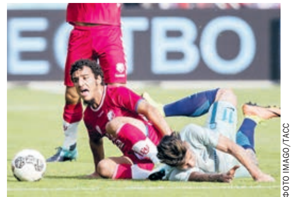
«Утрехт» — «Зенит» — 1:0. Не в деньгах счастье!