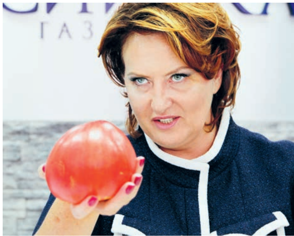
Министр сельского хозяйства РФ Елена Скрынник, 2011 год.

Здесь, конечно, нужно учитывать китайскую специфику, менталитет, привязанность китайцев к своей большой и малой родине. Ведь из более чем 2,5 тысячи беглецов 1238 человек вернулись в КНР добровольно, оформив явку с повинной. Но остальные взяточники и казнокрады были отправлены в Китай принудительно. Отправлены из стран, где уже нашли укрытие,