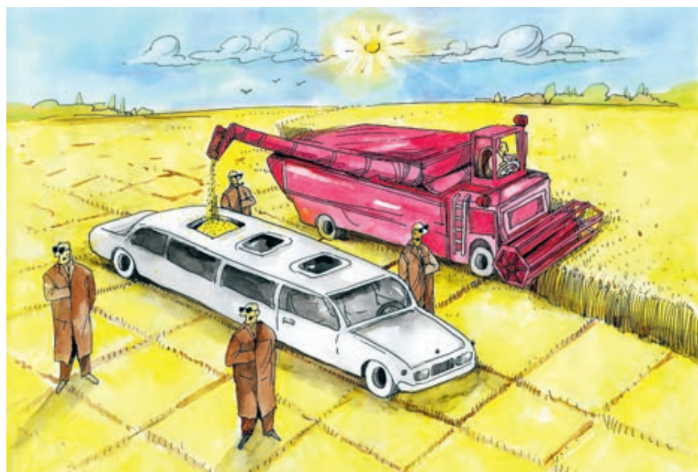
ИЛЛЮСТРАЦИЯ КУСТОВОГО АЛЕКСЕЯ / CARTOONBANK.RU

День в день с побегом русского француза Поздышева прокуратура Швейцарии сообщила, что прекращает расследование дела об отмывании денежных средств экс-министром сельского хозяйства РФ Еленой Скрынник, ныне живущей на собственной вилле на Лазурном Берегу. В России бывшая чиновница до переезда