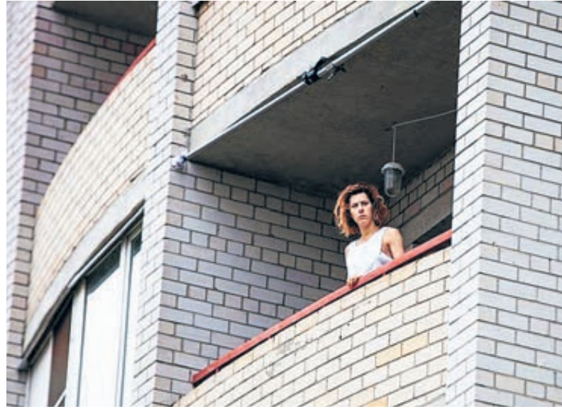
Кадр из фильма «Аритмия».