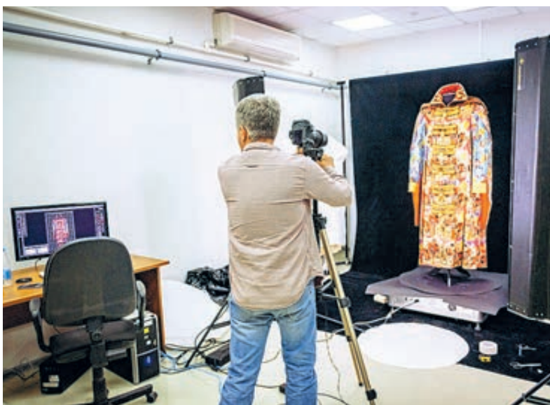
Уникальности костюмов (фото справа) соответствовала и уникальность технологии съемки.

На помощь музейщикам пришли современные технологии: Большой театр совместно с корпорацией «Элар» завершили оцифровку наиболее ценных экспонатов из фондов музея. Вот, скажем, принадлежащий Федору Ивановичу Шляпину бухарский халат, на подкладке которого стоит автограф великого певца. Для оцифровки были предоставлены костюмы Леонида Соби-