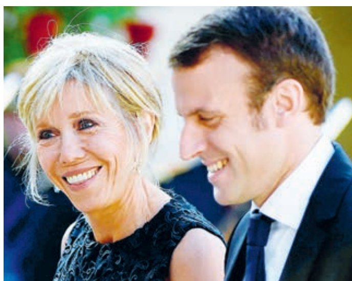
ФОТО ИЗ ОТЧЕТНЫХ ИСТОЧНИКОВ

Возбудило Национальное собрание. Левые заявили, что «французам не нужна прозрачность роли жены президента страны, а нужно, чтобы этой роли вообще не существовало». Меж тем рейтинг президента просел с 64 до 54%, что эксперты