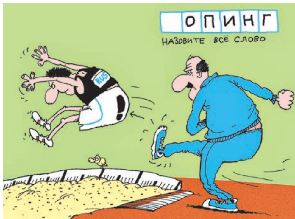
ИЛЛЮСТРАЦИЯ НИКОЛАИ ВОРОНЦОВА/САЙТООБАНК.РУ