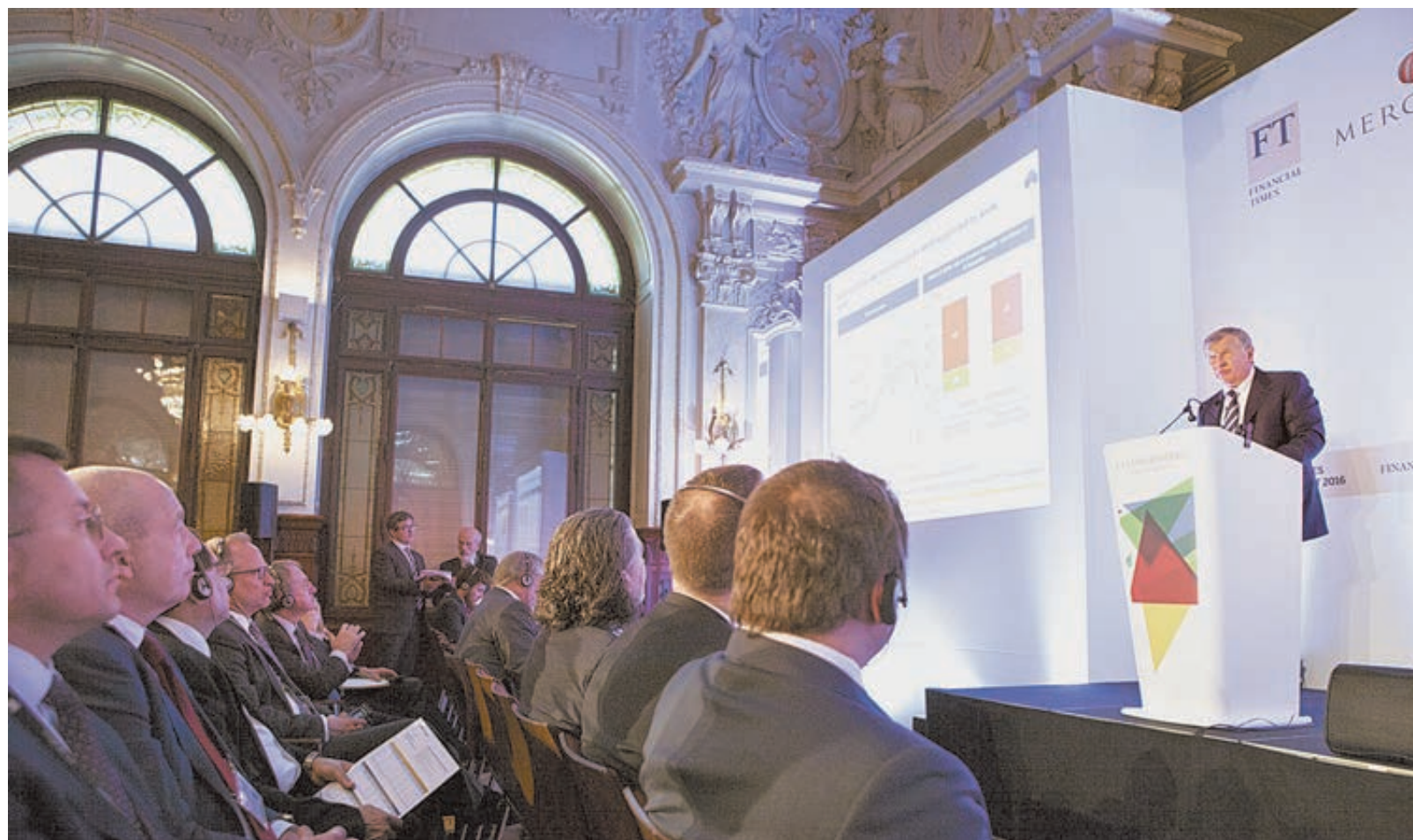
Глава «Роснефти» Игорь Сечин 12 апреля выступил с докладом на открытии конференции FT Commodities Global Summit, в котором проанализировал ключевые тенденции мировых сырьевых рынков.

По словам экспертов, за прошлый год «Роснефть» показала наилучшие за всю свою историю