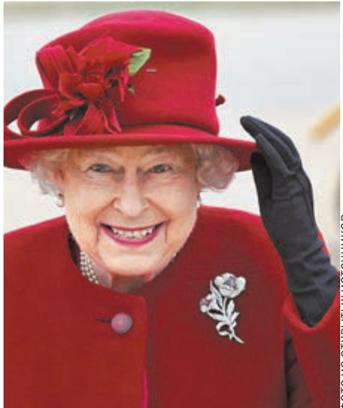
Королева встречает 90-летие в прекрасном настроении.

Похоже, причина проволочки банальна: Елизавете II крайне неприятен тот факт, что вместе с Чарльзом на престол взойдет его жена Камилла. Вот и оттягивает этот момент. Ну чем не мыльная опера? А началась она еще в 1970 году, когда молодой и застенчи-