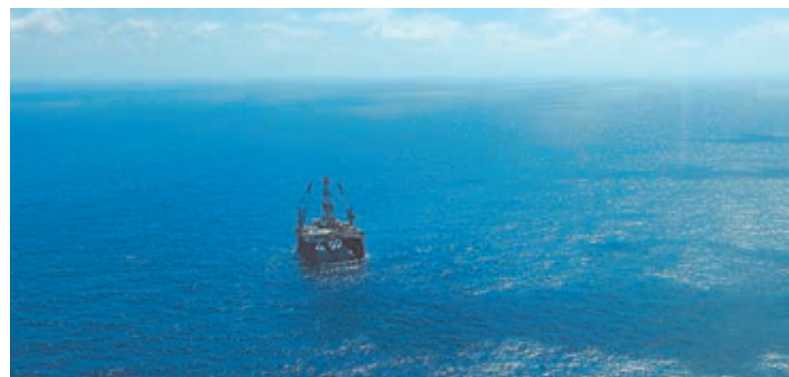
«Роснефть» приступила к поисково-разведывательному бурению на шельфе Вьетнама.

Таким образом, успехи «Роснефти» стали, по меткому замечанию аналитика «Ренессанс Капитал» Ильдара Давлетшина, «подушкой безопасности» для BP в период низких цен. И обусловлены они, прежде всего, эффективным менеджментом, который делает «Роснефть» современной, высокотехнологичной и стратегически мыслящей компанией, привлекательной для инвесторов. ■