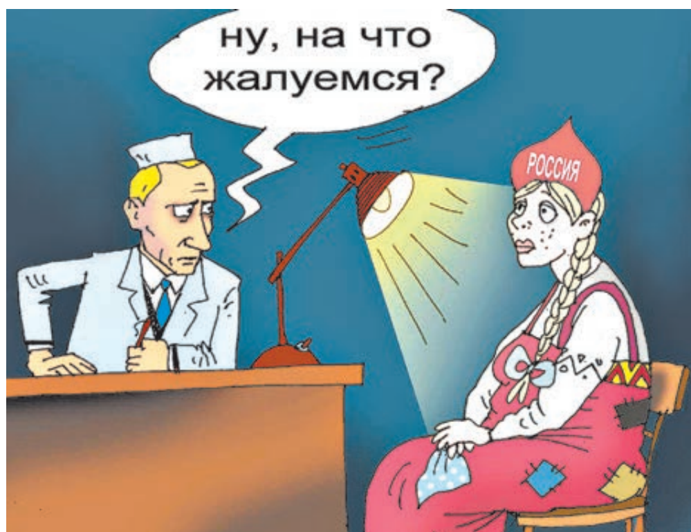
ИЛЛЮСТРАЦИЯ СЕРГЕЯ КОКАРЕВА / CARTOONBANK.RU

А что с содержанием? Неизменным остается спектр вопросов, которые интересуют граждан. Из года в год их волнуют практически одни и те же проблемы: экономика, социалка, коммуналка, ухудшение медицины и образования, цены на продукты, коррупция чиновников, претензии к правоохранительным органам, происки наших зару-