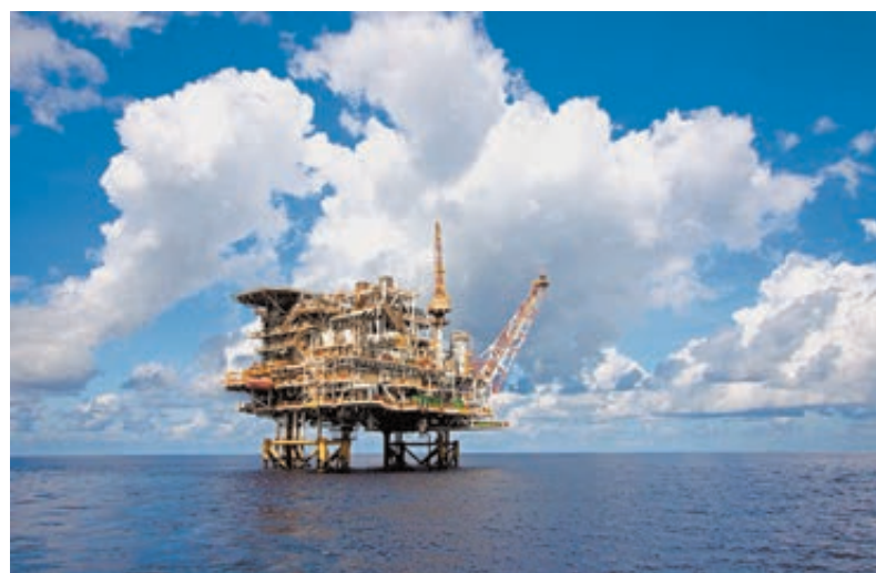
«Роснефть» и Japan Drilling Co., Ltd. подписали договор на бурение поисково-разведочных скважин на шельфе Вьетнама.

на территории Дальневосточного федерального округа мощностью до 30 млн тонн сырья в год, который призван решить ряд важных задач: устранение дефицита и снижение цен на моторные топлива; развитие инфраструктуры и сопутствующих производств; использование уникальных возможностей, создаваемых быстрорастущим спросом на продукцию нефтехимии и нефтепереработки в АТР. Достигнута стратегическая договоренность с Китайской национальной химической корпорацией (ChemChina) о ее вхождении в этот проект в качестве инвестора. В свою очередь, «Роснефть» получит 30% в дочке ChemChina Petrochemical Corporation (CCPC), которая владеет девятью НПЗ в Китае мощностью 25 млн тонн в год.