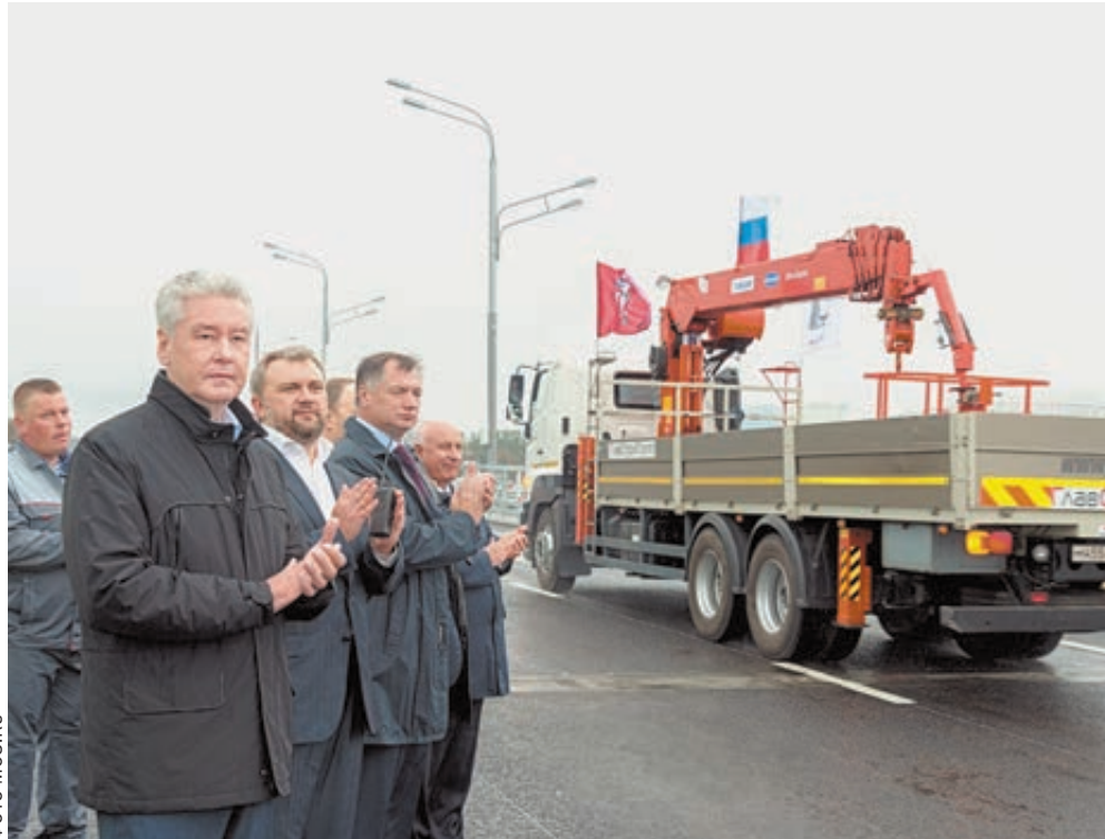
Открытие движения по эстакаде на пересечении Волоколамского шоссе с проездом Стратонавтов.

Кроме того, была принята программа по ремонту асфальто-бетонных покрытий. По словам Раиса ЧИГЛИКОВА, первого заместителя руководителя госучреждения «Автомобиль-