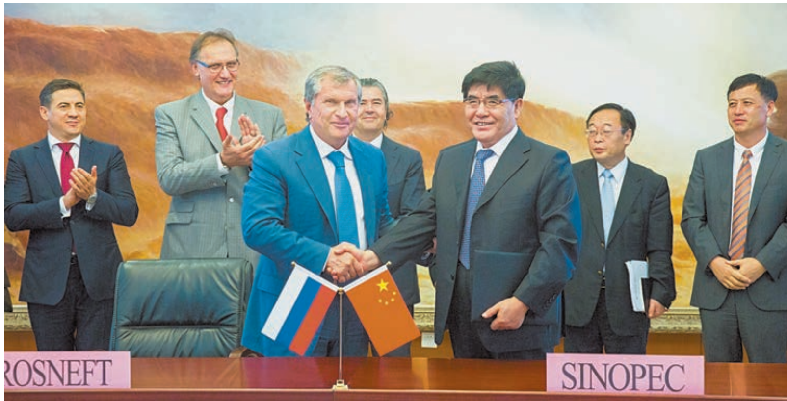
«Роснефть» подписала в Пекине основные условия соглашения с China Petrochemical Corporation (Sinopec) в отношении сотрудничества в рамках совместного освоения Русского и Юрубчено-Тохомского нефтяных месторождений.

В частности, компания подписала соглашение по обмену активами с China Petrochemical Corporation, которая будет участвовать в проекте ВНКК (Восточная нефтехимическая компания). Он предусматривает создание крупнейшего нефтеперерабатывающего комплекса