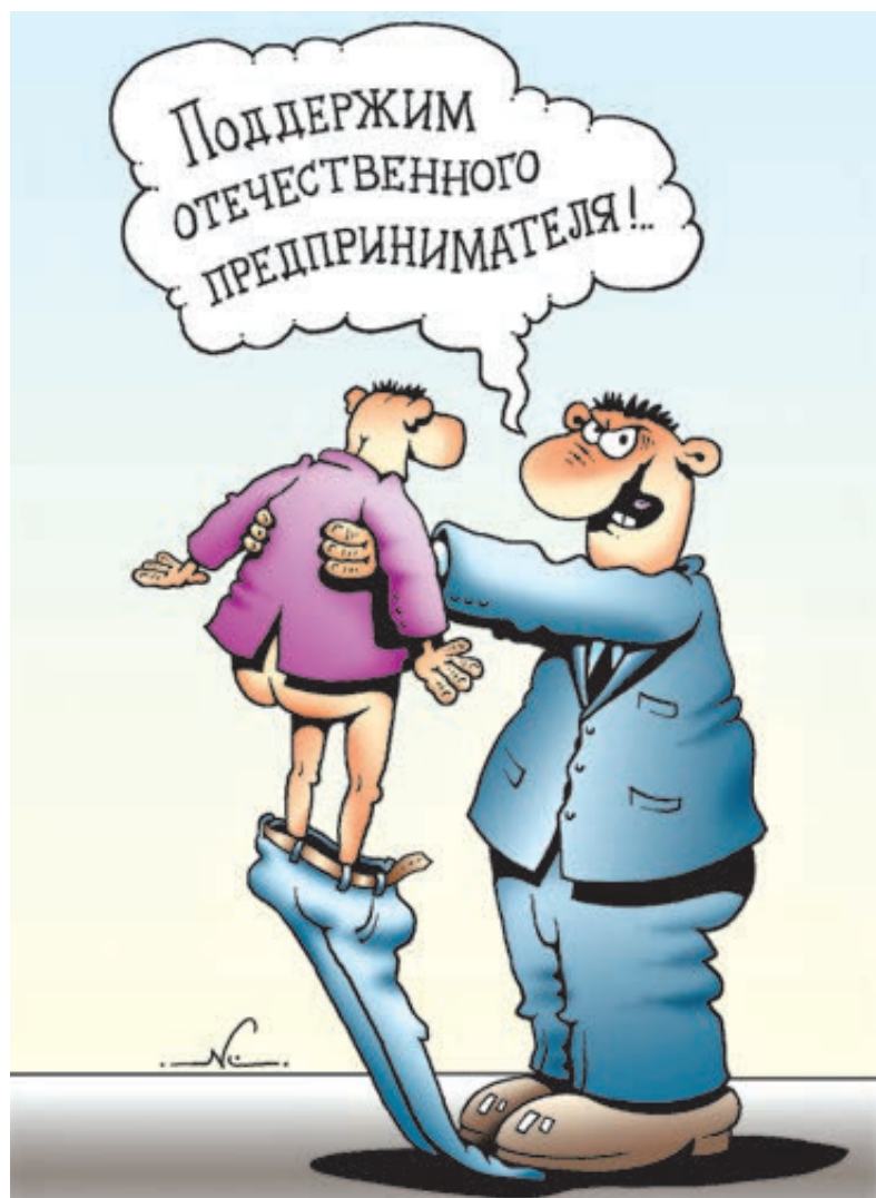
ИЛЛЮСТРАЦИЯ ИГОРЬ КИРИКО/САТООБВАНК.РУ

Но сушить сухари придется не всем. Федеральных служащих, наоборот, ждут пироги и пышки: в проекте «Основных направлений бюджетной политики» на ближайшие три года, подготовленном тем же Минфином, запланированы солидные доплаты каждому федеральному чиновнику (58 тысяч рублей в месяц) с расчетом удвоения их средней зарплаты уже к 2018 году. На эти цели предполагается потратить 462 млрд рублей – больше, чем федеральные расходы бюджет-