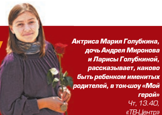
Актриса Мария Голубкина, дочь Андрея Миронова и Ларисы Голубкиной, рассказывает, как она была ребенком именитых родителей, в ток-шоу «Мой герой» Чт, 13.40, «ТВ-Центр»