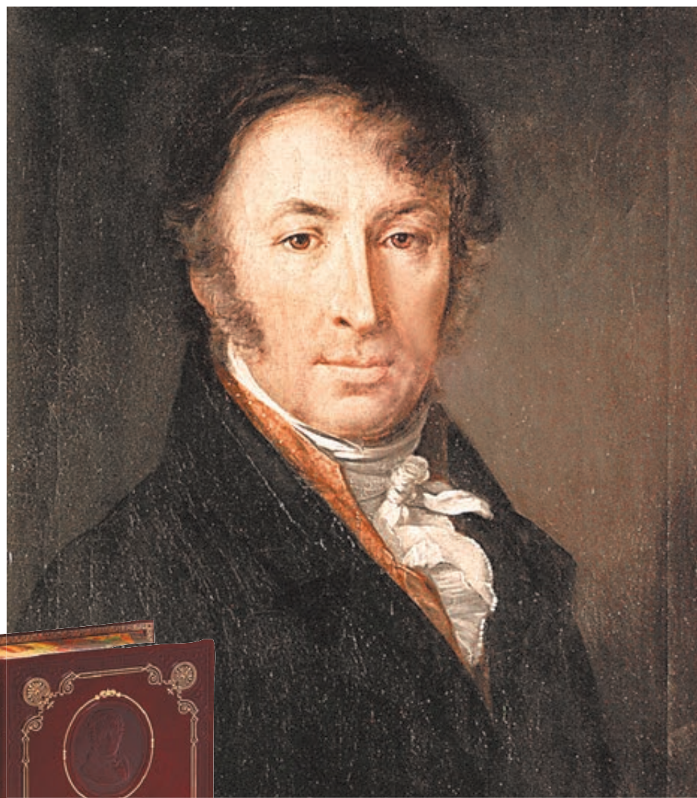
ФОТО ИЗ ОПЫТА ГЛАВНОЙ РЕДАКЦИИ

Главный труд своей жизни Карамзин начал писать в 1803 году, уединившись в кабинетной тиши со старинными манускриптами (помощники приносили ему документы из архивов и монастырей). Прославленный 37-летний писатель («Письма русского путешественника», «Бедная Лиза», еще более десятка повестей), успешный издатель «Московского журнала» и «Вестника Европы» отказался от многого, сосредоточившись на занятиях историей. Император Александр I произвел Карамзина в придворные историографы, назначив ежегодное жалование в две тысячи рублей ассигнациями.