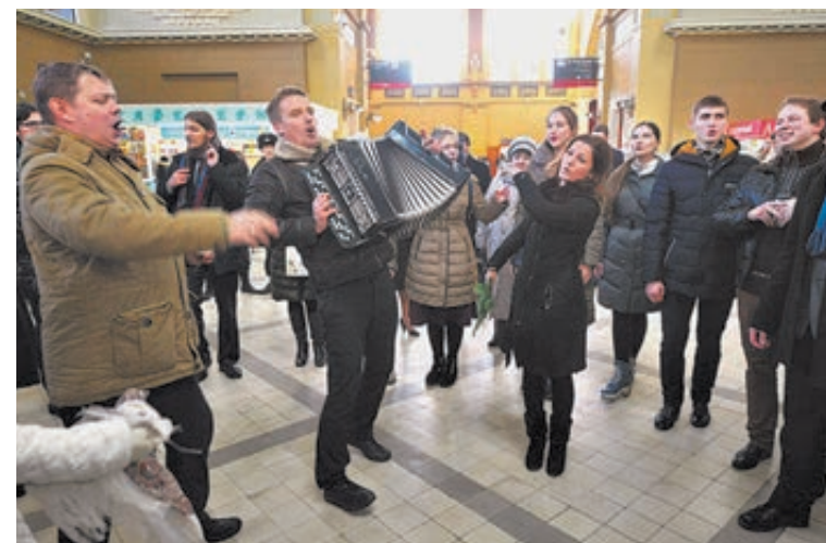
Песня на Киевском вокзале в Москве.

лось между нами, бывшими советскими людьми, дружбой уж точно не назовешь. И добрососедством тоже. Если брать взаимоотношения России и Украины, то они ближе к войне, чем к миру. Иногда кажется, что это уже не поправимо. Градус ожесточения зашкаливает. Русский язык с Украины гонят, за русские песни штрафуют, все, что связано с прежней, советской жизнью, безжалостно выкорчевывается и сверху для верности заливается хлоркой – чтобы ничего не проросло. Но оно – прорастает! Это не официальный оптимизм, а впечатление от запущенного по украинским вокзалам флешмоба: десятки и сотни людей приходят сюда, чтобы спеть «Когда весна придет, не знаю...», «Я люблю тебя, жизнь!», «Спят курганы темные...» и прочие чудесные песни, с которыми жили наши родители, дедушки и бабушки в ту пору, когда дом был общий. Но ведь поют не пенсионеры – совсем еще молодые люди. Конечно же, в украинских СМИ и здесь нашли руку Москвы. Но вы сами, Кравчук и Шукшевичем изложена на стр. 11 этого номера «Труда». Но мы сейчас о другом – не об истории, а о дне сегодняшнем. Увы, Кравчук оказался прав. То, что оста-