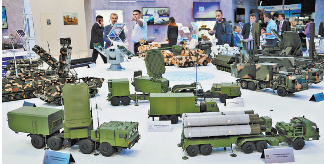
«Алмаз-Антей» постоянно наращивает производство, а также совершенствует уже созданные комплексы ПВО.

Концерн работает не только на российскую «оборонку». Уже разработаны и внедрены системы, позволяющие управлять воздушным движением. «Алмаз-Антей» стал одним из лидеров отечественного радиолакационного строительства. Сейчас холдинг — единственный поставщик технических средств, систем и комплексов для Аэронавигационной системы России. Основу отечественных систем управления воздушным движением составляют средства организации и управления воздушным движением. В их числе аэродромные радиолакационные комплексы, автоматизированные системы управления воздушным движением. Практически каждый центр