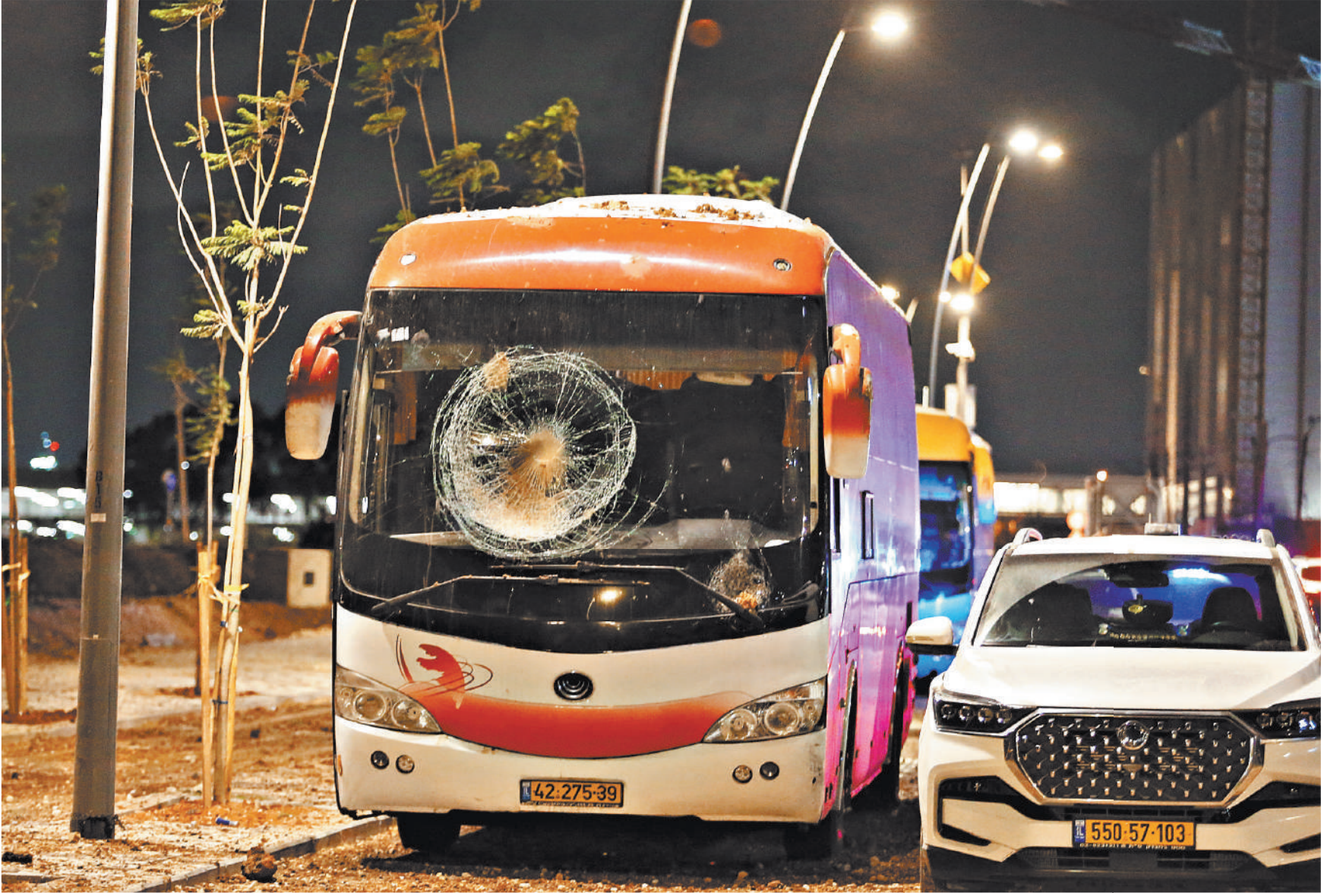
Место падения обломков иранской ракеты к северу от Тель-Авива. Иран утверждает, что почти все ракеты достигли целей. Израиль говорит об отражении атаки.

Оценивая иранскую ракетную атаку, которая получила название «Правдивое обещание-2», эксперты сталкиваются с огромным количеством противоречий. По заявлениям Израиля и США, ракет было около 180, причем они якобы не нанесли серьезного ущерба. В Вашингтоне назвали иранскую операцию «неэффективной». По официальным заявлениям Тель-Авива, в результате ударов погиб один человек, трое получили ранения. Американские военные, кстати, принимали активное участие в отражении удара. В Белом доме заранее отдали приказ об усилении боеготовности своих войск в регионе, а непосредственно ракеты сбивали два эсминца ВМС США — «Балкелли» и «Коул». Причем в Пентагоне заявили, что у американцев есть «еще много других возможностей в регионе, чтобы быть готовыми к широкому спектру угроз». Помимо