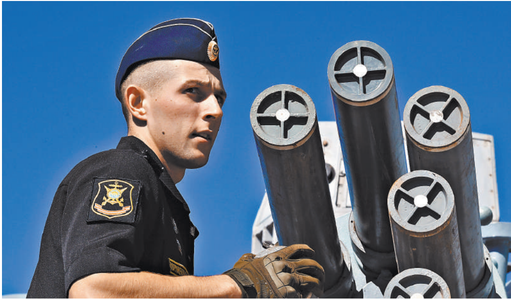
Морякам нравились своим внешним видом и удобством ношения пилотки, и они попросили вернуть их в обиход.

Выдача пилоток для офицеров, мичманов и прапорщиков была прекращена в 2022 году. Тогда же из обращения изъяты знаменитые шапки-ушанки. С того периода военным стали выдавать обычные шапки, полковникам и генералам — меховые, а капитанам первого ранга и адмиралам — каракулевые. Зимний головной убор старшего командного состава флота тогда же лишился козырька.