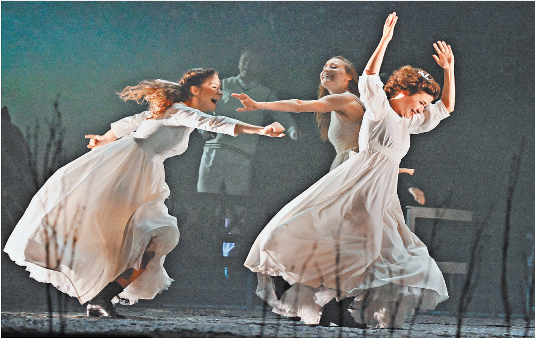
Своей пьесой Борис Зайцев прощался с детством и юностью. Это была жизнь, где царила любовь.