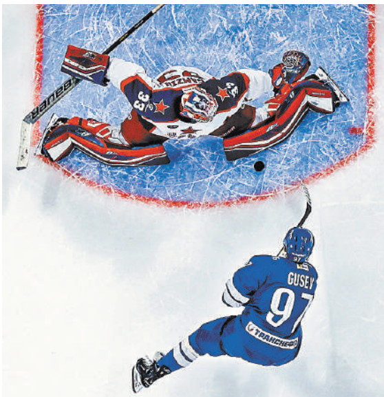
В матче с ЦСКА «Динамо» вело в счете 2:0 и 3:2, но победу так и не удержало.

А вот форвард «Нью-Йорк Рейнджерс» Артемий Панарин матч против «Нью-Джерси» не доиграл. Надеемся, что ничего серьезного.