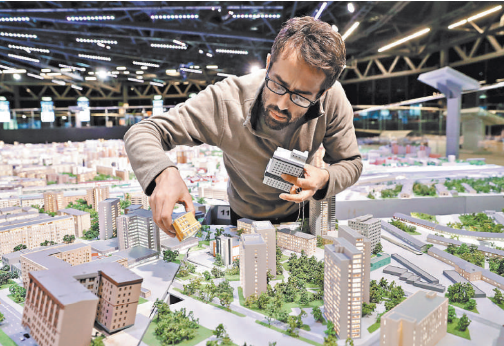
Москва в миниатюре строилась тоже не сразу. На это понадобилось несколько месяцев.

Москва», «История Москвы», «Лучший город земли», «Архитектурные стили», «Москва Булгакова», «Пушкин о Москве» и т.д. Их будут транслировать каждые полчаса с 11.00 до 19.30. Также гостей павильона в выходные ждут тематические экскурсии и интерактивные викторины. Те, кто смогут ответить на вопросы об истории создания макета, его особенностях и других деталях, получат памятные призы. А некоторые здания можно будет не только увидеть, но и потрогать. Так называемые тактильные макеты — это точные копии Спасской башни Московского Кремля, Большого театра, храма Христа Спасителя, Триумфальной арки, одной из семи сталинских высоток и Государственного исторического музея. Для гостей с ограниченными возможностями все макеты дополнены описанием, выполненным шрифтом Брайля. ●