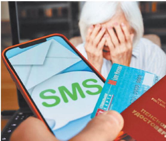
По мнению Верховного суда, с банка спрос должен быть строже, чем с гражданина — его клиента.

Кассация направила дело на пересмотр в апелляцию. Суд отметил, что договоры подписаны СМС-кодами. Они подтверждают совершение сделок через дистанционные сервисы банка. Так стороны согласовали все существенные условия договоров. Их письменная форма считается соблюденной, заключила кассация. Банк не отвечает за последствия того, что клиент представил данные посторонним. При повторном рассмотрении суд отказал в иске. С таким выводом согласился и кассационный суд. В деле нет доказательств, что банк виноват в произошедшем.