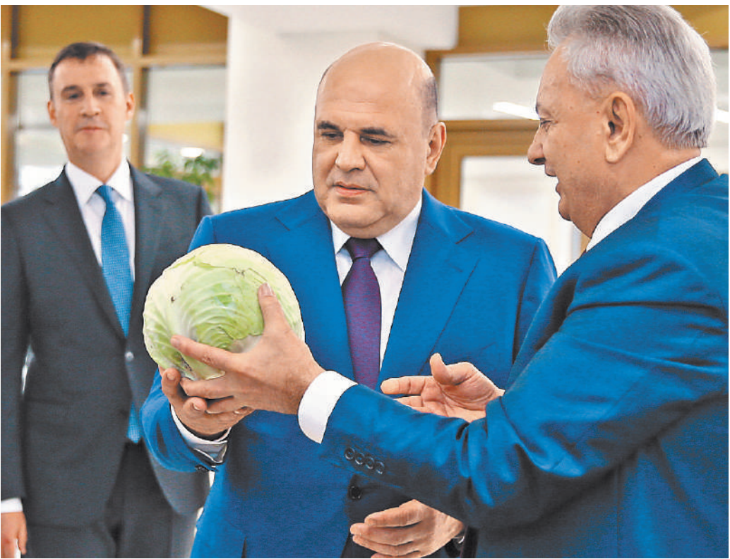
Глава кабинета при любой возможности отмечает успехи сельского хозяйства.

Михаил Мишустин призвал наращивать темпы поддержки российских сельхозпроизводителей, которым необходимо доступное кредитование. «Особое внимание, конечно, надо уделять компаниям, которые сегодня на острие важнейших направлений работы сельского хозяйства — это селекция, птицеводство, производство муки, молока, переработка мяса, — чтобы обеспечивать людей качественными продуктами питания», — указал премьер. Отдельно он попросил внимательно относиться к аграриям Белгородской, Курской и Брянской областей, в которых сейчас сложилась непростая обстановка. ●