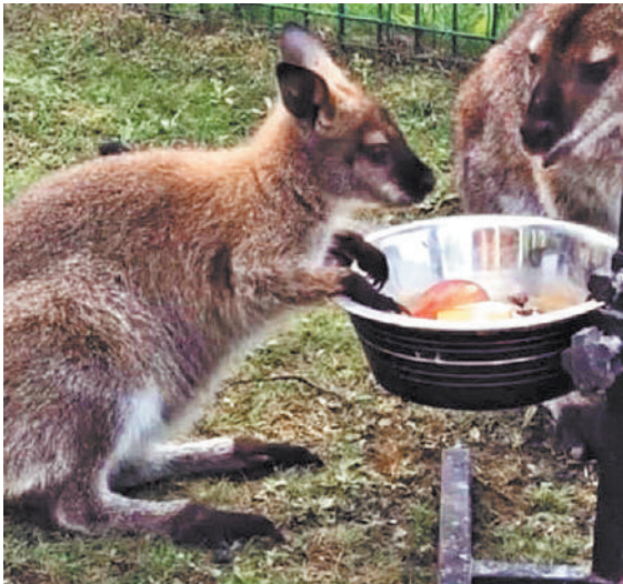
Если хоть один кенгуренок умрет, к статье «Кража» прибавится еще одна, по которой вору могут дать до трех лет тюрьмы.

Заметив пропажу животного, сотрудники зоопарка сразу обратились в полицию. Они говорят, что сам кенгуренок выбраться из вольера не мог. Место, где содержат кенгур, обнесено стальной сеткой высотой свыше трех метров. Впрочем, металлический забор преступника не остановил. Сразу после заявления о пропаже ярославская полиция начала проверку, которая в итоге вылилась в уголовное дело.