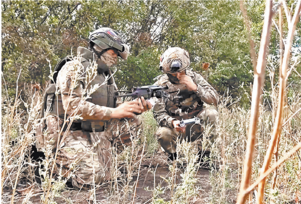
Операторы дронов из бригады морской пехоты к точечному залистовыванию позиций ВСУ прибегают регулярно.