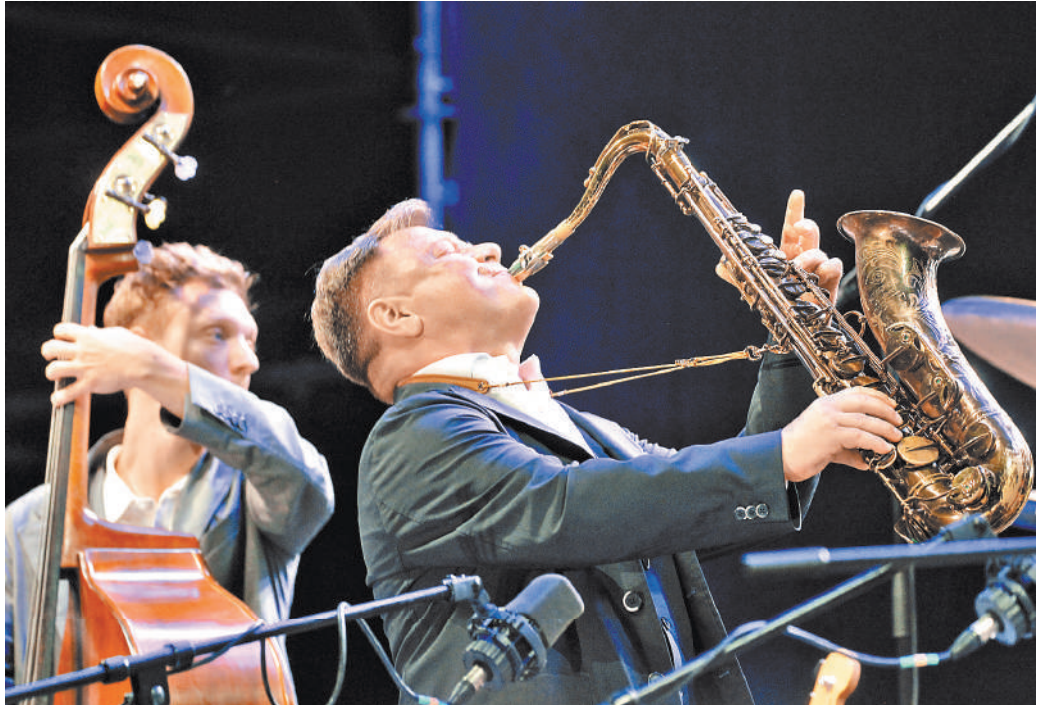
Игорь Бутман не перестает нас удивлять, потому что постоянно придумывает что-то свежее.

Игорь Бутман: Я знаю давление, которое испытывают джаз-клубы, куда меня приглашают. Так