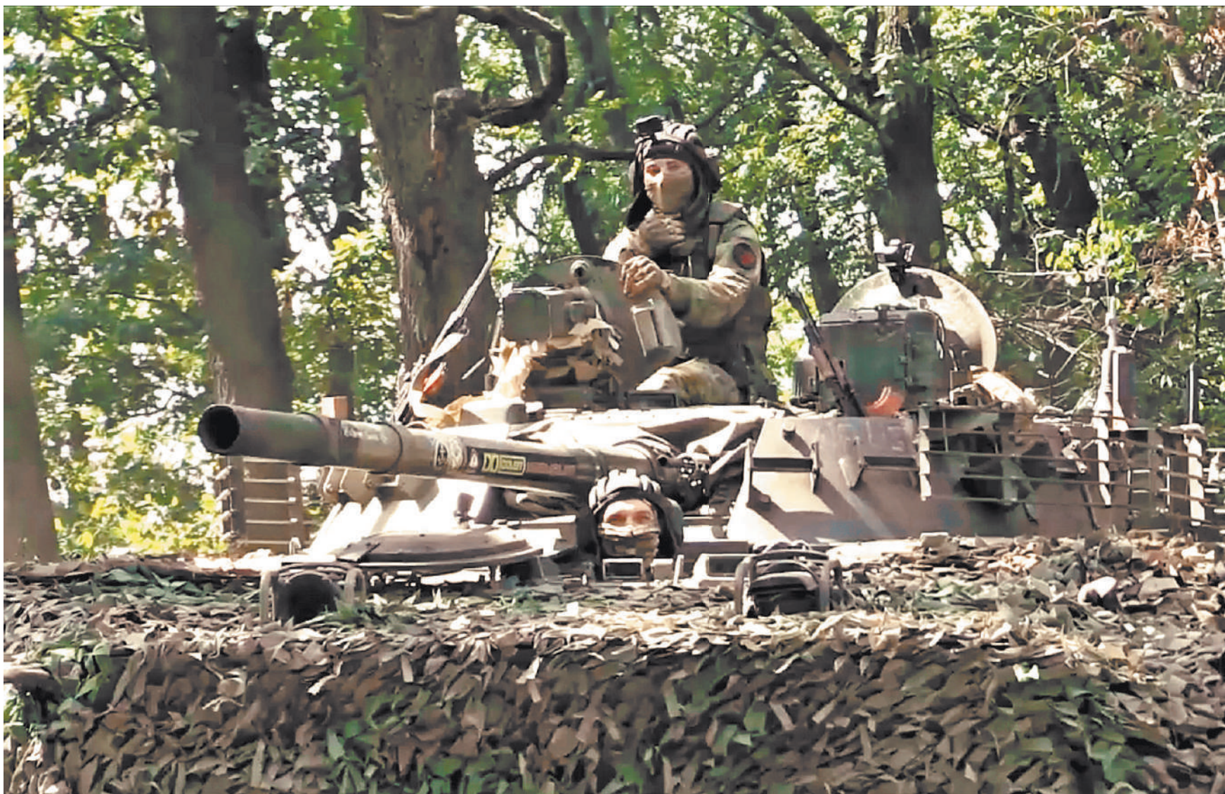
Морские пехотинцы в составе бронегрупп на БМП-3 смогли отрезать пути снабжения крупного гарнизона ВСУ на угледарском участке фронта, чем сильно помогли пехотинцам перед их штурмом.