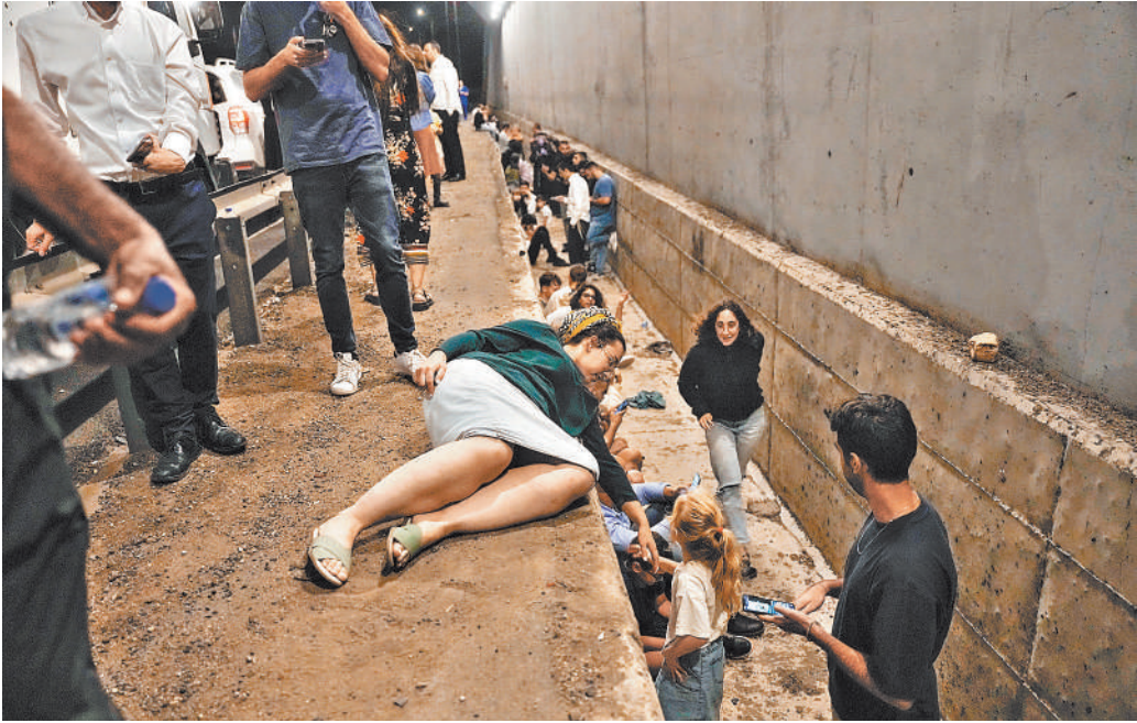
После того как в израильских городах прозвучали сирены ракетной угрозы, местные жители поспешили в укрытия.

жены места сосредоточения тяжелой военной техники и даже штаб-квартира разведки «Моссад». Впрочем, данных, подтверждающих или опровергающих эти заявления, мы не найдем: военная цензура Израиля работает эффективно. Ни фотографий горящих на летных полосах самолетов, ни видео взорванных танков никто не видел. До конца неясным остается даже тип ракет, которые применил Тегеран.