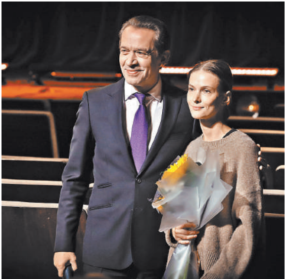
Владимир Машков с актрисой театра «Современник» Светланой Ивановой.

Сам худрук возьмется за «эпическое, густонаселенное полностью с чувственными актерскими работами» к юбилею Победы. Что это будет — подробности Машков не раскрыл, но подчеркнул, что занятые в премьере будут артисты и «Табакерки», и «Современника».