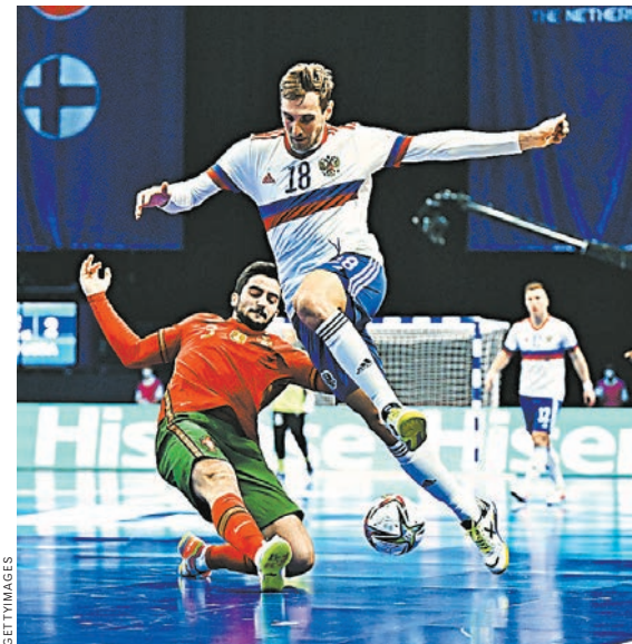
Россия в седьмой раз завоевала «серебро» чемпионата Европы.