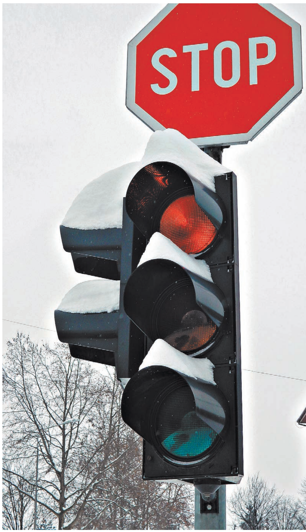
Тот, кто проехал на красный сигнал светофора, никаких преимуществ на дороге ни перед кем не имеет, по какой бы главной дороге он ни ехал. Ему никто не обязан уступать, и в аварии виноват будет он.

Верховный суд напомнил постановление Пленума ВС №20 от 25 июня 2019 года. В нем, в пункте 14, говорится, что при квалификации действий водителя, не уступившего дорогу транспортному средству, имеющему преимущество, необходимо учитывать, что преимущественным