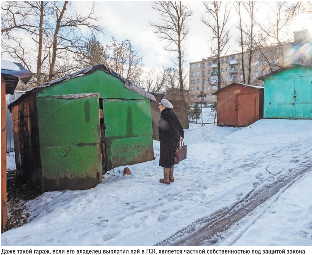
Даже такой гараж, если его владелец выплатил пай в ГСК, является частной собственностью под защитой закона.

— Постановление и разъяснения Верховного Суда РФ rg.ru/sujet/2605