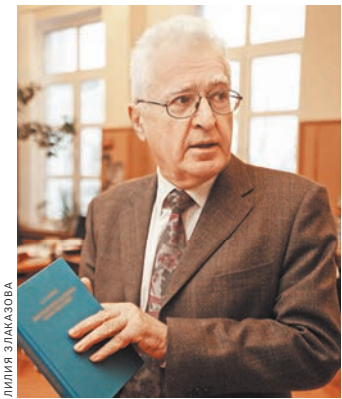
Абдусалам Гусейнов: Философствуют все, а философы редки.

АБДУСАЛАМ ГУСЕЙНОВ: У математиков свои трудности: они, например, не знают, что такое число. А у философов — свои. Философствуют все в той или иной мере — и дети, и взрослые, и высокообразованные, и не очень. Современная речь немислима без таких слов, как сознание, общество, истина, мораль, существование, идея и т.п., которые входят в предметную область философии. Они оформляют целостный взгляд на мир и в то же время люди часто не могут дать себе отчета в их содержании. В развитом обществе появляется потребность в тех, кто специально размышляет над этими общими идеями и пытается придать им более строгие обозначимые смыслы. Философы как раз и есть такие специалисты. Общество нуждается в них. Не всякий народ дорастает до того, чтобы внутри себя выделиться такой род занятий, как философия. Это знак цивилизованности страны.