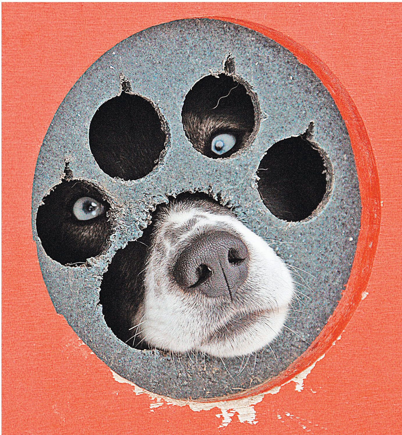
Бродячих собак, которые проявляют немотивированную агрессию к людям, не будут возвращать на волю даже после стерилизации.

Также прокуратура поддержала поправки в закон, которые наделяют субъекты РФ правом устанавливать дополнительные требования к содержанию и выгулу домашних животных. В то же время эти требования должны учитывать местные традиции, в том числе малых народов, которые, например, используют ездовых собак.