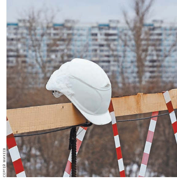
Верховный суд выступил против назначения маленьких сумм за моральный ущерб при производственных травмах.

Статья 212 ТК подчеркивает, что обеспечение безопасности труда — обязанность работодателя. А в статье 237 того же кодекса сказано про моральный вред. Он определяется по соглашению сторон. Если с соглашением не вышло, определить сумму морального страдания обязан суд. В Гражданском кодексе в статье 151 сказано, что суд при определении размера компенсации морального вреда должен учесть степень вины нарушителя