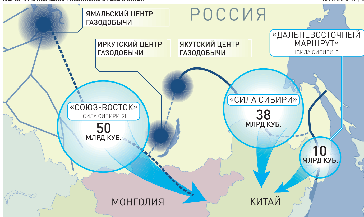
МАРШРУТЫ ПСТАВОК РОССИЙСКОГО ГАЗА В КИТАЙ