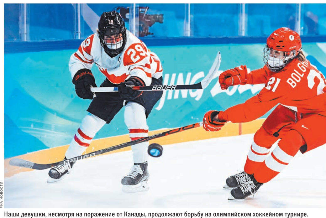
Наши девушки, несмотря на поражение от Канады, продолжают борьбу на олимпийском хоккейном турнире.

В итоге матч все-таки состоялся, но с часовым опозданием. Причем на лед обе команды вышли в медицинских масках. Официальное объяснение всех