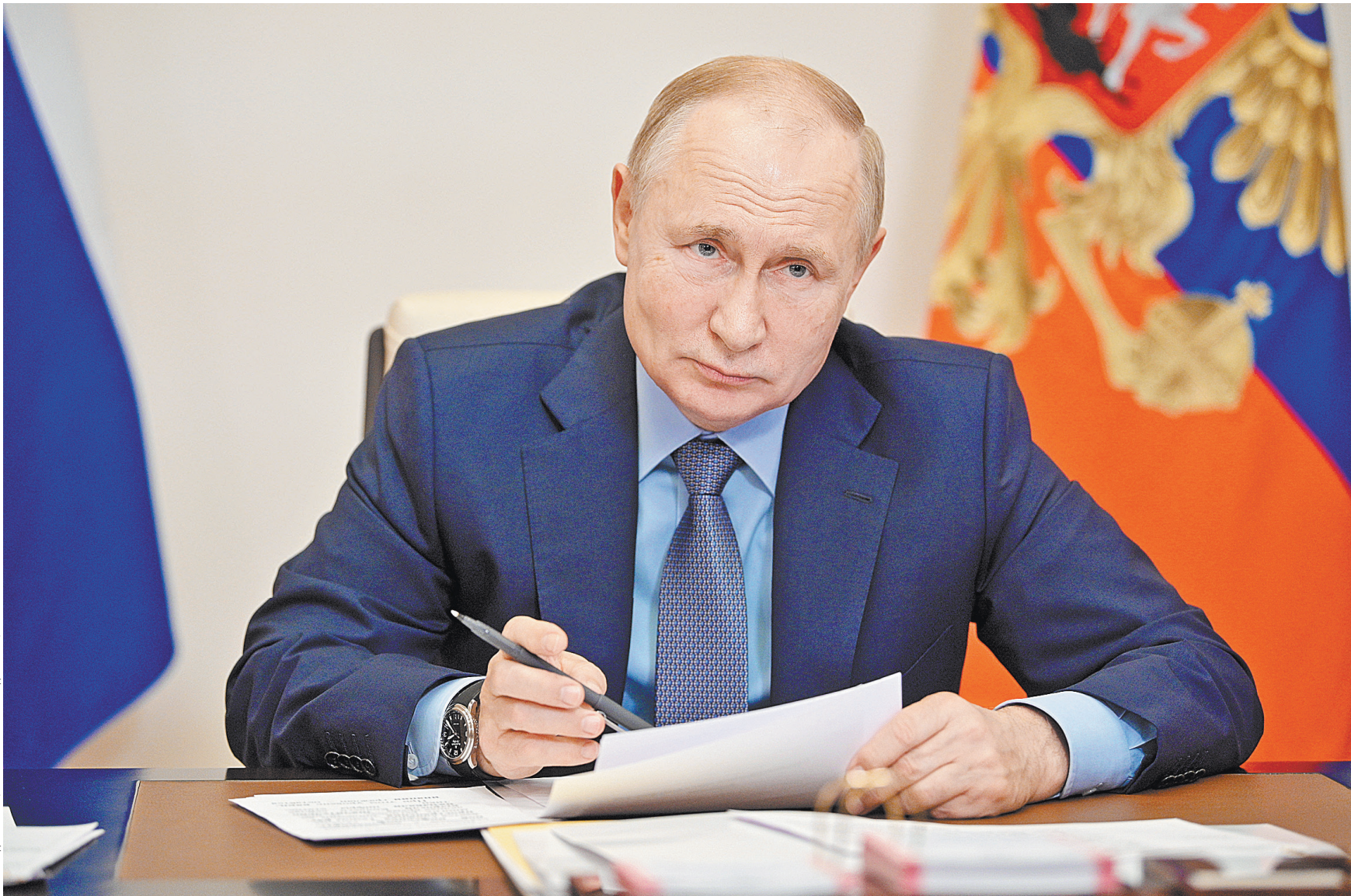
Президент — гражданам: Дорогие друзья, если у вас кто-то в семье заболел, то и вам необходимо тоже остаться дома.

«Пожалуйста, берите эту ответственность на себя, она вам передана, не затягивайте, принимайте необходимые решения», — сказал губернатору президент, решив поручить своим подпремам внимательно отслеживать это и если нужно — помогать. Путин также заметил, что темой борьбы с коронавирусом власти России занимаются каждый день, впрочем, как и весь мир. «Сей-