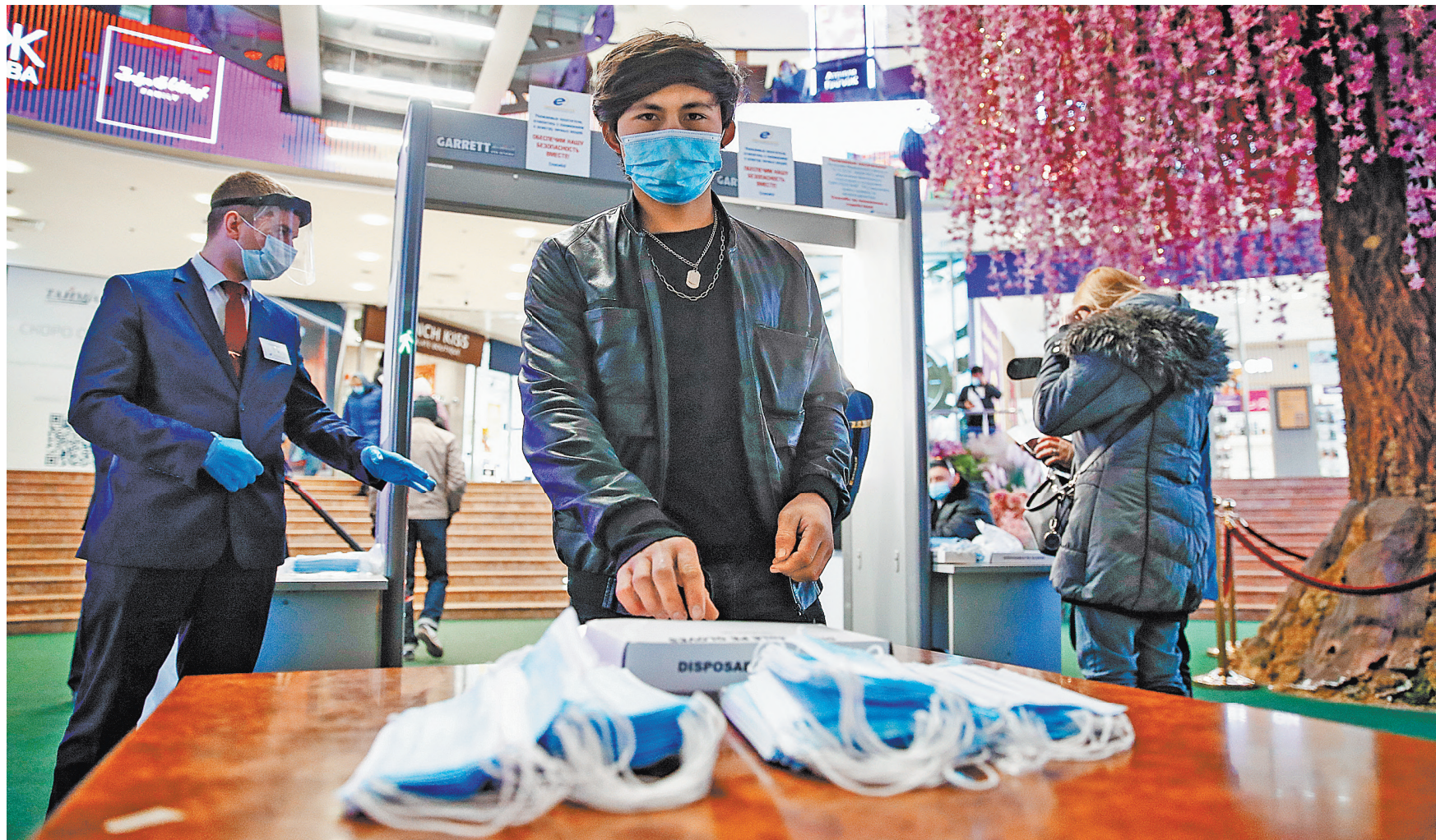
Во многих мегамоллах охрана уже встала на стражу масочного режима: маски проверяют не только на входах, но даже на эскалаторах и фудкортах.