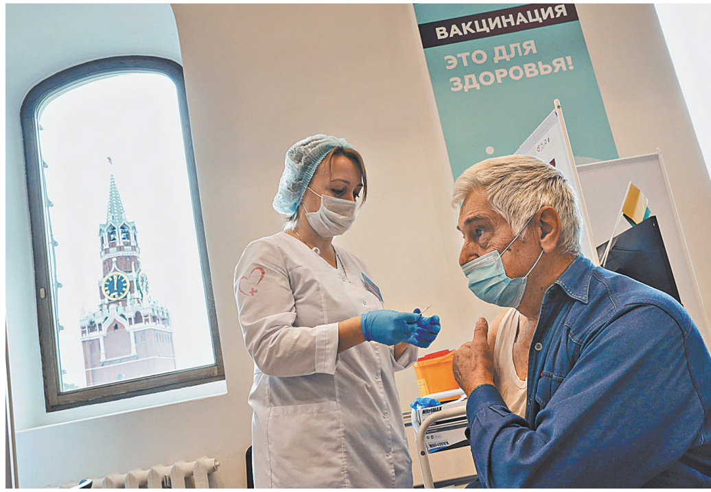
По данным властей, из всех пенсионеров Москвы привита только треть.

Могут. Так как эта мера направлена на сокращение передвижений жителей именно по Москве.