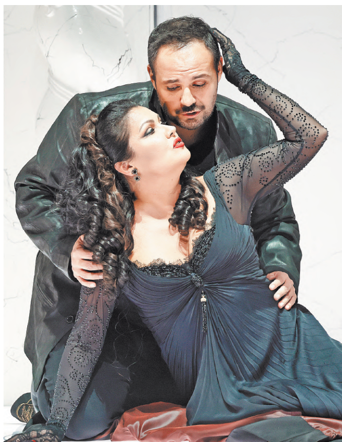
Анна Нетребко обещает еще вернуться к своей Тоске в Большом.

Пение Анны Нетребко по-настоящему завораживает. И знаменитая молитва главной героини становится настоящим апофеозом спектакля