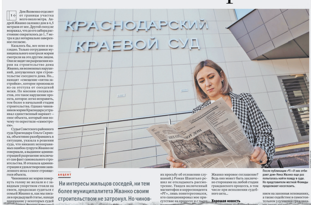
После этой публикации «РГ» губернатор края поручил мэрии Краснодара исправить ситуацию. Но пока «неизвестные лица» продолжают действовать так, как им выгодно.

звали «самостроем». В итоге мэрия Краснодара, не учитывая, что это единственное жилье семьи с малышами и забыв почему-то о ранее выданных документах на строительство дома, поддала в суд иск о его сносе! Хотя семья, взявшаяся собственными силами улучшить жилищные условия, своими действиями ничьи интересы не нарушала. Как вы думаете, при обычных обстоятельствах это реально?