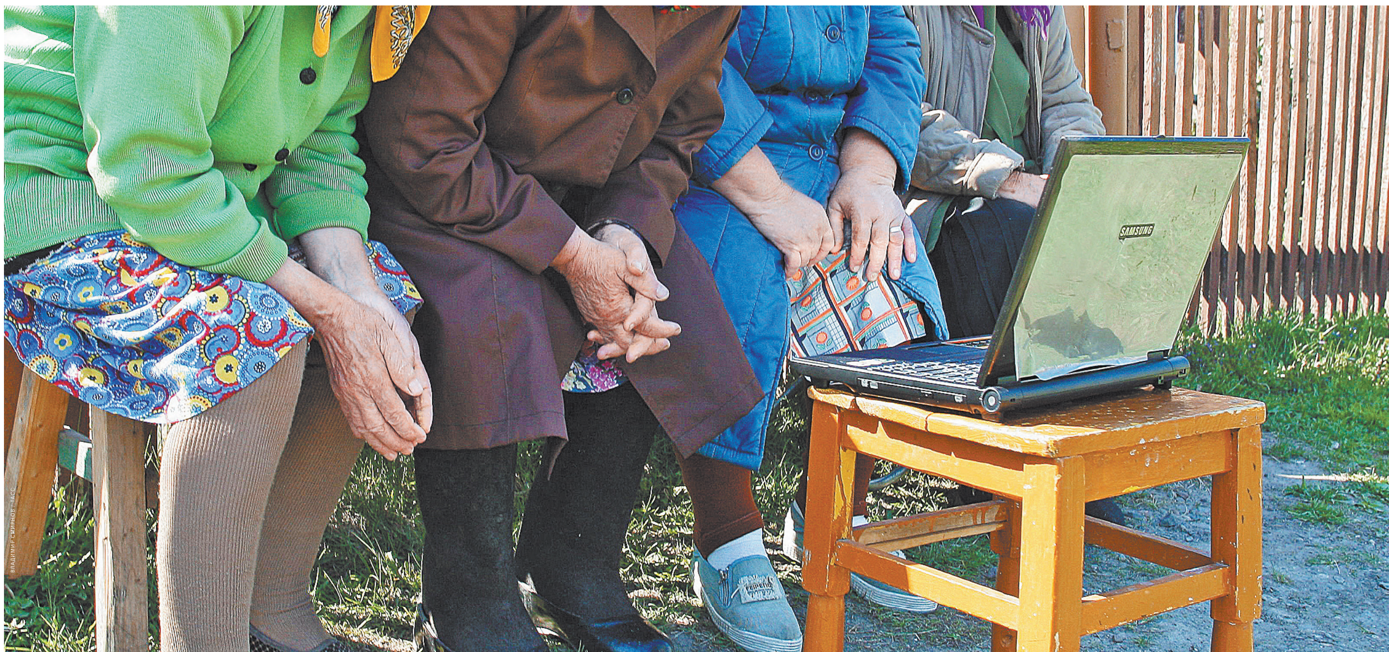
Разве виноваты нагруженные руки наших бабушек, что они не так ловко управляют с мышкой и клавиатурой компьютера?