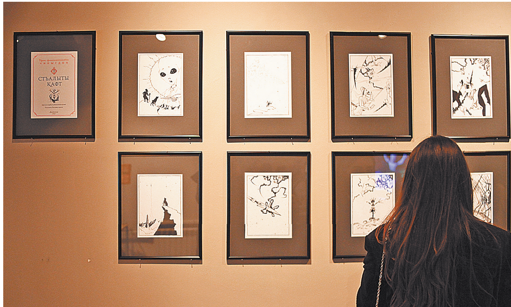
Представлено международным фестивалем современного искусства «Аланика».