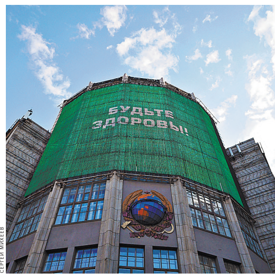
Этот глобус из пластика установили в 2010 году, во время реставрации вернут металлический остекленный вариант.