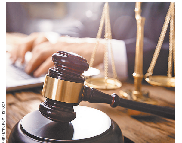
За шесть месяцев присяжные оправдали 196 человек. Это абсолютный рекорд.

— Экономические дела хотят разрешить рассматривать присяжным rg.ru/art/2155794