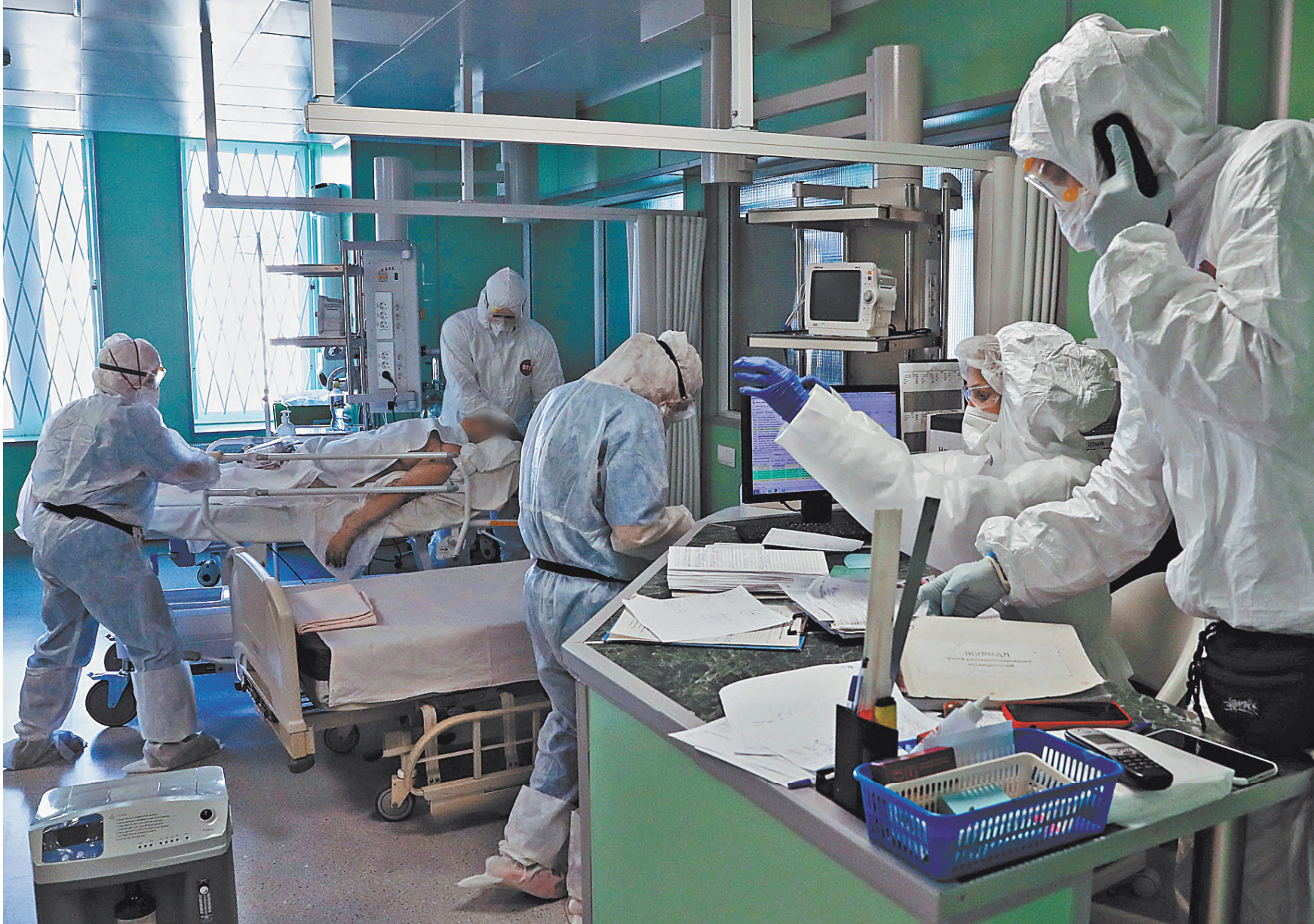
Число выявленных новых случаев ковида за сутки приближается к 35 тысячам, сообщила Татьяна Голикова.

Следующая мера — неукоснительная изоляция контактных лиц и людей с подтвержденным