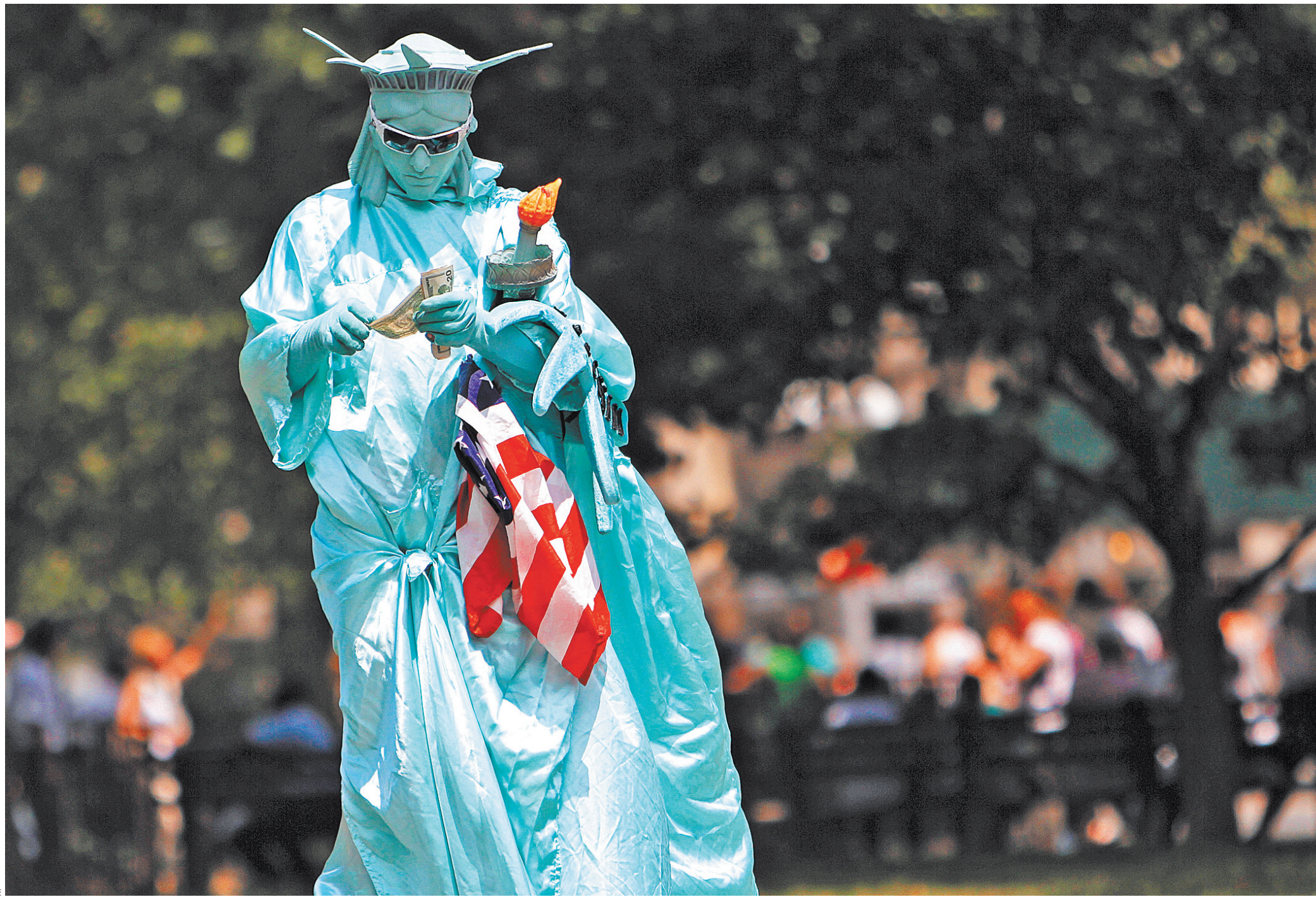
Культура капитализма в Америке постепенно сходит на нет: все больше граждан считают, что он на руку только богатым, и проникаются социализмом.

Американцы могут разделять идеи, не подозревая, к какому течению они относятся, но сами слова «марксизм», «коммунизм» и «социализм» со времен «холодной войны» остаются едва ли не ругательством. В США для политика открыто называть себя марксистом или социалистом — прямой путь в никуда. «Американцы не хотят, чтобы их считали марксистами, но они не знают принципов марксизма, и по незнанию поддерживают их», — поясняют исследователи. — Примерно 10 процентов американцев срослись с марксистскими идеями и ежедневно исходят из