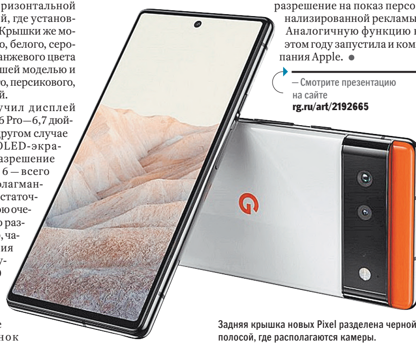
Задняя крышка новых Pixel разделена черной полосой, где располагаются камеры.

— Смотрите презентацию на сайте rg.ru/art/2192665