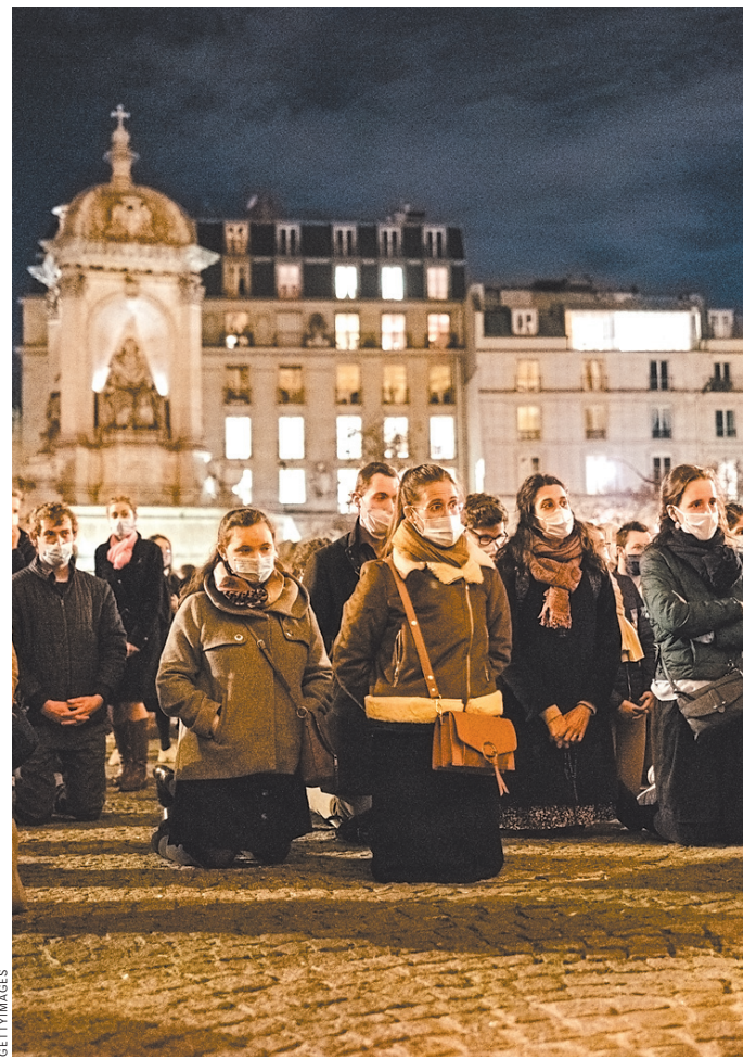
Несколько сотен католиков собрались перед церковью Сен-Сюльпис в Париже, чтобы принять участие в мессе под открытым небом.

В качестве альтернативной меры церковь предложила транслировать мессы с помощью социальных сетей и прочих современных информационных возможностей. Многие за неимением лучшего этим воспользовались, но довольно быстро