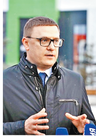
Алексей Текслер: С точки зрения капитальных затрат эффективность проекта высока.

Место для будущего госпиталя также искали, исповедуя рациональный подход. Остановились на участке в поселке Маяля