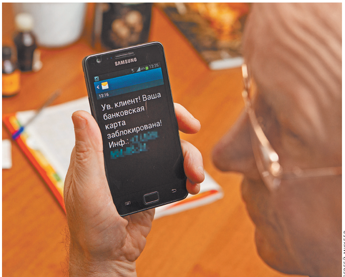
Операторы будут блокировать телефонные номера, по которым от абонентов поступают жалобы на спам и мошенничество.

В результате реформы нефтяники заплатят за пять лет на 650 миллиардов рублей налогов больше