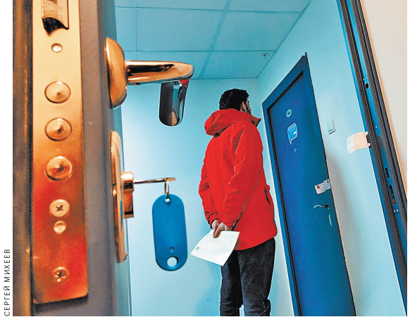
Соглашение о разделе недвижимости супруги подписывают добровольно. Поэтому оно пересмотру не подлежит.

Краевой суд частично отменил решение городского суда и вынес новое — он признал соглашение о разделе имущества недействительным. Кроме того, краевой суд применил последствия недействительности сделки и взыскал с бывшей супруги в пользу ее бывшего 700 000 рублей компенсации.