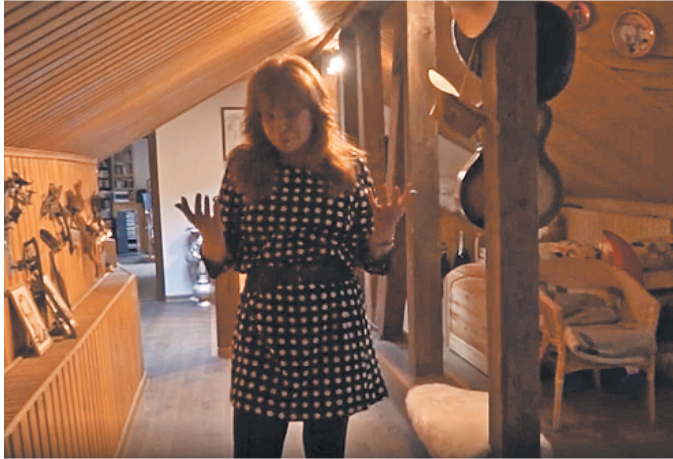
Достижения выдающейся фигуристки вызвали и вызывают у ее поклонников только уважение.

Специальные пенсии получают 459 тысяч человек, пострадавших в результате радиационных и техногенных катастроф и члены их семей, в среднем 13 тысяч человек. Наиболее крупные государственные пенсии — у 78 тысяч бывших федеральных госслужа-