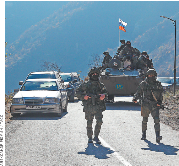
В Нагорном Карабахе наши миротворцы выставили 25 наблюдательных постов. Некоторые из них — временные.

«На его территории будет мониторинговый центр. Туда нужно отправить турецких военных. Это выполнение внутренних процедур, предусмотренных законодательством Турецкой Республики. Это внутреннее дело Турции. А что касается договоренности о создании совместного мониторингового центра на территории Азербайджана, то это продукт двусторонней договоренности России и Турции», — объяснил Песков. ●