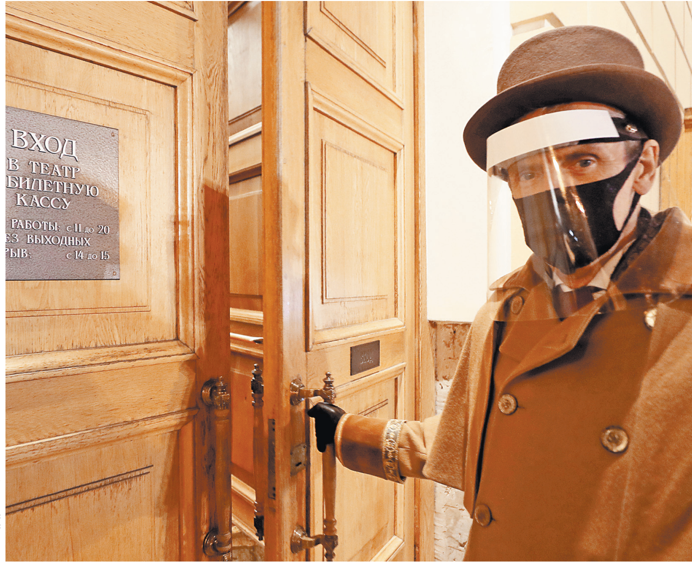
С некоторых пор маски стали обязательным атрибутом для всех нижегородских театралов.

Кстати, «Нетеатр» один раз показал спектакль по специально написанной пьесе «Автобус». А чтобы не нарушать запрет, спектакль показывали в няном автобусе, колесившем по центральных улицам Нижнего Новгорода.