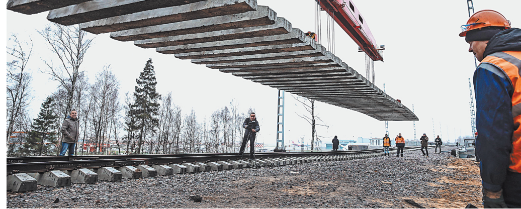
Вот так укладывают железнодорожное полотно, которое приведет пассажиров прямо к самолетам.