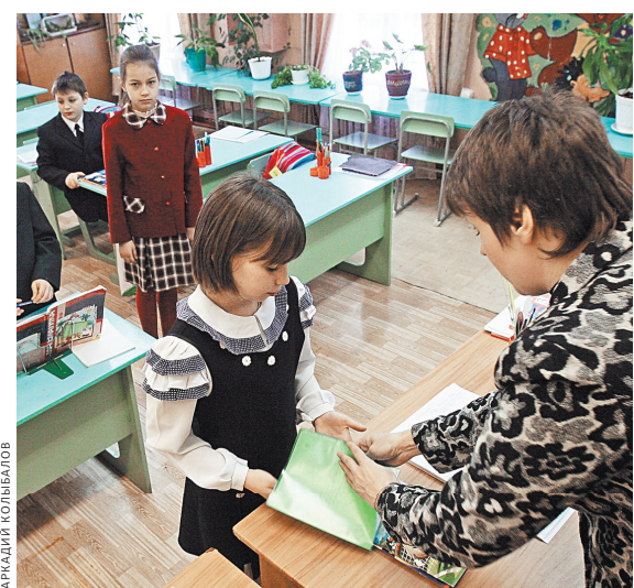
Есть села, куда учителей доставляют на вертолете. Это по-настоящему подвижная работа.