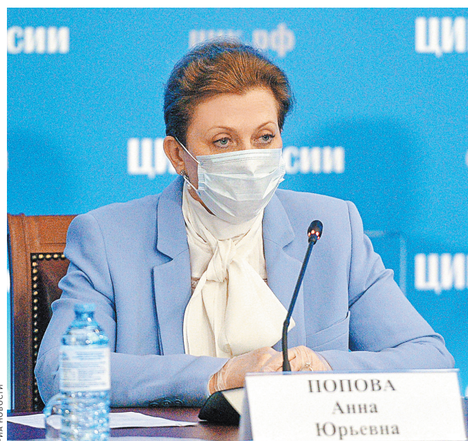
Глава Роспотребнадзора Анна Попова сократила время проведения тестов на COVID-19 до 48 часов.

В приказе минздрава говорится, что пациентов из больницы можно переводить на домашнее долечивание еще до получения отрицательного теста на COVID-19. Но только при условии, что есть отдельная комната. Лариса Попович пояснила, что когда больной большую часть времени проводит в отдельной комнате, риск инфицирования других членов семьи заметно снижается. Да и ученые сейчас придерживаются мнения, что хоть коронавирус и передается воздушно-капельным путем, но чтобы один человек заразился от другого, он должен находиться совсем рядом с больным. При этом больной должен кашлять и чихать непосредственно на другого человека. Социальная дистанция спасает от заражения так же, как и маска. ●