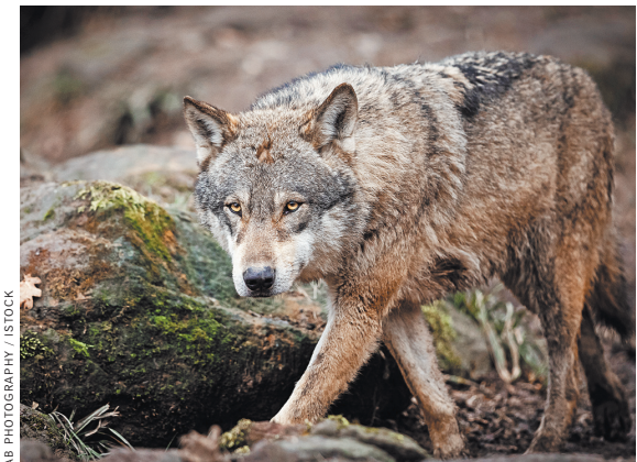
В целом в Тамбовской области могут обитать одновременно не больше 175 волков — таковы нормативы.