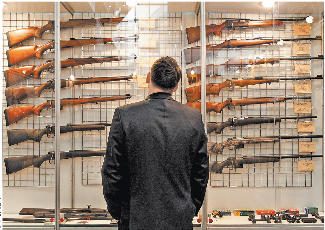
Возможно, вскоре вопрос, какой ствол выбрать — гладкий или нарезной, потеряет смысл.

Что же конкретно должны исследовать эксперты МГУ? Оказывается, они должны выяснить, есть ли различия между гладкоствольными ружьями со стволами «Ланкастер» и нарезными стволами. Или же никаких существенных различий между ними нет.