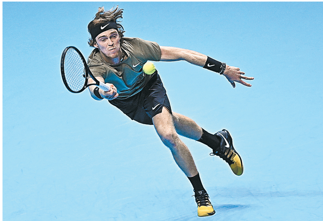
У Андрея Рублева пока мало опыта в игре с такими топовыми теннисистами, как Надаль, Федерер или Джокович.

Следующая Пленарная ассамблея пройдет в Париже 23–24 апреля 2021 года.