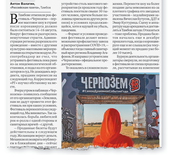
О том, что рок-фестиваль из-за пандемии перенесли на следующий год, «РГ» писала в номере от 13 августа.