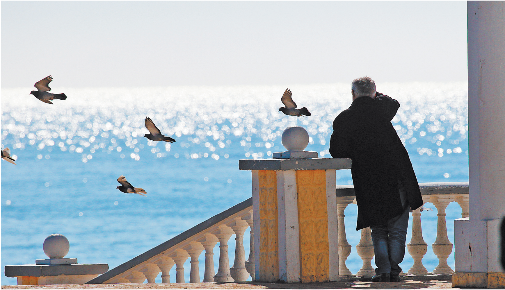
Благодаря программе поддержки внутреннего туризма кто-то сэкономит на поездке по обычному маршруту, а кто-то отправится в путешествие, о котором мечтал всю жизнь.