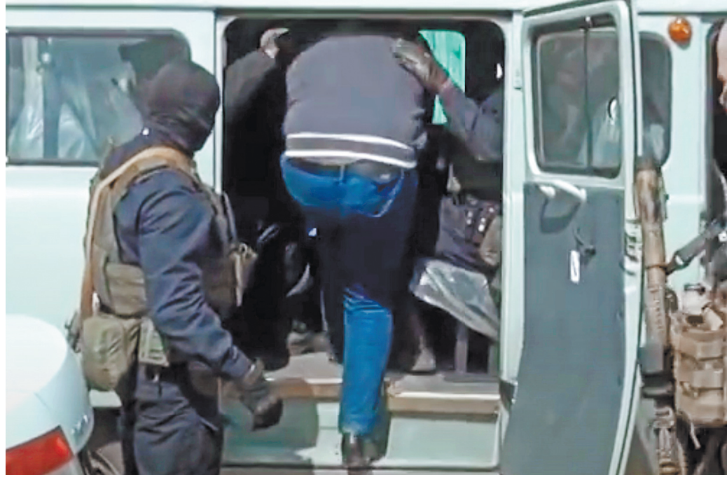
Один лишь факт того, что человек носит звание «вор в законе», может стать основанием для обвинения.

В итоге Верховный суд отменил апелляционное решение и отправил дело на новое рассмотрение в суд второй инстанции. ●