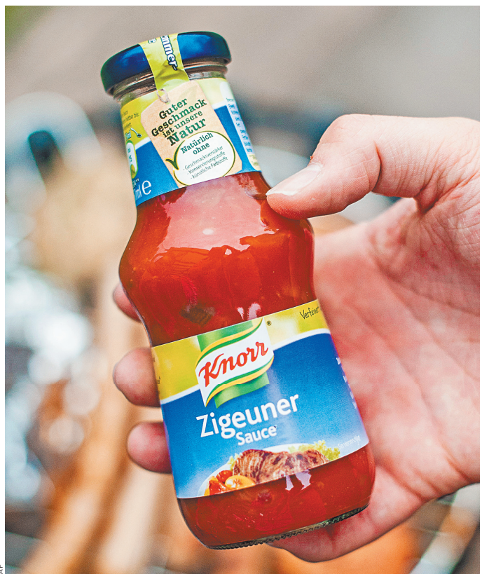
Соус «Цыганский» упоминается еще в кулинарных книгах начала прошлого века. Теперь некоторые в Германии углади в его названии расизм.