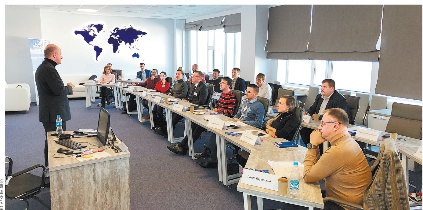
Старт программы МРА в ДВФУ.

Опыт ведущих экспертов для построения вашего бизнеса. Через программу Executive MBA, впервые запущенную на Восточном экономическом форуме в 2017 году, прошли уже более 50 руководителей высшего звена и собственников бизнеса со всего Дальнего Востока.