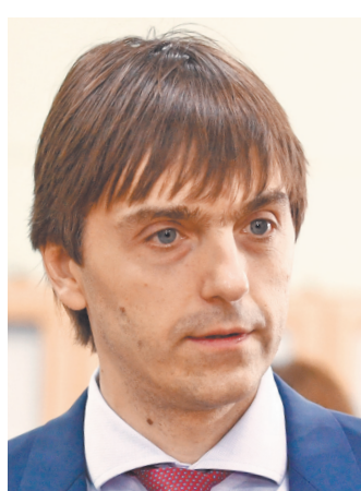
Сергей Сергеевич Кравцов Министр просвещения РФ