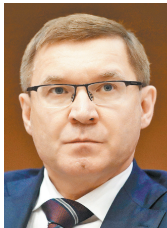
Владимир Владимирович Якушев Министр строительства и жилищно-коммунального хозяйства РФ