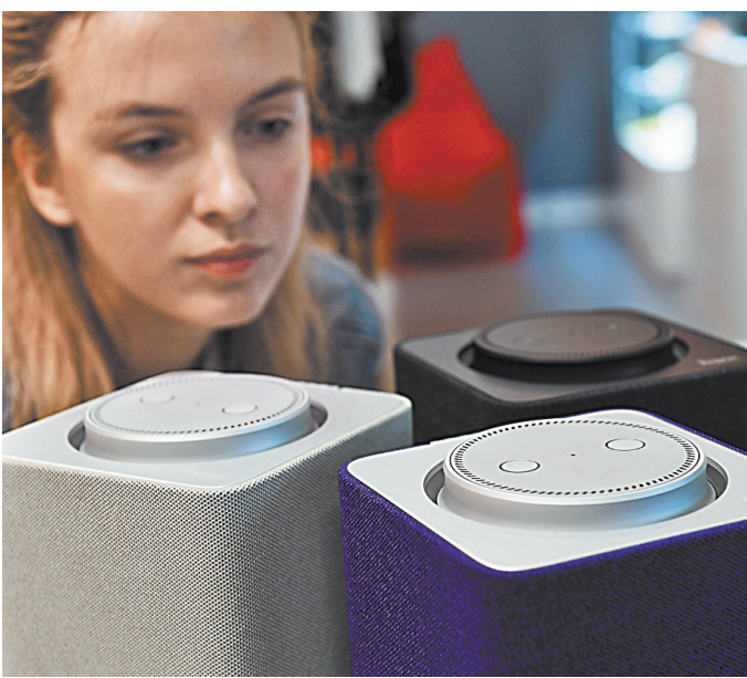
Пока спрос на колонки сдерживают цены, но они будут снижаться.