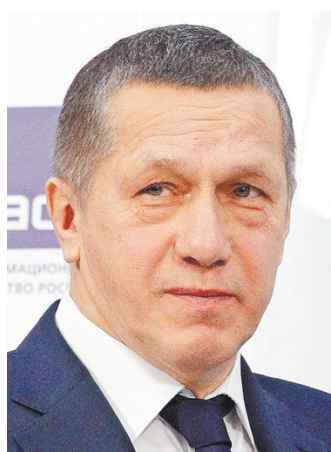
Юрий Петрович Трутнев Заместитель Председателя Правительства РФ — полномочный представитель Президента РФ в Дальневосточном федеральном округе