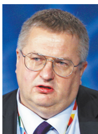
Алексей Логвинович Оверчук Заместитель Председателя Правительства РФ