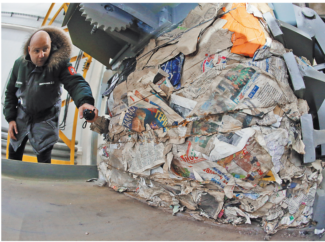
Тестовые автомобили с раздельно собранным мусором уже пошли в новый экотехнопарк.