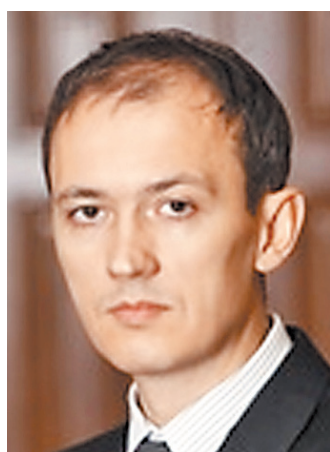
Дмитрий Юрьевич Григоренко, Заместитель Председателя Правительства РФ — Руководитель Аппарата Правительства РФ