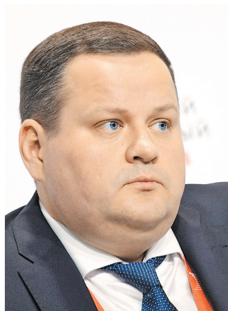
Антон Олегович Котяков Министр труда и социальной защиты РФ