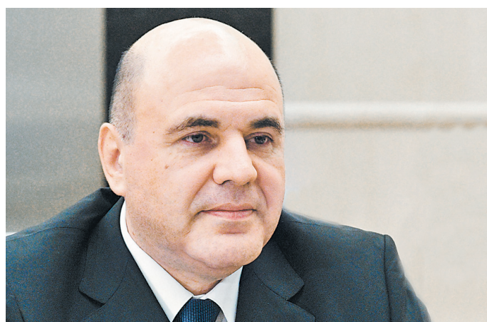
Михаил Владимирович Мишустин Председатель Правительства Российской Федерации