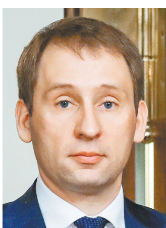
Александр Александрович Козлов Министр РФ по развитию Дальнего Востока и Арктики