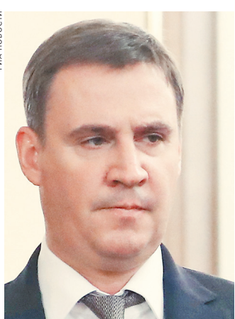
Дмитрий Николаевич Патрушев Министр сельского хозяйства РФ