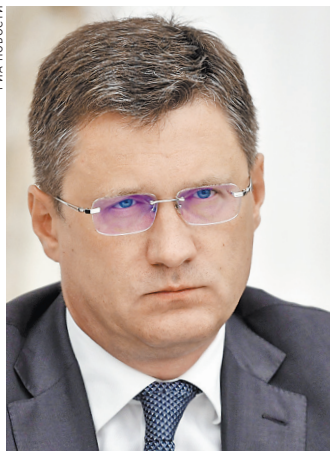
Александр Валентинович Новак Министр энергетики РФ