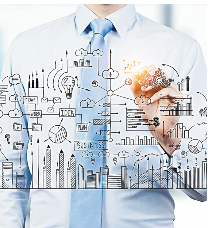
Идеи важны, но их успешное внедрение зависит от многих составляющих.