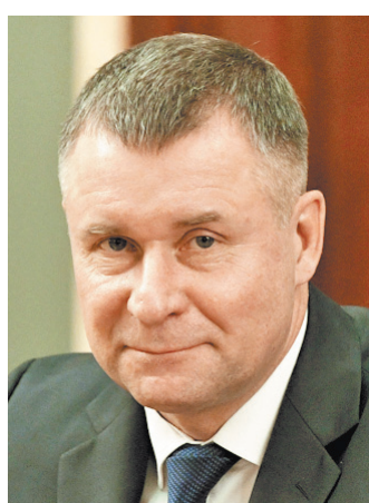
Евгений Николаевич Зиничев Министр РФ по делам гражданской обороны, чрезвычайным ситуациям и ликвидации последствий стихийных бедствий