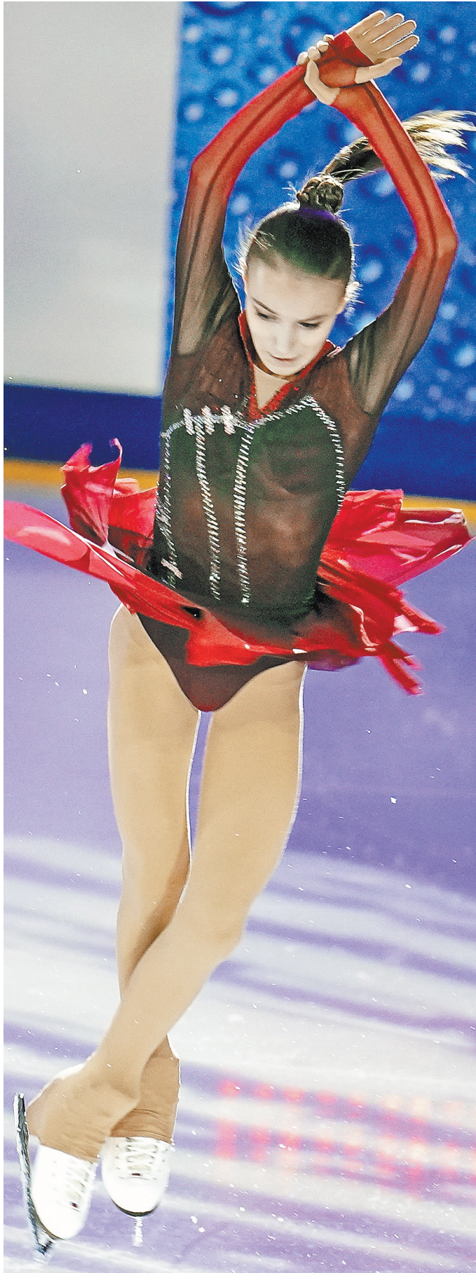
Анна Щербакова прыгает четверной лутц. Не всем мужчинам это под силу.

четверных» занимала третье место, потому что упорно шла на риск (хотя в Красноярске набор прыжков по состоянию тренеров все же упростили), творила историю, но ошибалась. На этапах серии Гран-при выиграть получалось даже с падениями, настолько Трусова была вне конкуренции. Но ко-