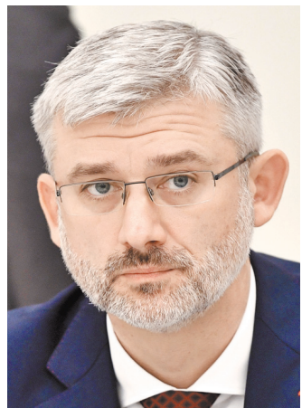
Евгений Иванович Дмитриев Министр транспорта РФ