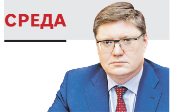
Андрей Исаев первый заместитель руководителя фракции «Единая Россия» в Государственной Думе

НОВЫЙ ФОРМАТ В двух городах интернет-ритейлер открыл постаматы в подземке. Стоит ли удобство безопасности?