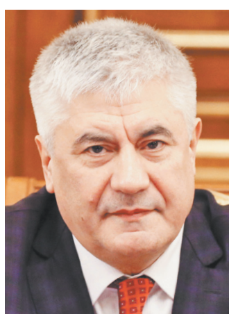
Владимир Александрович Колокольцев Министр внутренних дел РФ