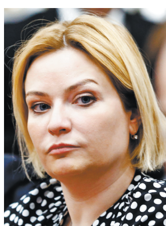
Ольга Борисовна Любимова Министр культуры РФ