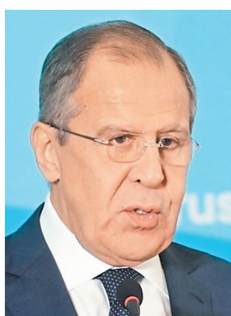
Сергей Викторович Лавров Министр иностранных дел РФ