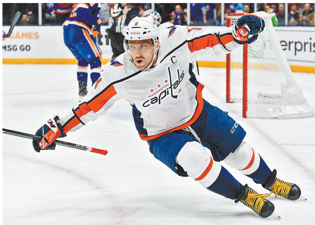
На прошлой неделе Овечкин забросил восемь шайб в матчах регулярного чемпионата НХЛ.

Интересно, что помимо игры в хоккее Овечкин продолжает радовать подписчиков своего Instagram необычными фотографиями. Накануне Саша опробовал в Instagram массу-тест со случайным результатом, которая определила, кем он является в мире мультяшек Диснея. Овечкин был изрядно удивлен, когда ему достался персонаж веселого, но неуклюжего снеговика Олафа из мультяшки «Холодное сердце». В эти же дни за океаном были опубликованы результаты анонимного опроса хоккеистов НХЛ, который провело издание The Athletic. Игроки сами определили пятерку лучших в Лиге. А удивлению, россиянин во главе с Овечкиным в списке не оказался. Первое место занял Коннор Макдэвид из «Эдмонтон», предпочтению которому отдали 53%