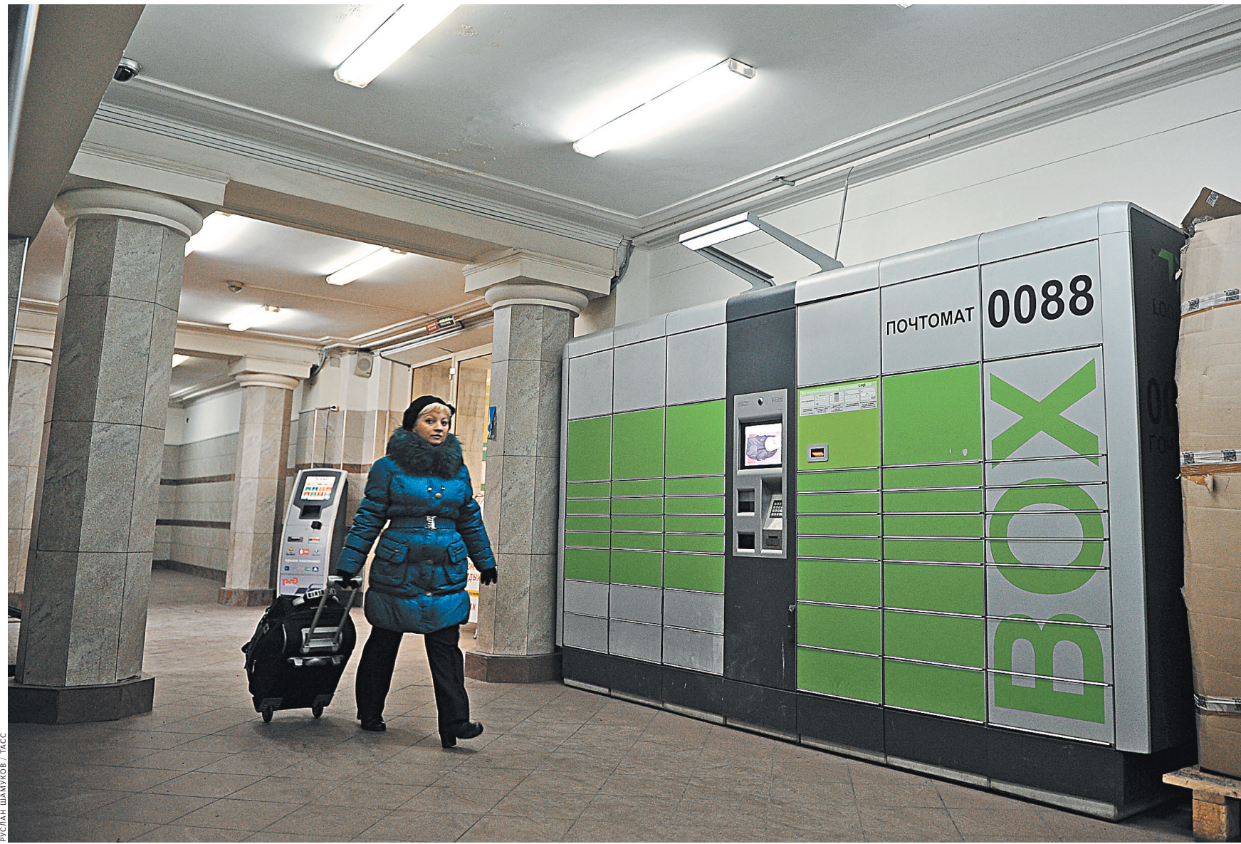
С точки зрения безопасности уже существующая экспресс-доставка почтовых грузов в метро особых хлопот не добавляет: сейчас не нужно даже вскрывать посылку, чтобы определить угрозу.

Однако президент совершенно справедливо указал на то, что нельзя забывать и о самоотверженности тех, кто работал в тылу. Во время Великой Отечественной войны миллионы советских граждан, недосыпая, недоеда, стояли у станков и показывали пример трудовой доблести.