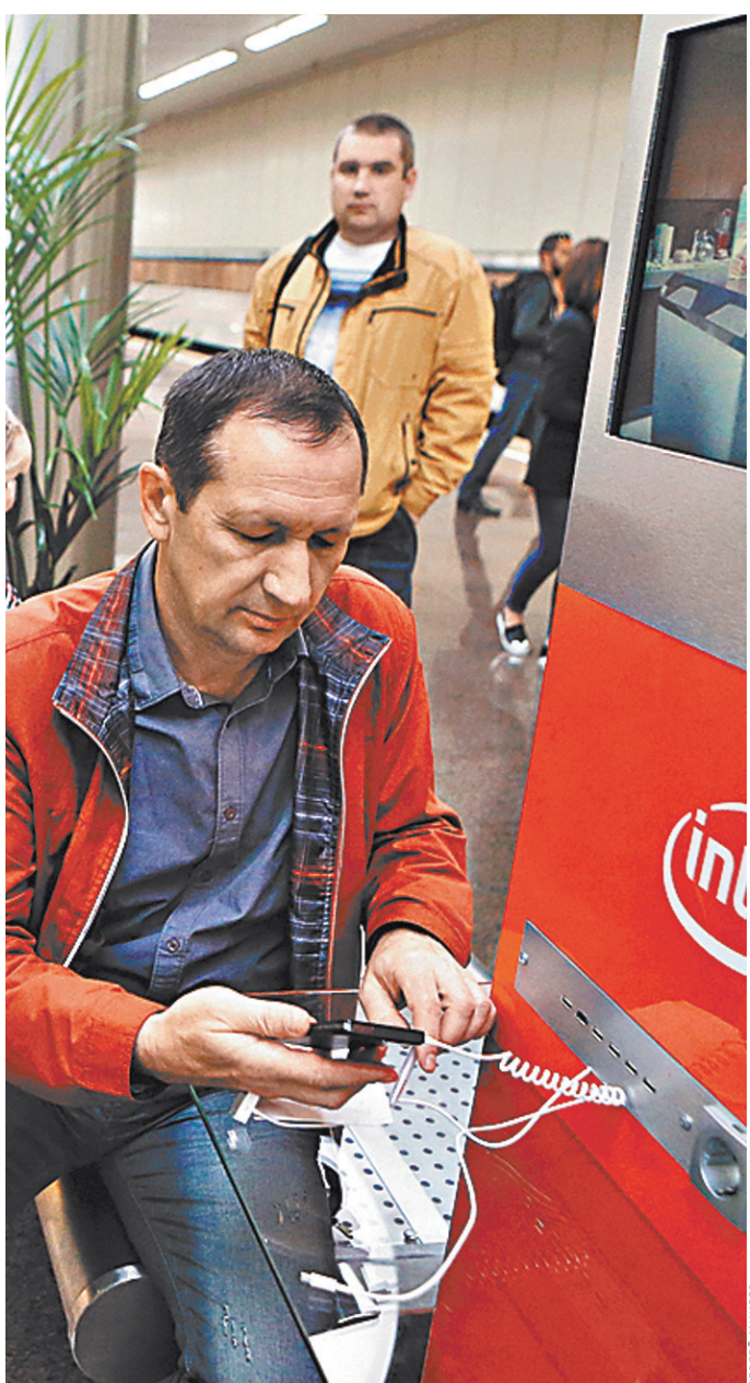
Общественные зарядки очень удобны, но лучше иметь при себе power bank.