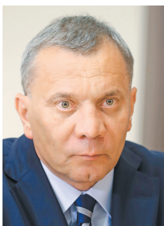
Юрий Иванович Борисов Заместитель Председателя Правительства РФ