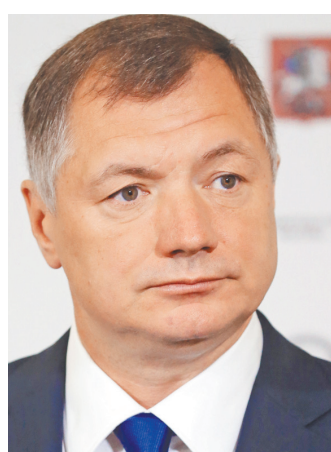
Марат Шакирзянович Хуснулнизов Заместитель Председателя Правительства РФ