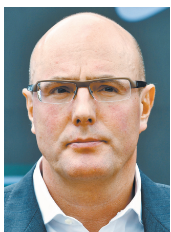
Дмитрий Николаевич Чернышенко Заместитель Председателя Правительства РФ