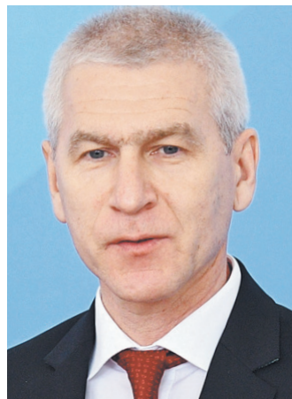
Олег Васильевич Матыцин Министр спорта РФ