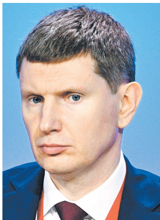
Максим Геннадьевич Решетников Министр экономического развития РФ