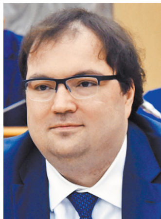
Максим Игоревич Шадаев Министр цифрового развития, связи и массовых коммуникаций РФ