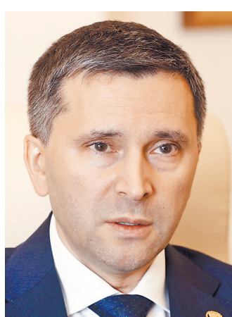
Дмитрий Николаевич Кобылкин Министр природных ресурсов и экологии РФ