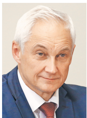
Андрей Рамонович Белоусов Первый заместитель Председателя Правительства РФ