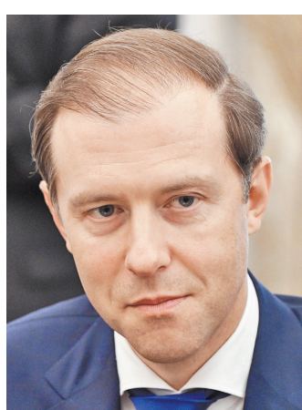
Денис Валентинович Мантуров Министр промышленности и торговли РФ