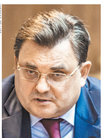
Константин Анатольевич Чуйченко Министр юстиции РФ