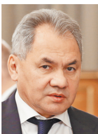
Сергей Кужугетович Шойгу Министр обороны РФ