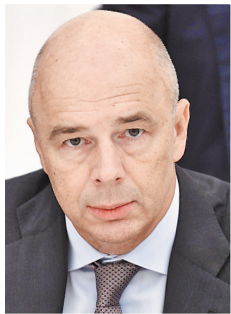
Антон Германович Силуанов Министр финансов РФ