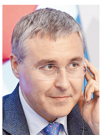
Валерий Николаевич Фальков Министр науки и высшего образования РФ