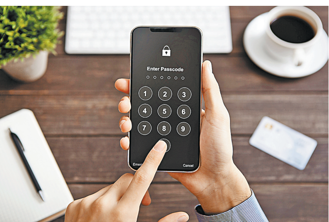
Операторы уже начали тестировать идентификацию смартфонов по IMEI.

будет предложено отсрочка в регистрации», — отметил он. — Также открыт вопрос о определении устройств иностранных граждан, которые приезжают в РФ по рабочим вопросам или в качестве туристов. В любом случае, реализация этой идеи потребует серьезной проработки и большого числа подзаконных актов». Как уточнили в Россвязи, по плану пилотный проект должен быть полностью завершен до момента вступления в силу законодательных норм.