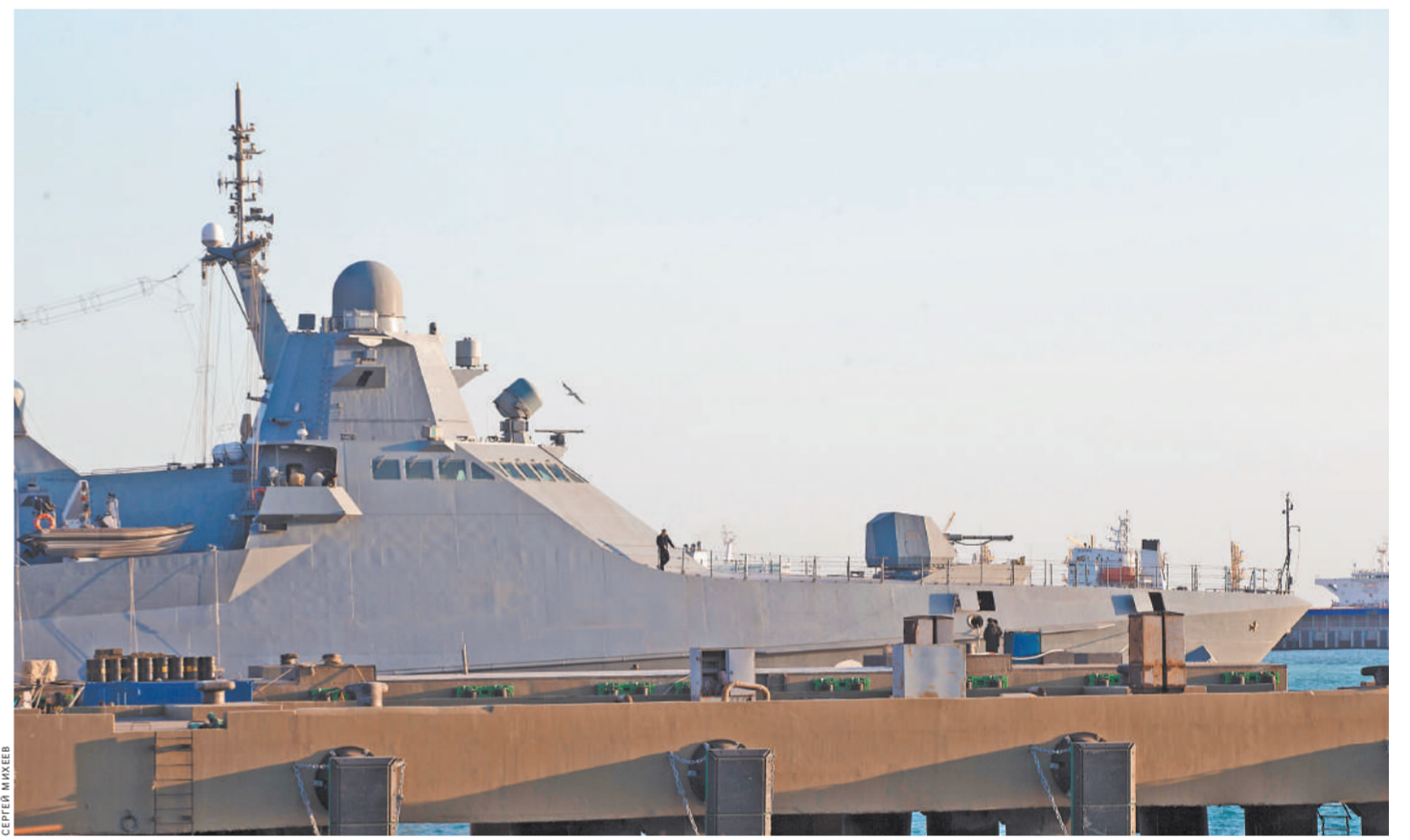
Корабль проекта 22160: почти не виден на экранах радаров, вооружение модульное, т.е. на его борту именно то оружие, которое нужно для выполнения задачи.