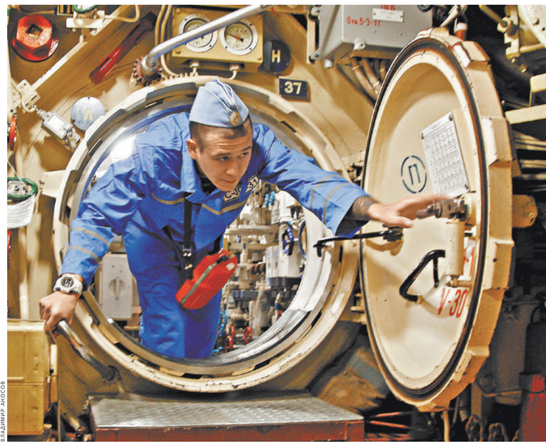
На борту субмарины-невидимки. На базе подлодки неуязвимы, а уходя под воду, как будто исчезают в «черной дыре».