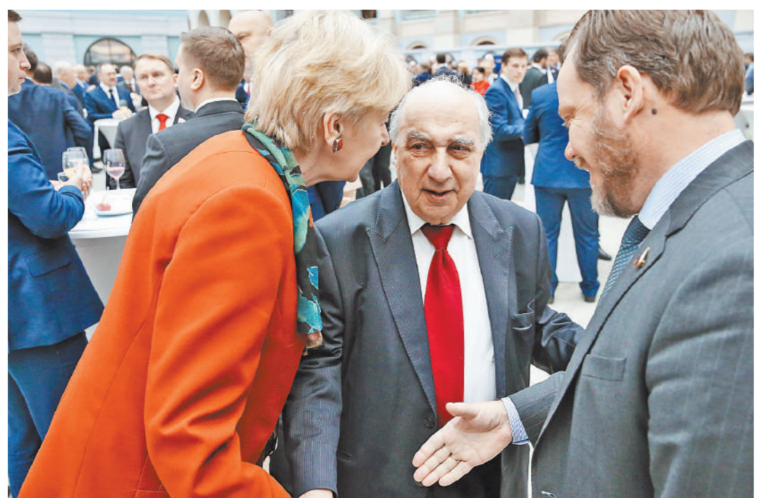
Представители старшего поколения (в центре — известный российский историк Александр Чубарьян) многие свои надежды связывают с национальными проектами, на реализацию которых нацеливает Послание.

это договор, который подписывают граждане и государство, позволяющий семье выйти из бедности. В рамках контракта семья берет на себя определенные обязательства, а государство оказывает ей помощь. Как ранее пояснил «РГ» министр труда и соцзащиты Максим Топилин, например, семья обязуется наладить работу в личном подсобном хозяйстве или открыть малый бизнес, или кто-то из членов семьи пройдет переобучение и устроится на работу. Государство дает на это деньги и взамен на активные действия семьи. В настоящий момент технологию соцконтракта регионы реализуют за счет собственных средств. Начался эта работа в 2013 году. В 2017 году (данных за 2018-й еще нет) средний размер помощи составил 38,2 тысячи рублей. При этом 41,7 процента получателей соцконтракта вышли из бедности.