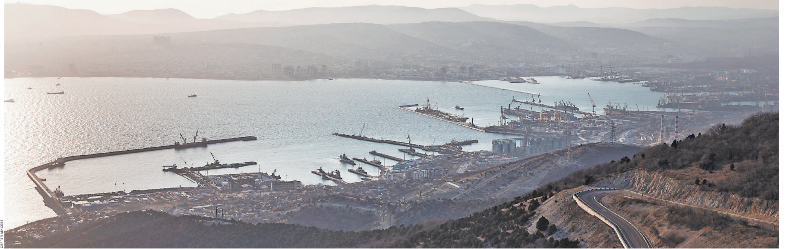
Одного взгляда на Геопорт достаточно, чтобы понять сакральное значение фразы «тихая гавань». В бухте может бушевать шторм, а за молами — тишь да гладь. Слева на фото 1400-метровый Восточный мол: он на 50-метровых сваях, создающих подобие подводных «крепостных стен».

К слову, бетон готовят на берегу, и чтобы он не застыл (на заполнение каждой сваи уходит до 90 кубов), у строителей есть не больше 6 часов: за это время надо успеть погрузить раствор на судно и вывезти к месту уста-