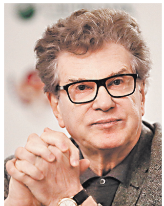
Президент премии и фестиваля — Игорь Костолевский.

В драме лидерами по числу номинаций стали те театры, которые вышли за рамки своих жанров. Театр Наций номинирован за драматический спектакль «Иранская конференция» и мюзикл «Стиляги».