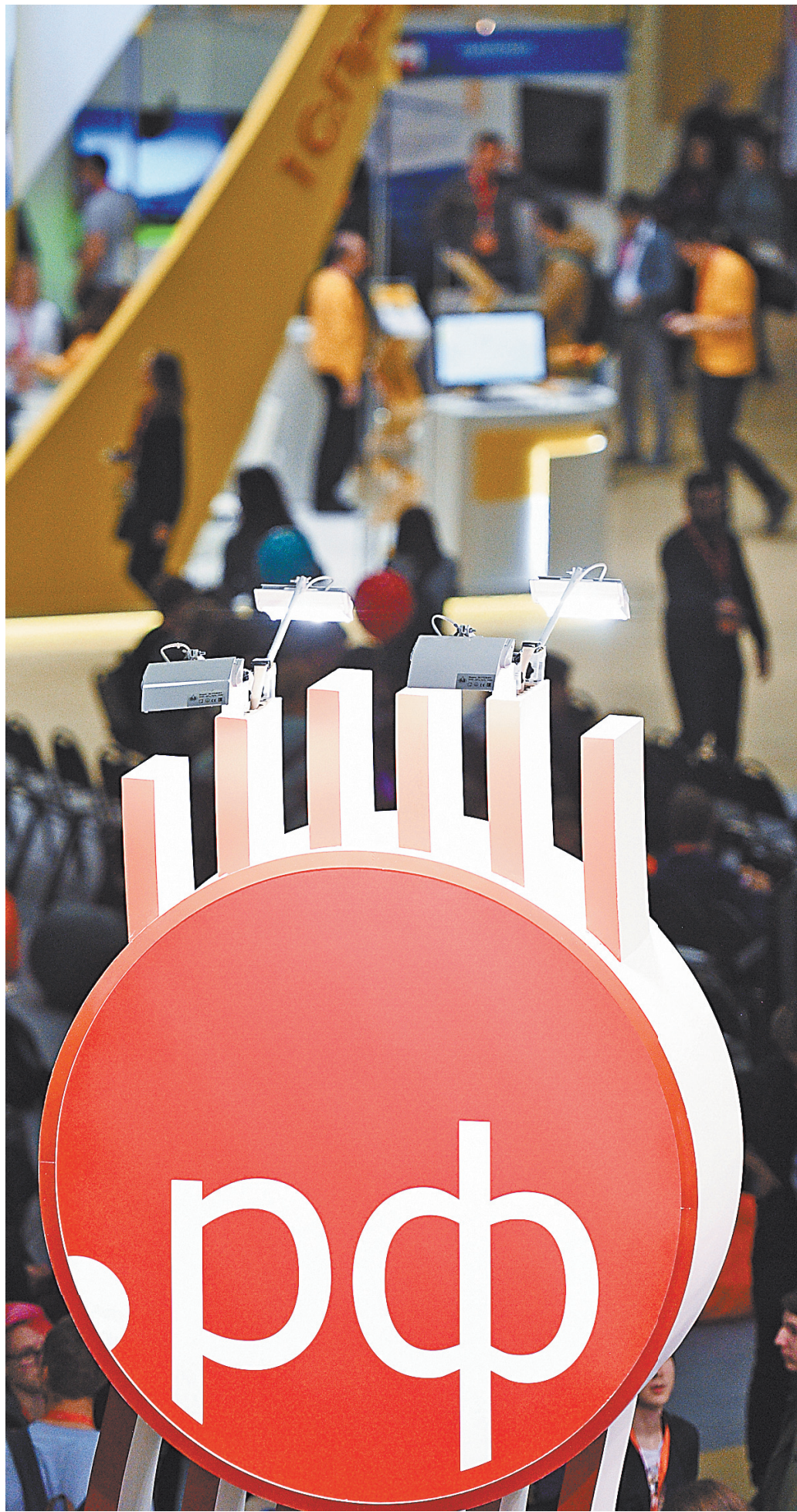
Ежегодно в России будут проводить учения для устойчивой работы интернета в любых обстоятельствах.

Паломническими турами отныне могут заниматься только религиозные организации