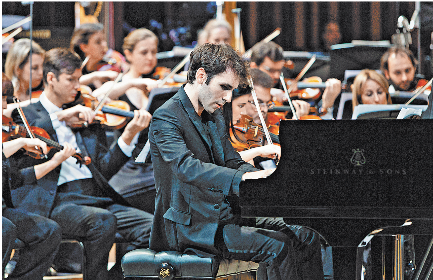
Фот. Валерия Гергиева/Александр Шаломов