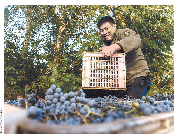
17 сентября 2019 года. Крестьянин собирает урожай винограда в деревне Мааньшань города Чифэн автономного района Внутренняя Монголия на севере Китая.

Структура сельскохозяйственной отрасли постоянно оп-