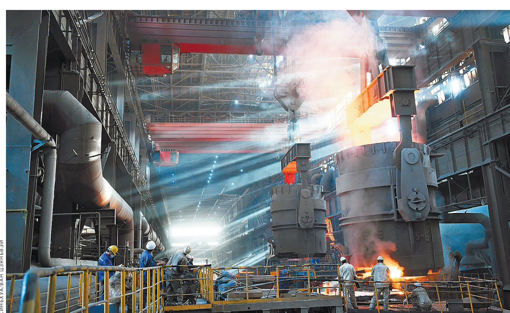
28 августа 2019 года. Китайская первая корпорация тяжелого машиностроения расположена в городе Цицикар провинции Хэйлуцзян на северо-востоке Китая.

«К примеру, в 1949 году объем производства стали в Китае составил всего 158 тысяч тонн, что составило всего лишь 0,1 процента мирового производства стали. В 2018 году объем производства стали в стране превысил 900 миллионов тонн, что составляет половину объема мирового производства стали», — сказал министр промышленности и информатизации КНР Мяо Вэй.