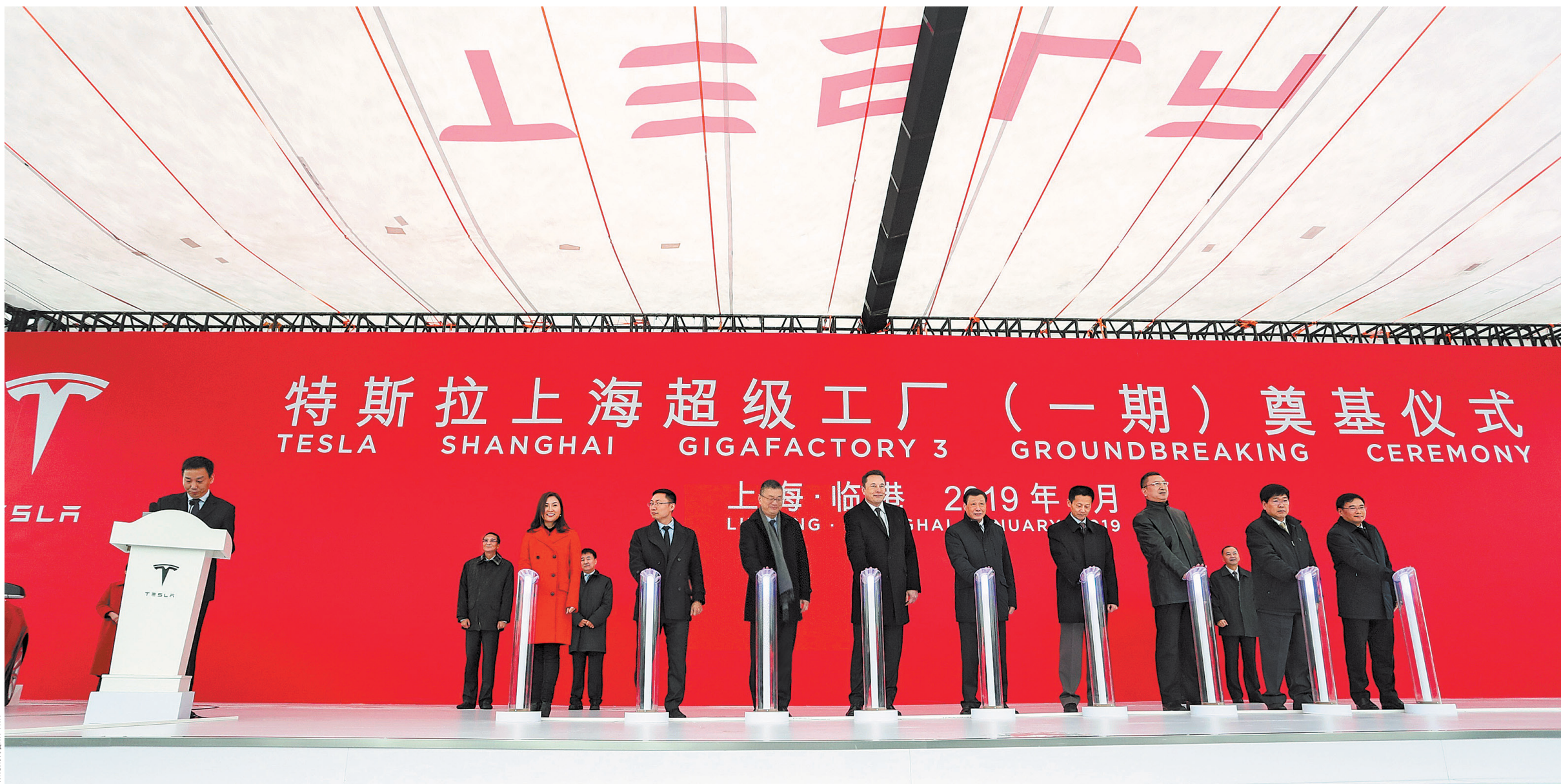
7 января 2019 года состоялась церемония закладки первого камня фабрики «Тесла» в Шанхае.

За 40 лет иностранные компании расширили свой бизнес от трудоемких отраслей — особенно обрабатывающей промышленности — до сферы услуг и высоких технологий. По мере того как все больше инвестиций привлекают такие сферы, как