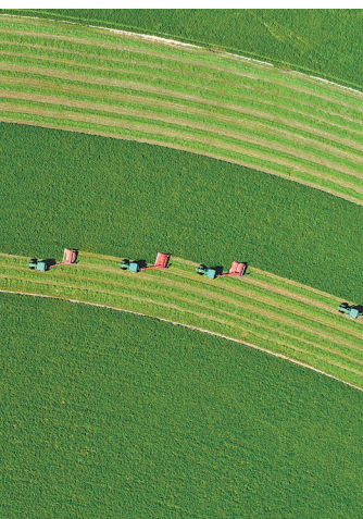
20 сентября 2019 года. Комбайны убирают урожай люцерны в Ар-Хорьцинском хошуне в автономном районе Внутренняя Монголия на севере Китая.

тимизировалась, при этом современная модель, способствующая всестороннему развитию сельского хозяйства, лесного хозяйства, животноводства и