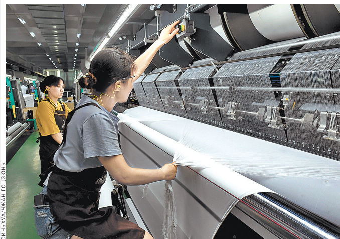
4 августа 2019 года. Текстильщицы работают на фабрике швейно-текстильной компании Цициайху, расположенной в городе Цициан провинции Фуцзянь на востоке Китая.