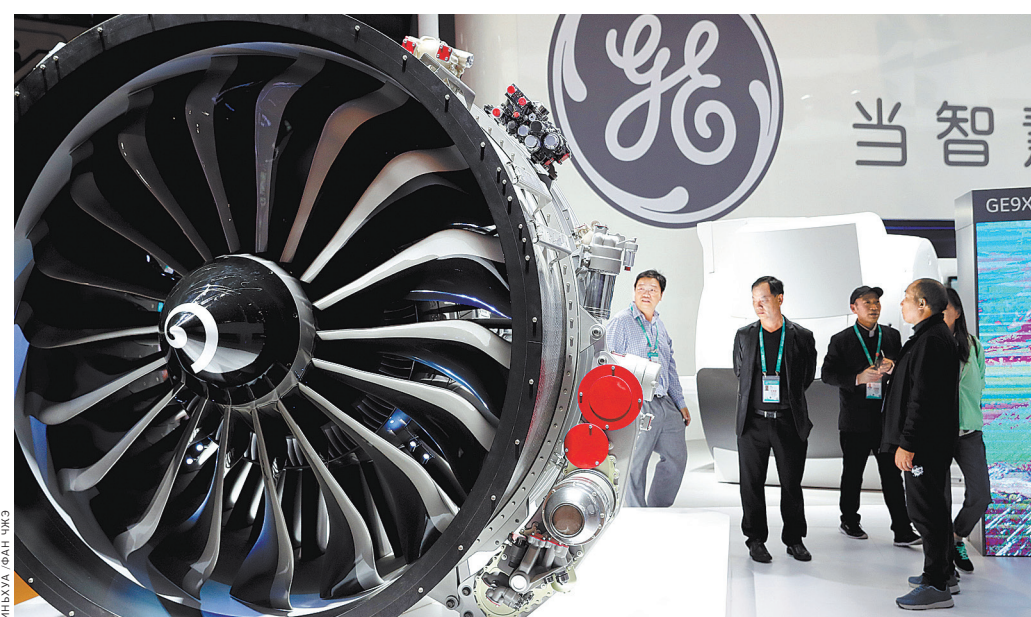
5 ноября 2018 года. На первом Китайском международном импортном Экспо в Шанхае был продемонстрирован авиационный двигатель американской компании «Дженерал электрик».

Китай полон решимости защищать свободную торговлю и интегрироваться в экономическую глобализацию. Он продолжит обоюдное сотрудничество с инвесторами всего мира. ●