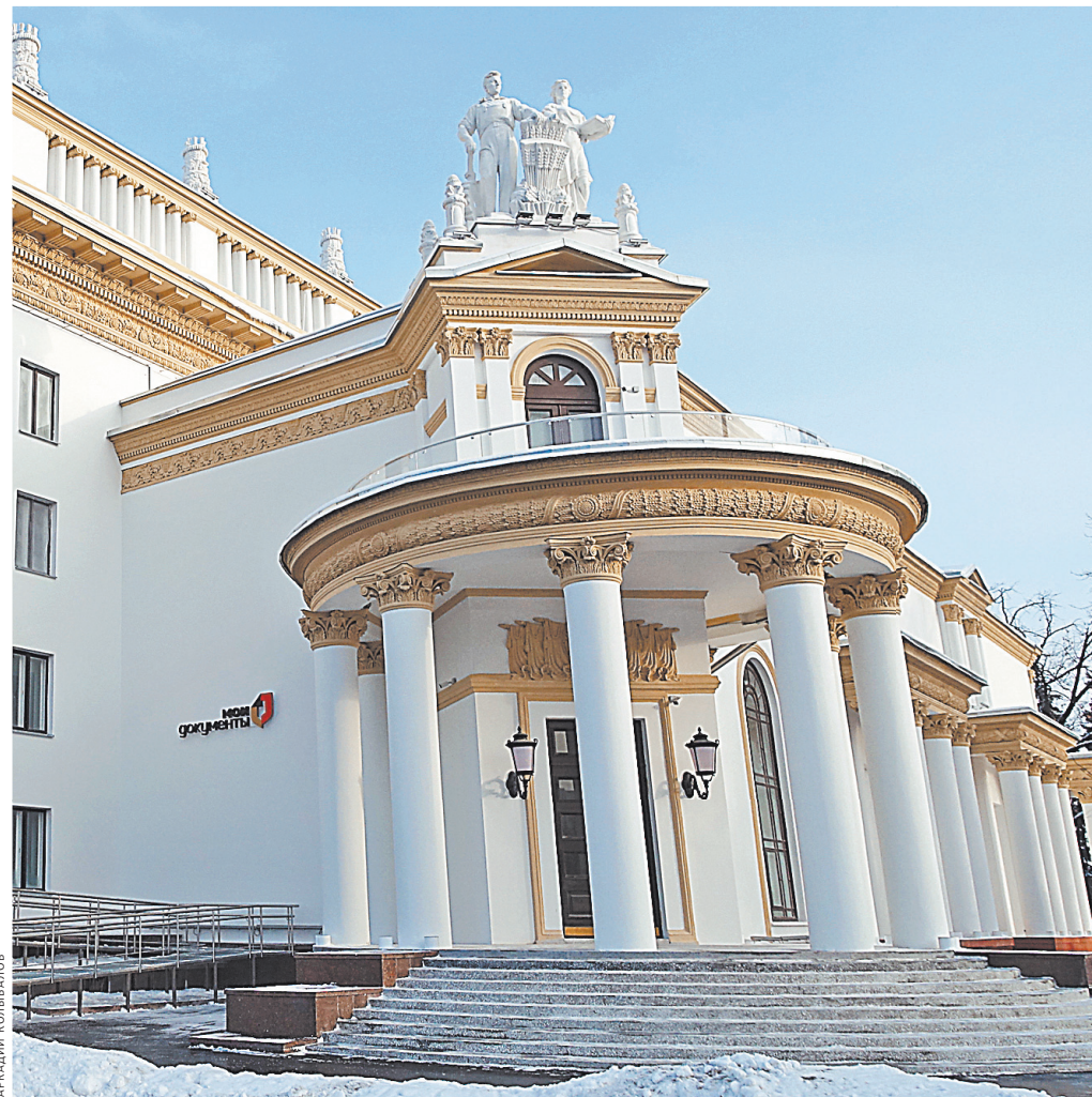
Дворец МФЦ «прописался» в историческом павильоне № 71.