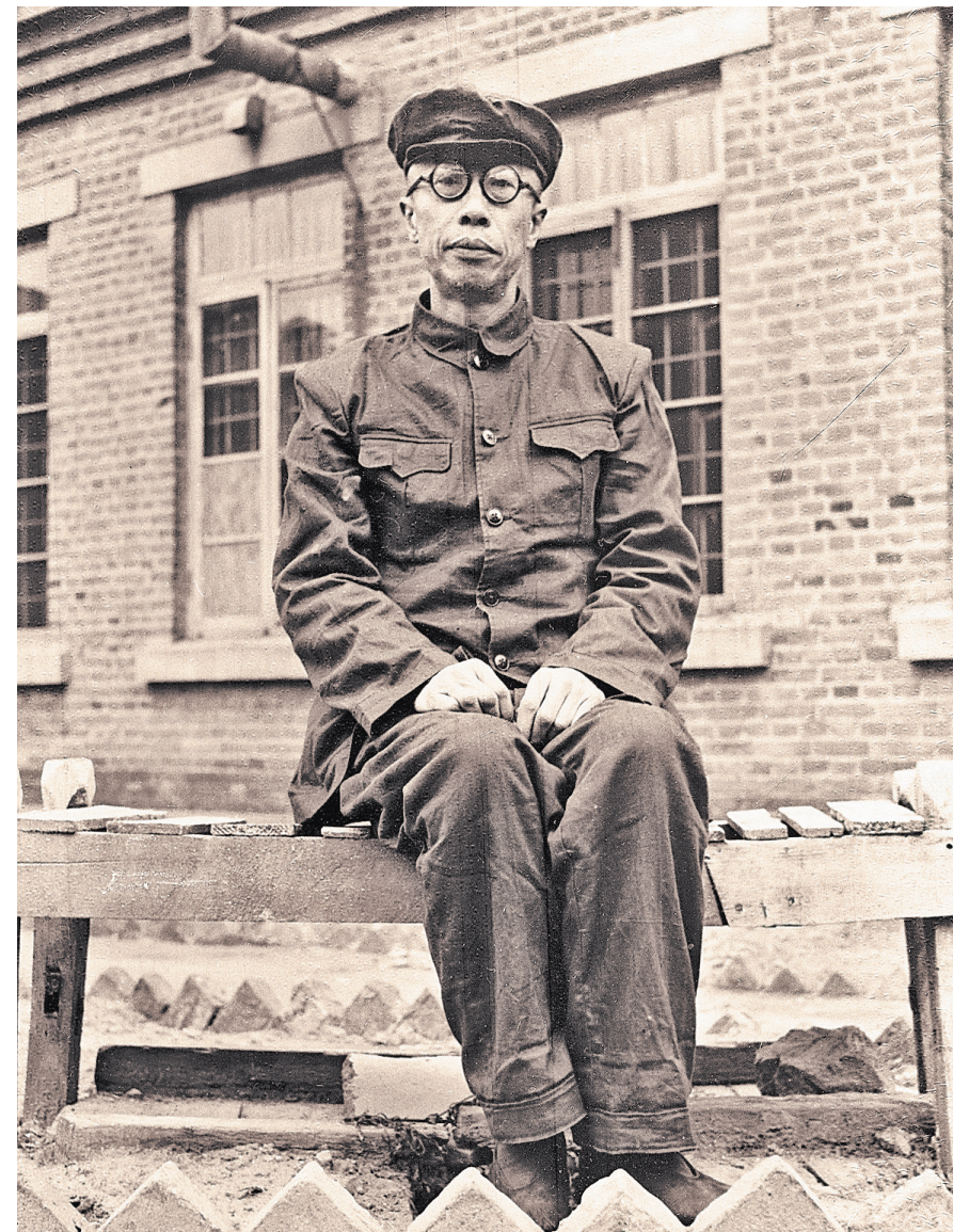
Пу И философски относился к зигзагам своего жизненного пути (тюрьма г. Фушан, КНР, 1956г.)

А нам остается только констатировать, что это был человек незаурядный как в лучших, так и в худших своих проявлениях. ●