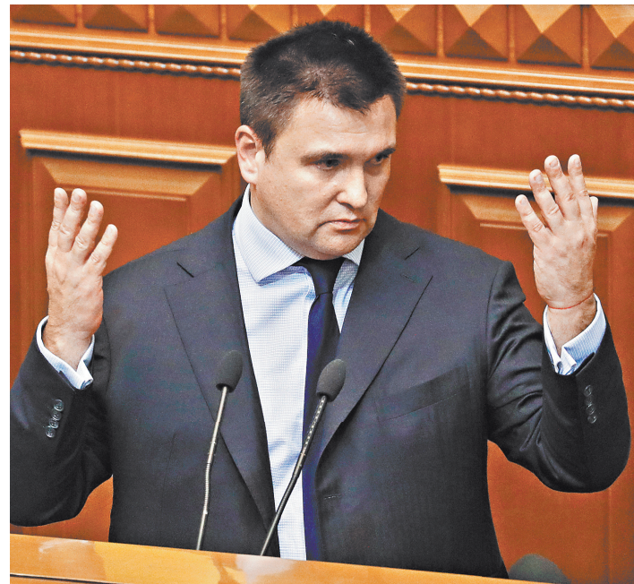
Глава МИД Украины Павел Климкин, чья супруга имеет родственников в Крыму, может стать жертвой «охоты на ведьм».

По его словам, Пекин выступает за создание открытой мировой экономики и намерен противостоять гегемонизму в международных отношениях. «Мы ежедневно приближаемся к тому, чтобы Китай стал центром на мировой арене, превратился в повсеместно признанного строителя международного мира, несущего вклад в глобальное развитие, в защитника мирового правды», — заключил китайский лидер.