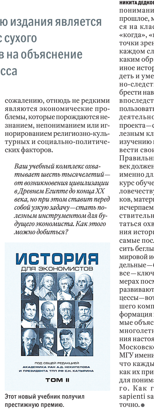
Этот новый учебник получил престижную премию.