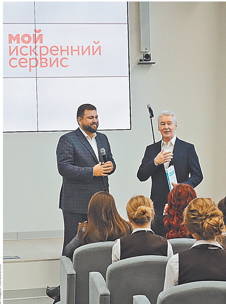
Сергей Собянин: В офисе на ВДНХ откроется центр обучения клиентскому сервису.

Адреса 13 новых стартовых площадок: район Коптево — ул. генерала Рычагова, 14; Головинский р-н — мкр. 13, к 4, мкр. 13, к 7, мкр. 13, к 9, мкр. 13, к 10; Марьяна Роща: ул. Анненская, 6; Савблово: Лазоревый проезд, вблизи д.2; Новогиреево, Утренняя ул. 20, стр. 2; Перово: ул. Металлургов, 56, 2-я Владимирская ул. 13; Северное Измайлово: кв. 48, 11-я парковая, 45; Зюзино: ул. Одесская, 4 стр. 1