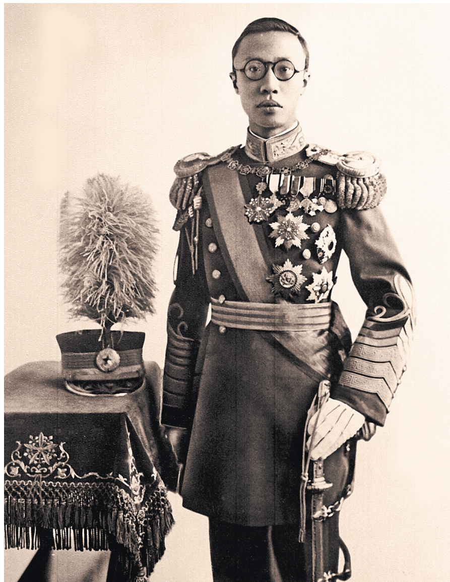
Судьба этого красавца легла в основу одного из лучших фильмов Бернардо Бертолуччи.

В советском плену Пу И страшно боялся, что его передадут для суда в коммунистический Китай и там он наверняка будет расстрелян как изменник. Он делал все возможное, чтобы остаться в СССР, и надеялся через какое-то время в дальнейшем переехать в Англию или Америку и стать иммигрантом. Если вариант с эмиграцией на Запад не удастся, то он был согласен остаться в СССР.