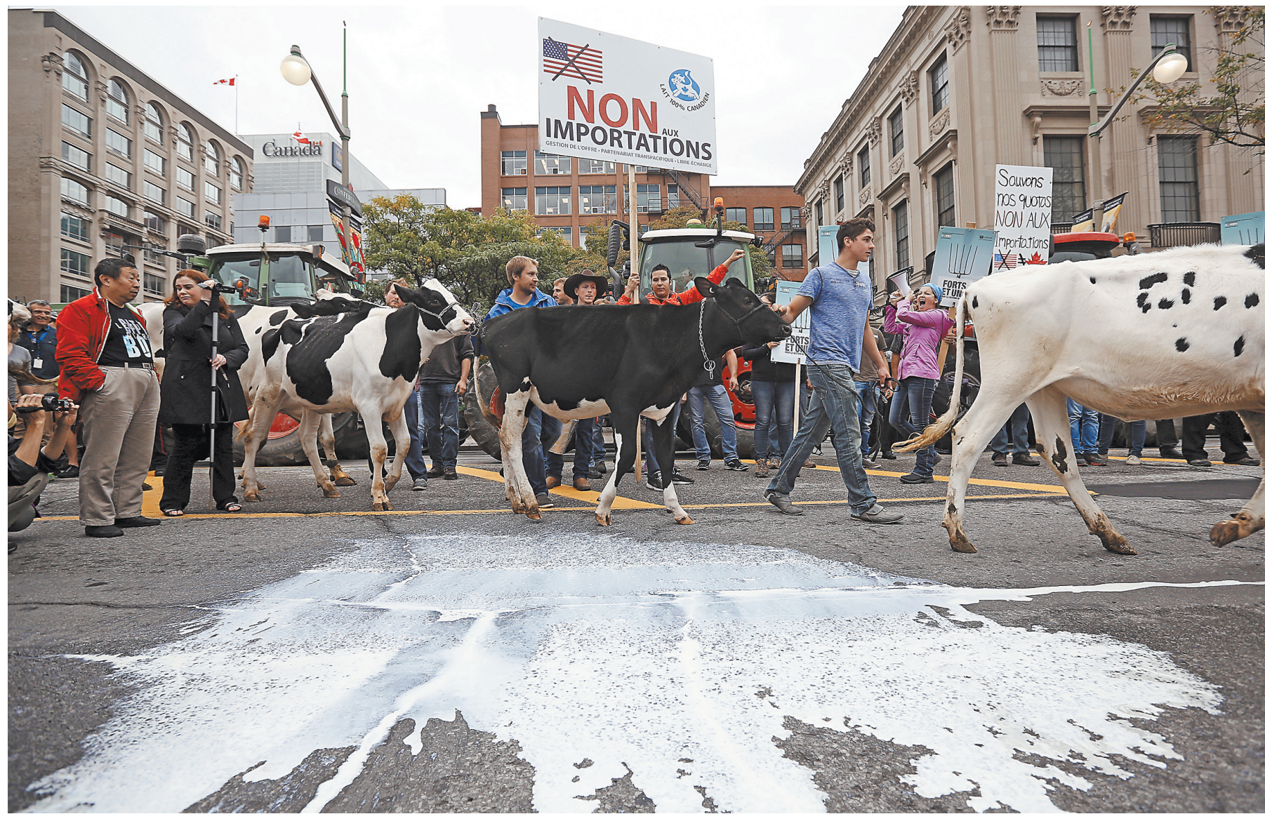
Европейские фермеры выливали молоко на асфальт, когда цены резко упали. Они несли убытки из-за перепроизводства. Так что украинского молока им не надо.