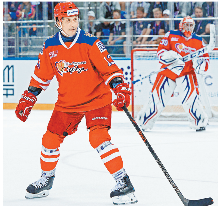
Несмотря на невероятную загруженность, Валерий Каменский все равно находит время выйти на лед.