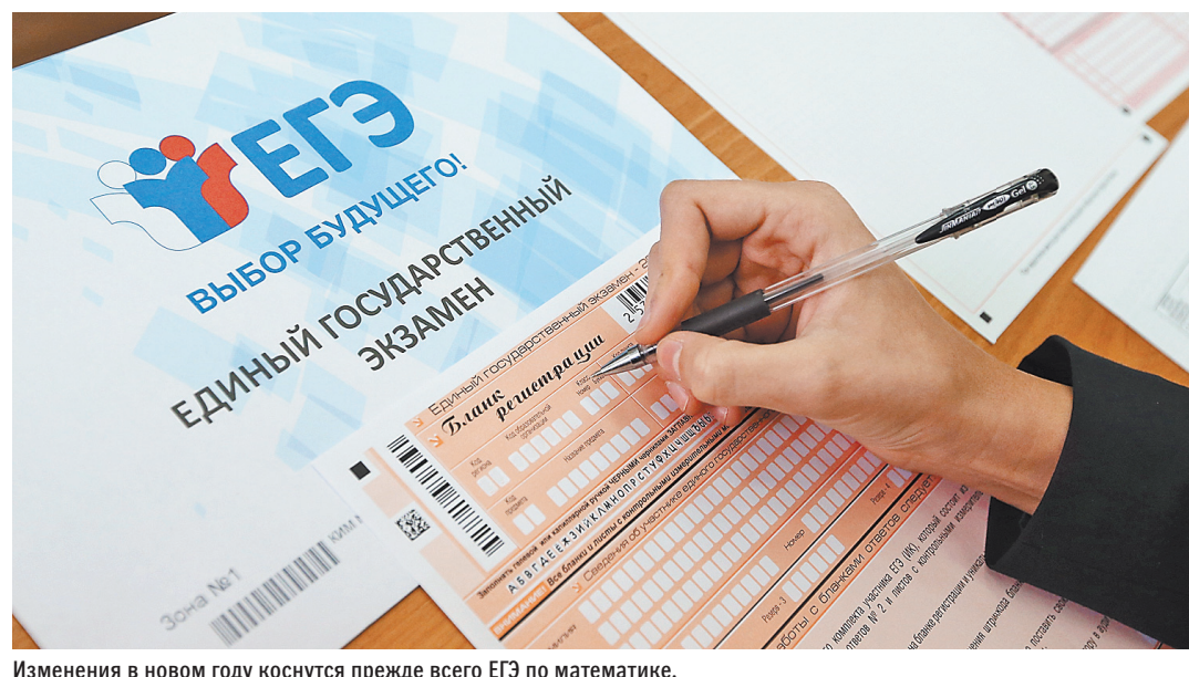
Изменения в новом году коснутся прежде всего ЕГЭ по математике.

Главная «новинка» — в ЕГЭ по математике. Выпускники 2019 года не смогут сдавать сразу и базовый, и профильный экзамен, как это было раньше: теперь им придется выбрать что-то одно. Зачем это нужно? Предполагается, что те выпускники, которые выбирают профильную математику, легко справятся и с базовым уровнем. И наоборот: тем, кто выбрал «базу», «профиль» может показаться слишком сложным.