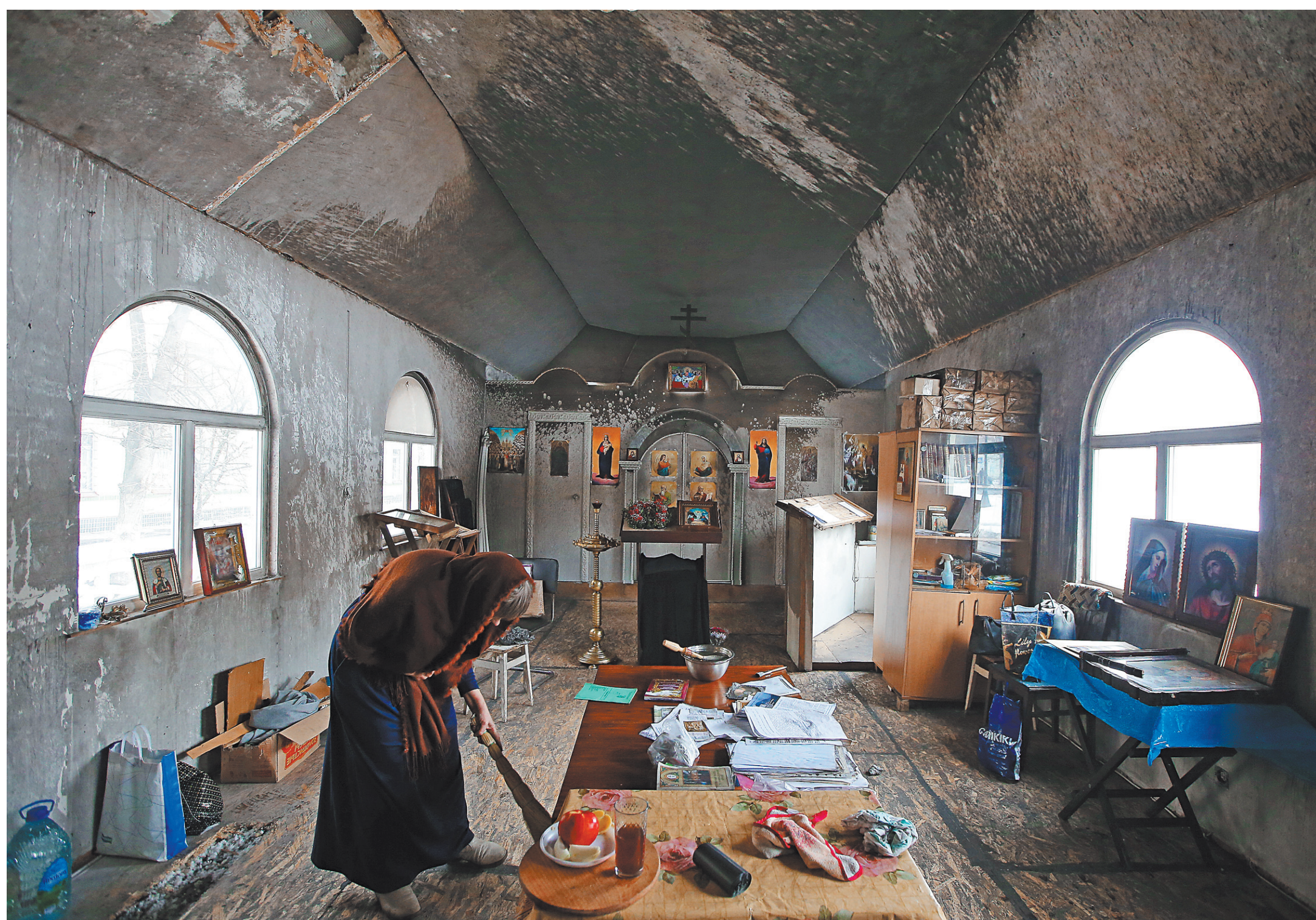
Последствия поджога храма Преображения Господня Украинской православной церкви Московского патриархата в Киеве (в ночь с 9 на 10 марта неизвестные разбили окно церкви, вылили горячую жидкость и совершили поджог).

В итоге личным присутствием «соборщице» почтили только два иерарха УПЦ, каждый по-своему примечательный. Первый — митрополит Переяслав-Хмельницкий и Вишневский Александр Драбинко. Секретарь и фаворит почившего в 2014 году митрополита Киевского Владимира (Сабодана), несемейный амбициями интриган, фигурант уголовных дел,