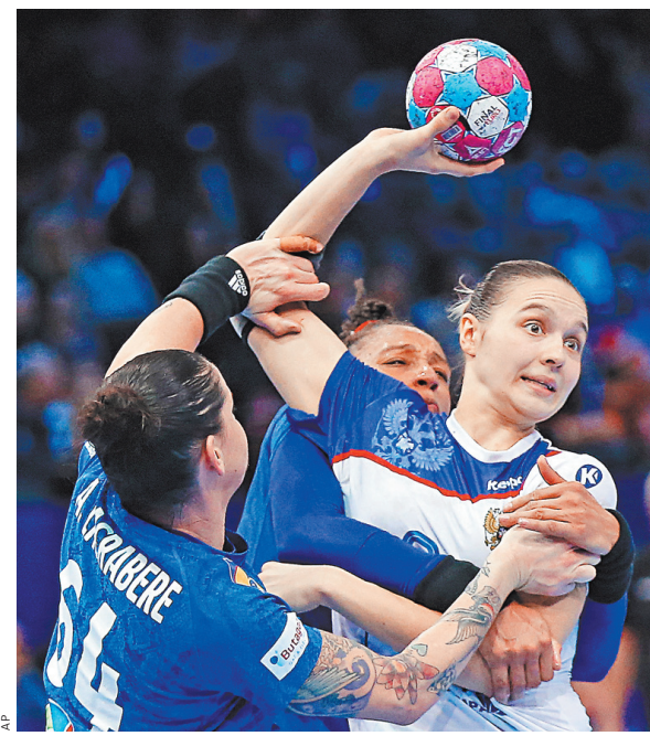
В парижском финале чемпионата Европы предельно жестко в обороне играли и наши соперницы, и сборная России.

Россиянки впервые за дюжину лет получили право сыграть в решающем матче чемпионата Европы, победив в полуфинале Румынию — 28:22. Нынешнее «серебро» — повторение нашего предыдущего наивысшего успеха на этом уровне, датированного 2006 годом. ●