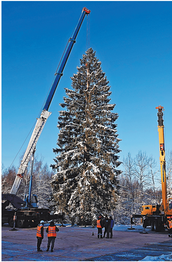
Ель сегодня погрузят в автопоезд и отправят в Москву. Для нее откроют ворота Спасской башни.