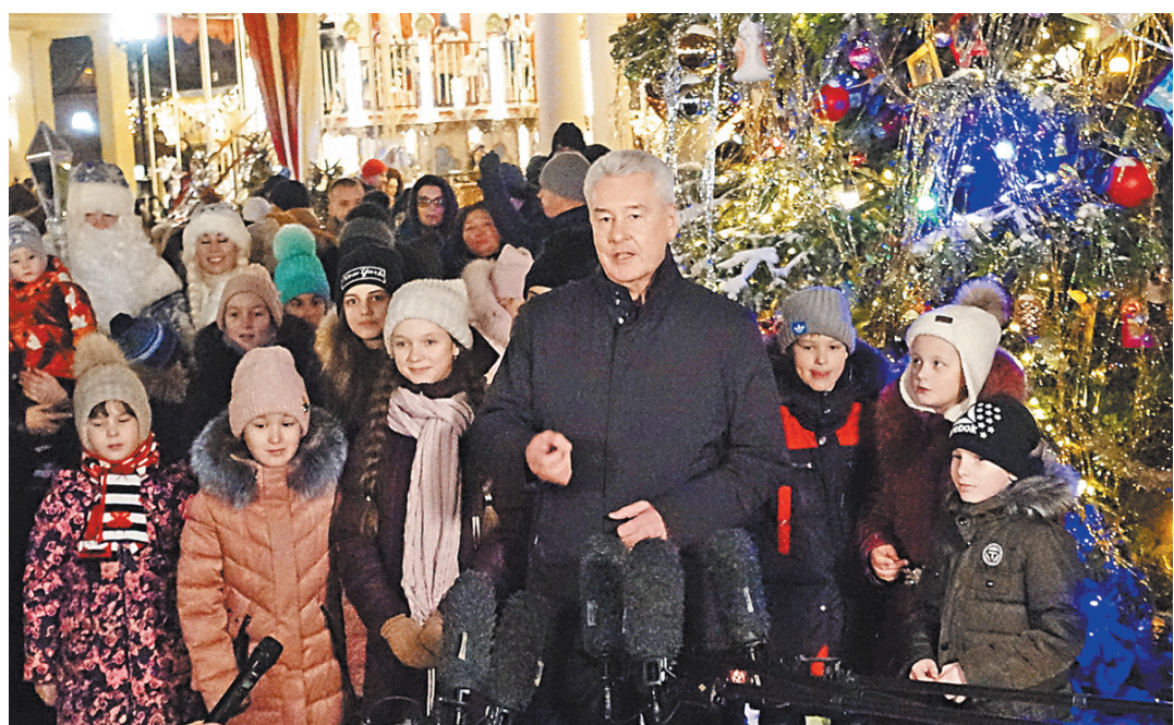
Сергей Собянин: Площадки фестиваля становятся ближе к жителям города.

В минувшую пятницу в Москве был официально дан старт новогодним гуляниям, в городе зажглись праздничные огни и стартовал главный зимний фестиваль «Путешествие в Рождество», который продлится почти месяц — до 13 января. Всего в городе москвичей и гостей столицы ждут 78 ярмарочных площадок, причем две трети расположены не в центре столицы, а в разных округах столицы. Одну из них мэр Москвы Сергей Собянин открыл в Юго-Восточном округе рядом с метро «Кузьминки».