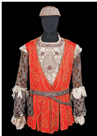
Среди экспонатов — деталь костюма Леониды Собинова к партии Ромео («Ромео и Джульетта»).

Не так давно сотрудники музея Большого театра установили дату его создания — осень 1918