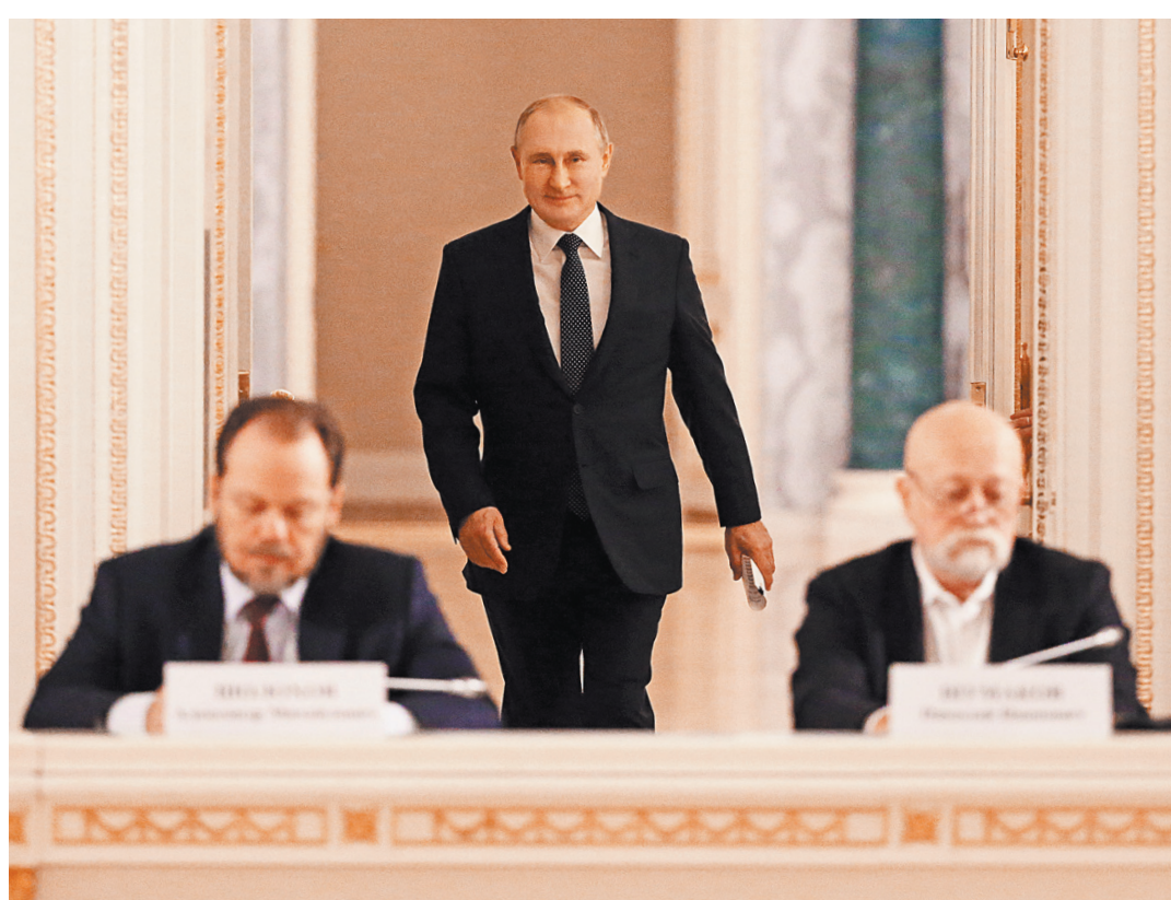
Владимир Путин надеется, что к марту следующего года удастся согласовать все параметры нового закона о культуре.

СВОИ ВОПРОСЫ ДМИТРИЮ КОБЫЛКИНУ О ПЕРЕХОДЕ РЕГИОНОВ С 1 ЯНВАРЯ 2019 ГОДА НА НОВУЮ СИСТЕМУ УПРАВЛЕНИЯ ОТХОДАМИ МОЖНО ЗАДАТЬ 19 ДЕКАБРЬ С 9.00 ДО 10.00 ПО МОСКОВСКОМУ ВРЕМЕНИ. ПОЗВОНИМ ПО ТЕЛЕФОНУ: 8-800-200-05-05 (ЗВОНИМ БЕСПЛАТНО ИЗ ВСЕХ РЕГИОНОВ РОССИИ) ИЛИ УЖЕ СЕЙЧАС ПО ЭЛЕКТРОННОЙ ПОЧТЕ: ZAVTRAK@RG.RU