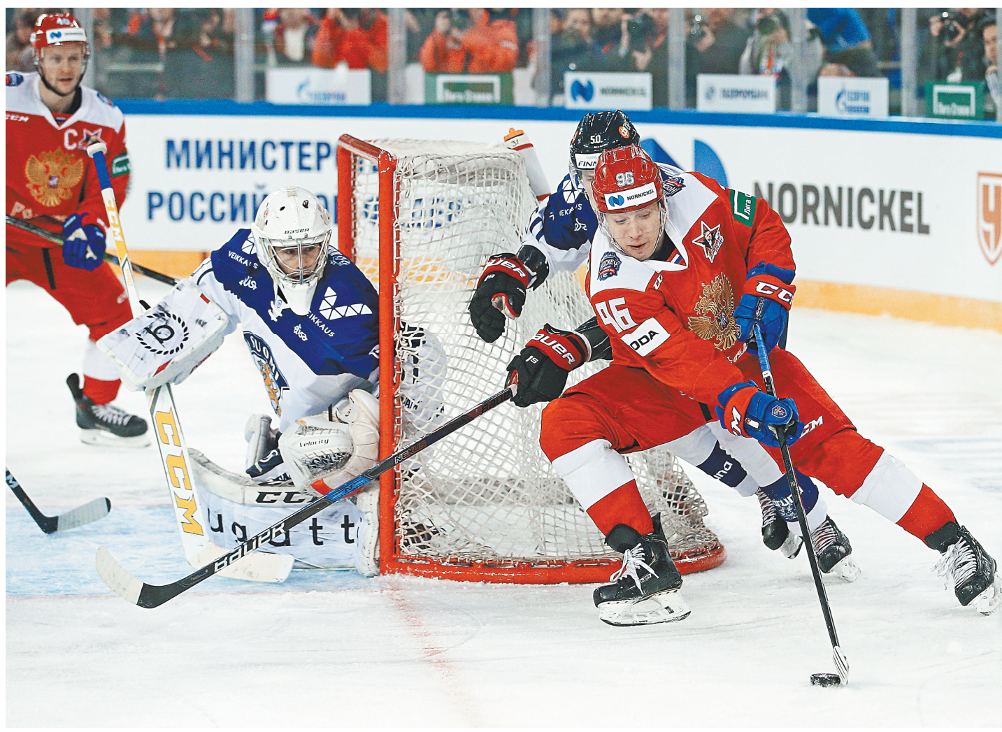
Хоккеисты сборной России (в красном) после победного матча с финнами признались, что им понравилось играть на футбольном стадионе.

При подготовке к этому матчу поле, на котором принимает своих соперников «Зенит», выкатили на улицу и хорошо укрыли до веза. Так что газону ничто не угрожает. С крыши тоже решили не экспериментировать. Конечно, перспектива поиграть на открытом воздухе выглядела соблазнительно, но от питерской погоды можно ждать самых неприятных сюрпризов. К тому же благодаря крыше организаторы смогли поставить две дополнительные трибуны поближе к хоккейной коробке, получив еще порядка 8 тысяч мест для зрителей. И оборудовать сцену, на которой народ еще за два часа до стартового