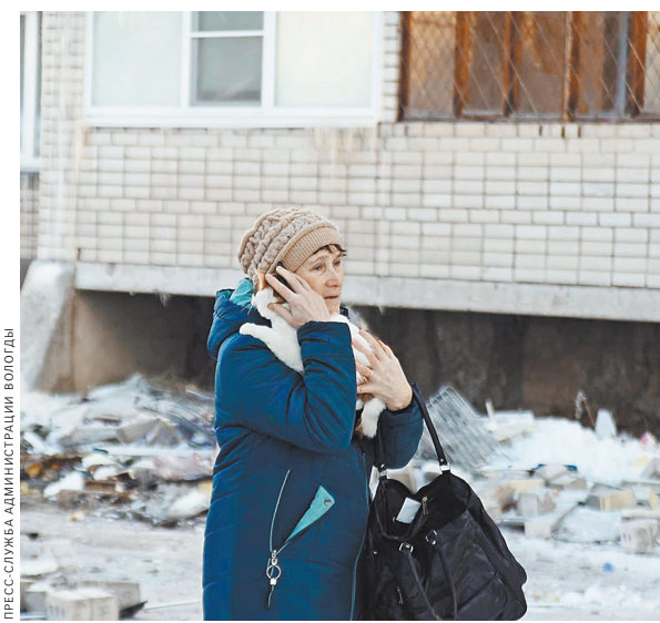
Сейчас жители разрушенного подъезда могут вернуться в свои квартиры только для того, чтобы забрать самое необходимое.

В Вологде начали работать эксперты, которые оценят возможность восстановления пострадавшего подъезда. В город уже приехали специалисты из Москвы с необходимой аппаратурой для оценки состояния несущих конструкций здания. Решение о возвращении жителей будет принято только после обследования здания специалистами. А пока жителям разрешают пройти в свои квартиры и забрать необходимые вещи и документы. ●