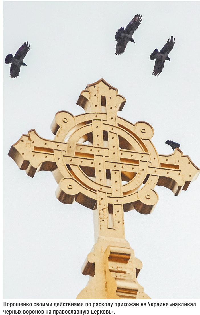
Порошенко своими действиями по расколу прихода на Украине «накликнул черных воронов на православную церковь».

Но хотя Церковь прошла очищение и избежала соблазна, главные испытания для нее еще впереди. Со вчерашнего дня никто не может запретить Порошенко начать насильственный отвод храмов и православных святынь в пользу заранее объявленной «государственной церковью» ПЦУ. Точно так же никто не может запретить верным православным сопротивляться этому. Избежать кровопролития поможет только чудо, но, как показывают последние пять лет украинской истории, чудес в современном мире не бывает и все события на этой территории развиваются по самому пессимистичному сценарию. Через скандал, публичный позор, отход от стыда, совети и страхи перед Богом Петр Порошенко все-таки подвел Украину к краю кровавой пропасти, в которой уже видится только возможность продолжить свое президентство. ●