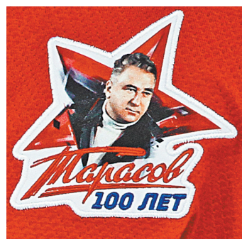
В форме с такой памятной нашивкой сборной России провела матч против финнов.

Вдобавок символично, что рекорд был поставлен в год 100-летия великого тренера Анатолия