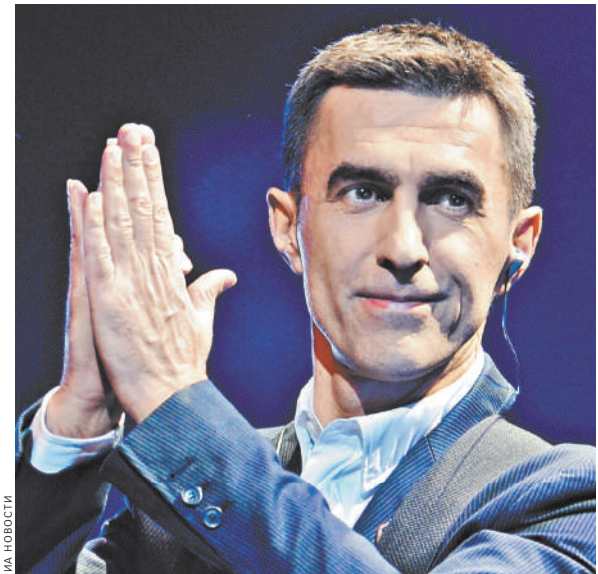
Лидер группы «Наутилус Помпилиус» Вячеслав Бутусов признался, что давно ждал, когда народ признается над происходящим.

Вячеслав Бутусов: Как многодетный отец, я обязан оградить своих детей от дурного влияния социума — с духовно-ментальной, особенностей законодательства, уровня развития общества и т.д. Как верующий человек, я много думал и долго искал способ защиты от нечистой силы. В результате этих многолетних поисков пришел к выводу, что единственный надежный способ — это воспитать в детях понимание добра и зла; помочь им усвоить, что это нужно отвергать без сомнений, а добро нужно принимать с благодарностью. Тогда они будут выбирать чистые пути в этом мире, смогут избежать столкновения с опасностями, а если неизбежно столкновение — смогут дать отпор. Кто предупрежден, тот вооружен.