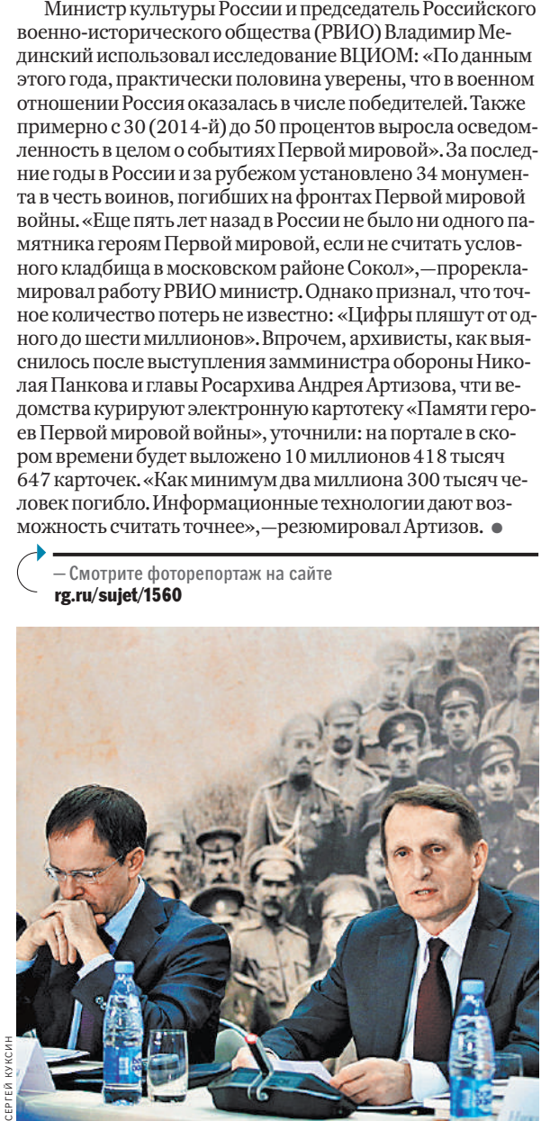
Владимир Мединский и Сергей Нарышкин считают, что у Великой войны достойное место в национальной памяти.

— Смотрите фоторепортаж на сайте rg.ru/sujet/1560