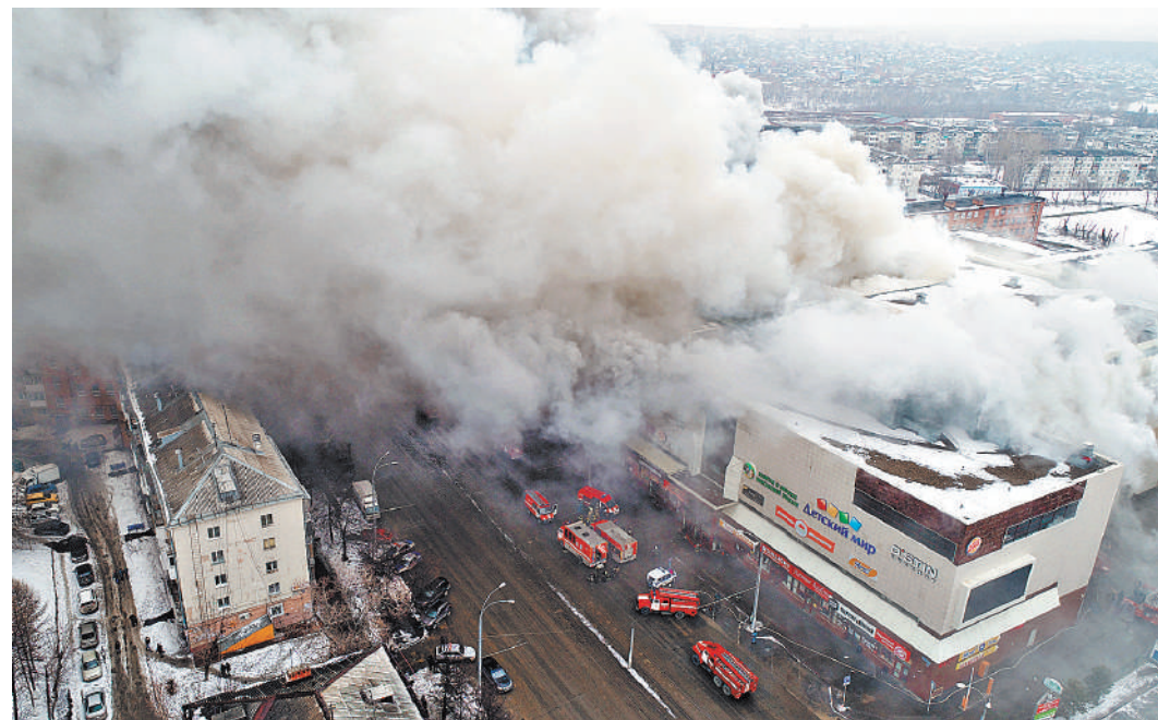
Трагедия в «Зимней вишне» заставила искать новые подходы к обеспечению пожарной безопасности таких объектов.