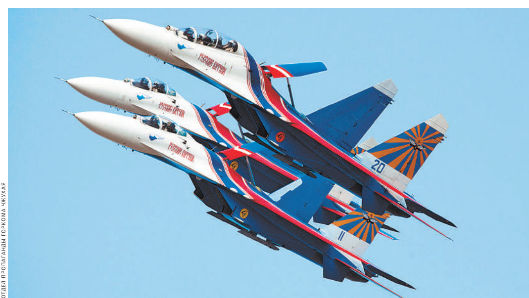
Воздушное шоу на авиасалоне в Чжухае.