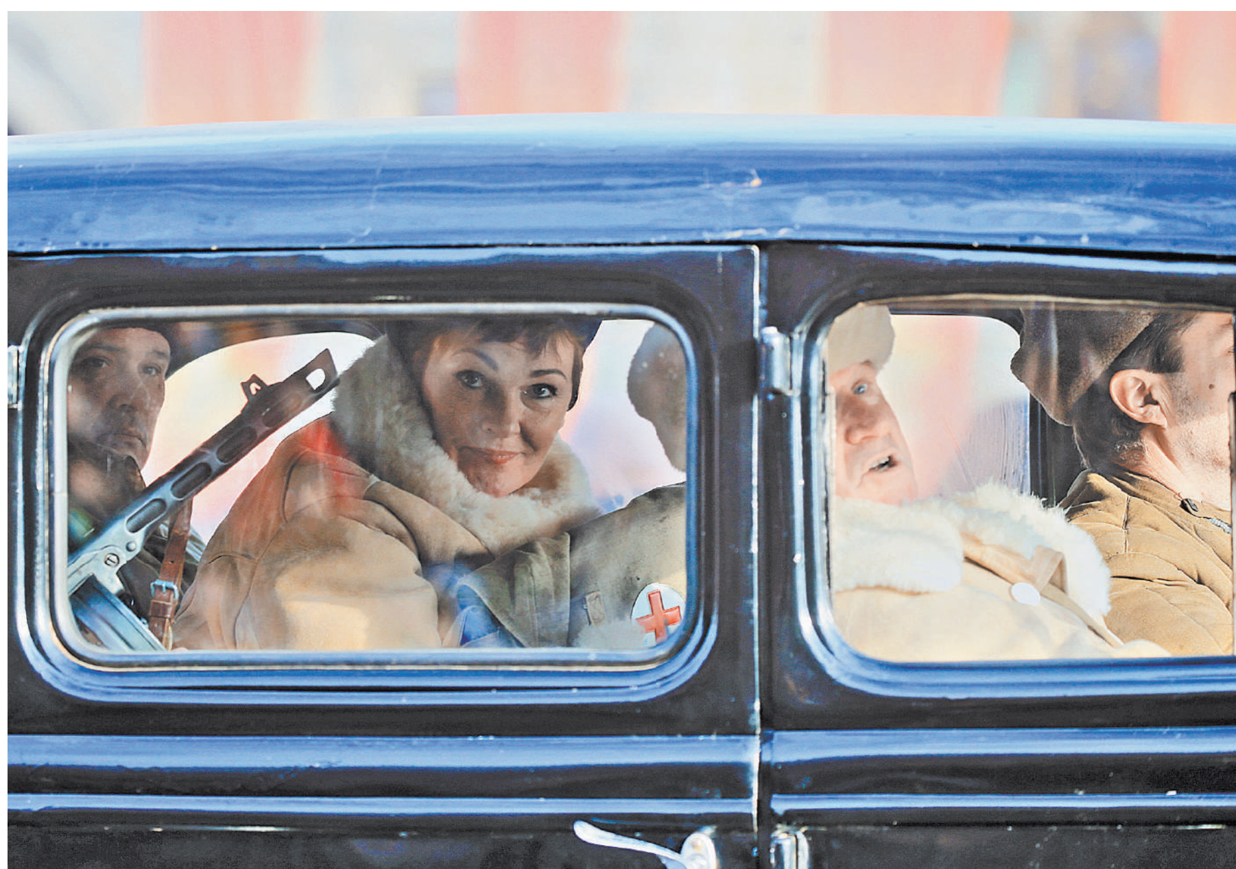
Внуки тех, кто защитил столицу в сорок первом, навсегда сохранили память о беспримерном подвиге.