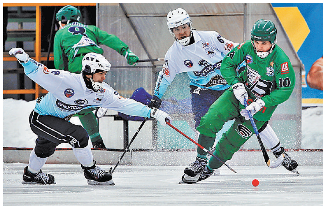
Из воспитанников «Водника» в будущем может получиться отличный резерв для архангельского клуба и сборной.