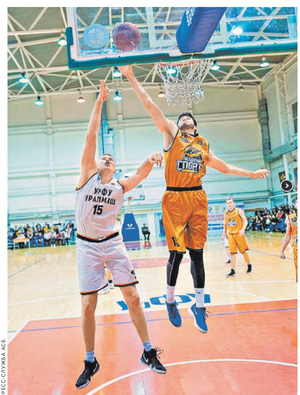
Игроки из «УрФУ-Уралмаш» намерены бороться за попадание в «Финал четырех» чемпионата АСБ.