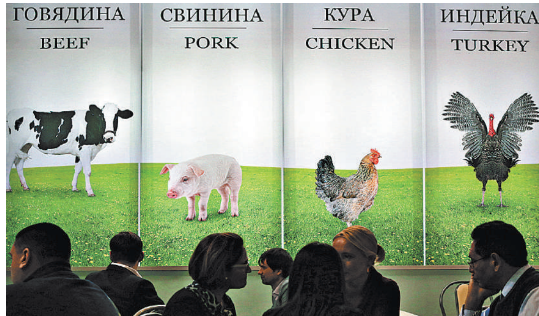
Кратно увеличить долю экспорта в Китай должны поставки мяса птицы, говядина и свинина пока ждут своей очереди.

Пока что ретейлеры, по сути, дискриминируют производителей, перекладывая на них свои риски, пояснила одна из авторов поправок, вице-спикер Госдумы Ирина Яровая. Мониторинг «Единой России» выявил, что торговые сети по договору купли-продажи забирают продукцию производителя, но спустя некоторое время по своему усмотрению могут вернуть ее назад, не оплатив, либо заставить ее выкупать. В результате производители сталкивались с издержками, которые в Комитете Госдумы по безопасности оценивают не менее чем в 200 млрд рублей в год.