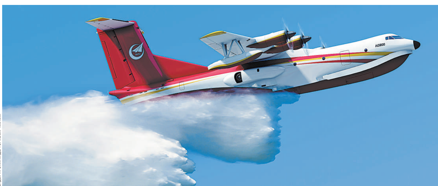
Самолет-амфибия AG600 демонстрирует тушение пожара с воздуха.

При слове «Чжухай» многим в голову сразу приходят две вещи, неразрывно связанные с этим местом. Это зеленая, как как там великолепная природа и состояние окружающей среды признано одним из самых подходящих для проживания в Китае. А второе — центральная магистраль, ведь Чжухай единственный город в стране, у которого