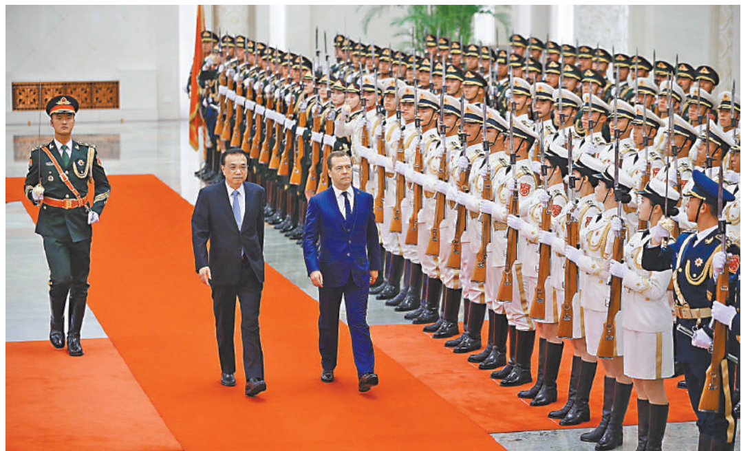
Дмитрий Медведев и Ли Кэцзян во время официальной церемонии встречи в Доме народных собраний в Пекине.

— Узнать на сайте: Готовы ли школы к обязательному ЕГЭ по истории rg.ru/art/1612758