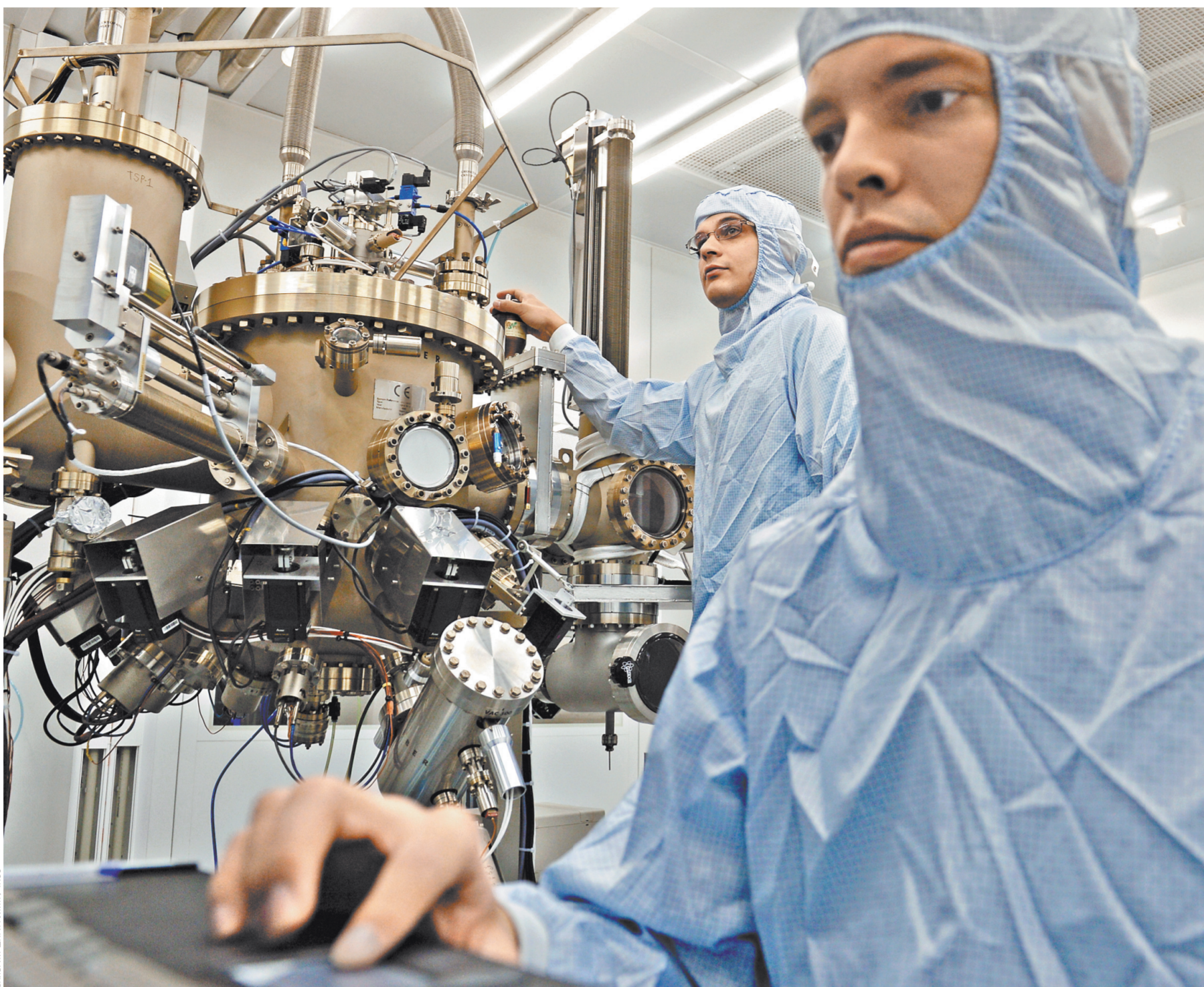
Научные исследования для студентов МИФИ — привычная и необходимая практика еще в вузе.

1 Среди технических университетов в рейтинге лидируют МИФИ, Университет ИТМО и Бауманка. Среди классических университетов самые востребованные МГУ, Уральский федеральный университет и Томский госуниверситет.