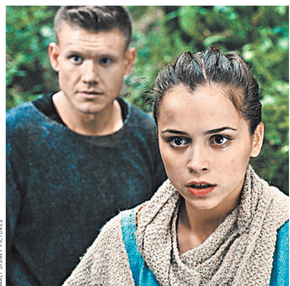
«Последний богатырь» занял второе место по сборам (30 млн долларов) после диснеевских «Пиратов Карибского моря».