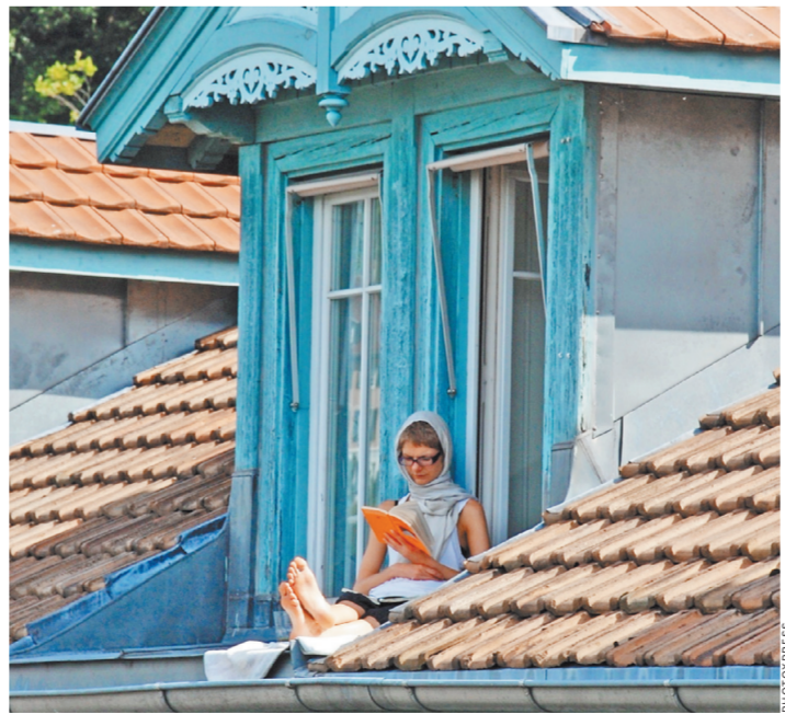
Нередко риелторы, предлагая квартиру на последнем этаже, уверяют, что владелец сможет ее увеличить. Но не говорят, при каких условиях.

В суде гражданка рассказала, что купила квартиру в 59,6 квадратных метра на последнем этаже многоквартирного дома. Потом за свой счет увеличила площадь до 84,7 квадратных метра, добавив часть мансарды над своей квартирой. В новой квартире появилась лестница на мансардный этаж, которая ведет в еще одну комнату и санузел