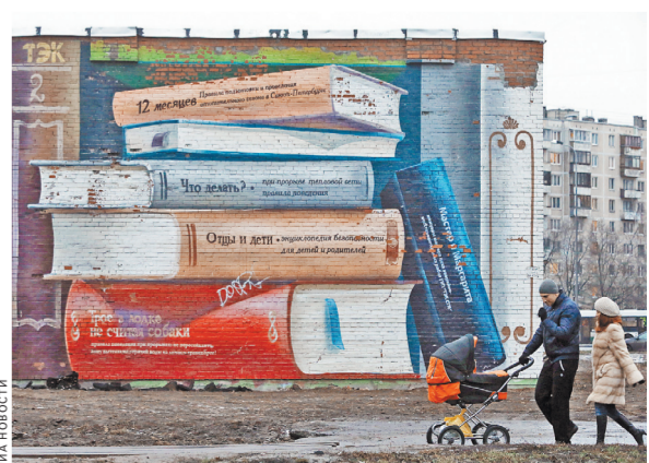
В Питере пока не выработали однозначной позиции — закрашивать граффити или же защищать от коммунальщиков.

По словам депутата, так у города появятся механизмы защиты и сохранения «жемчужин» граффити.