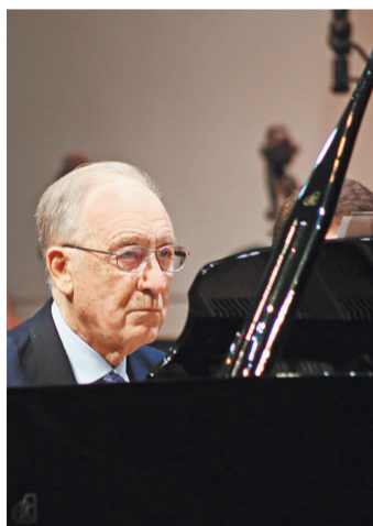
Родион Щедрин выступил на фестивале своей музыки в роли пианиста.