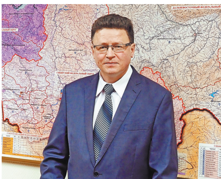
Андрей Лутошкин: В стране создана мощная система реагирования на всевозможные ЧС, в составе которой более 1,4 миллиона человек.

Во всех субъектах функционируют отделы мониторинга и прогнозирования чрезвычайных ситуаций в составе Главных управлений МЧС России. Эти подразделения на основании прогноза Росгидромета формируют оперативный ежедневный прогноз на сутки, краткосрочный недельный прогноз и среднесрочный прогноз на месяц. В работе активно используются современные геоинформационные системы и технологии космического мониторинга.