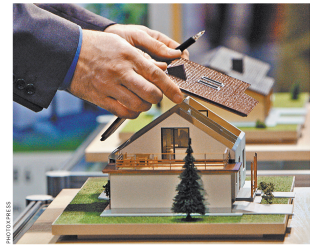
В отличие от коттеджей, в многоквартирных домах чердаки — это общее имущество жильцов. Реконструировать их можно. Но — только с согласия абсолютно всех владельцев.

В следующей статье того же кодекса — 40-й — написано, что если реконструкция, перепланировка или переустройство помещений невозможно без присоединения к ним части общего имущества, то на это требуется согласие всех без исключения собственников. Вывод из всех этих норм — согласие всех собственников в многоквартирном доме это обязательное условие для реконструкции или перепланировки любого помещения в доме, если оно влечет к присоединению к перестроенному общему имуществу дома. В 46-й статье Жилищного кодекса сказано следующее. «Принятие решения общего собрания по вопросу реконструкции квалифицированным большинством голосов не распространяется на случаи, связанные с реконструкцией общего имущества дома, в результате которой общее имущество уменьшается».