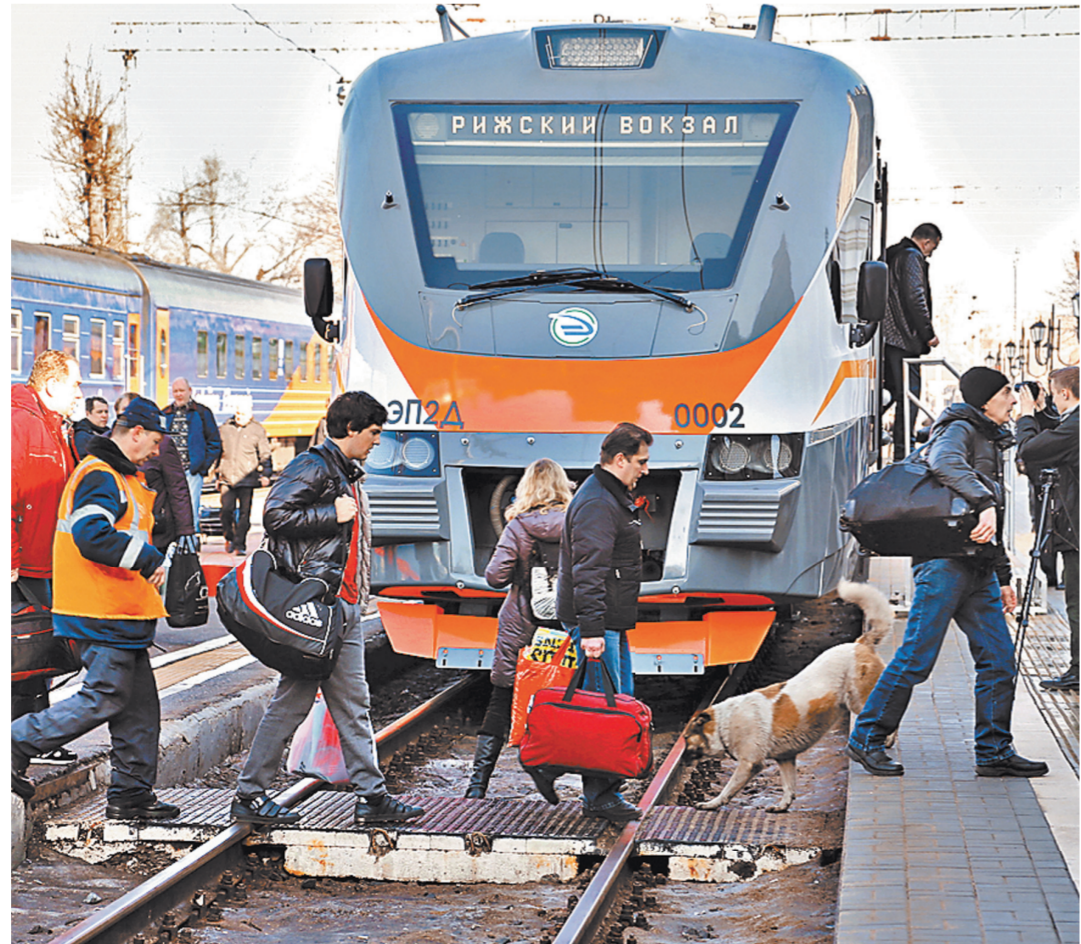
Наказания люди не боятся. А в смертельную опасность, похоже, не верят.

Через два часа в районе станции «Электрозаводская» Казанского направления электричка сбила мужчину, который переходил железнодорожные пути. Пострадавший скончался в машине «скорой помощи».