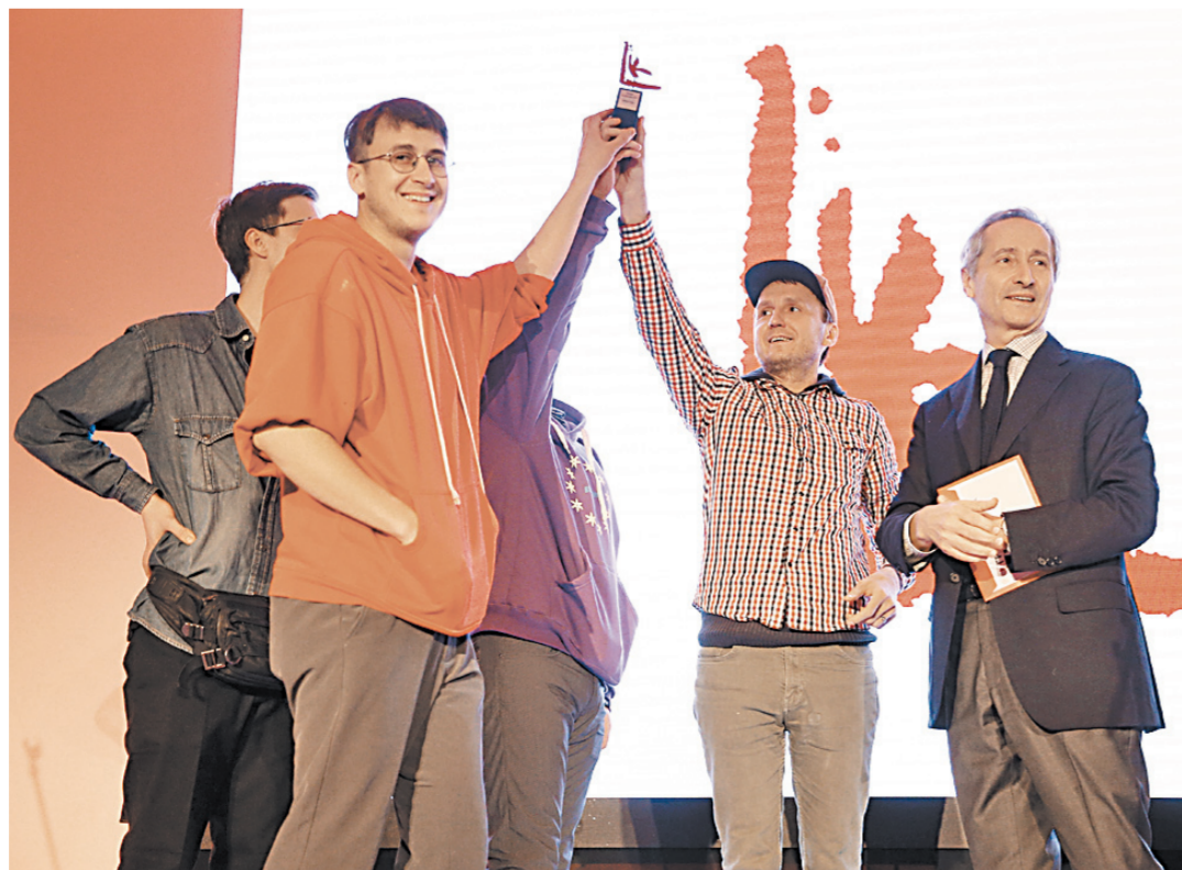
В номинации «Проект года» лауреатами стали художники из Краснодара, объединившиеся в группировку ЗИП.

Это пространство единения и общности на той выставке в ММОМА, что получила Премию Кандинского, было представле-