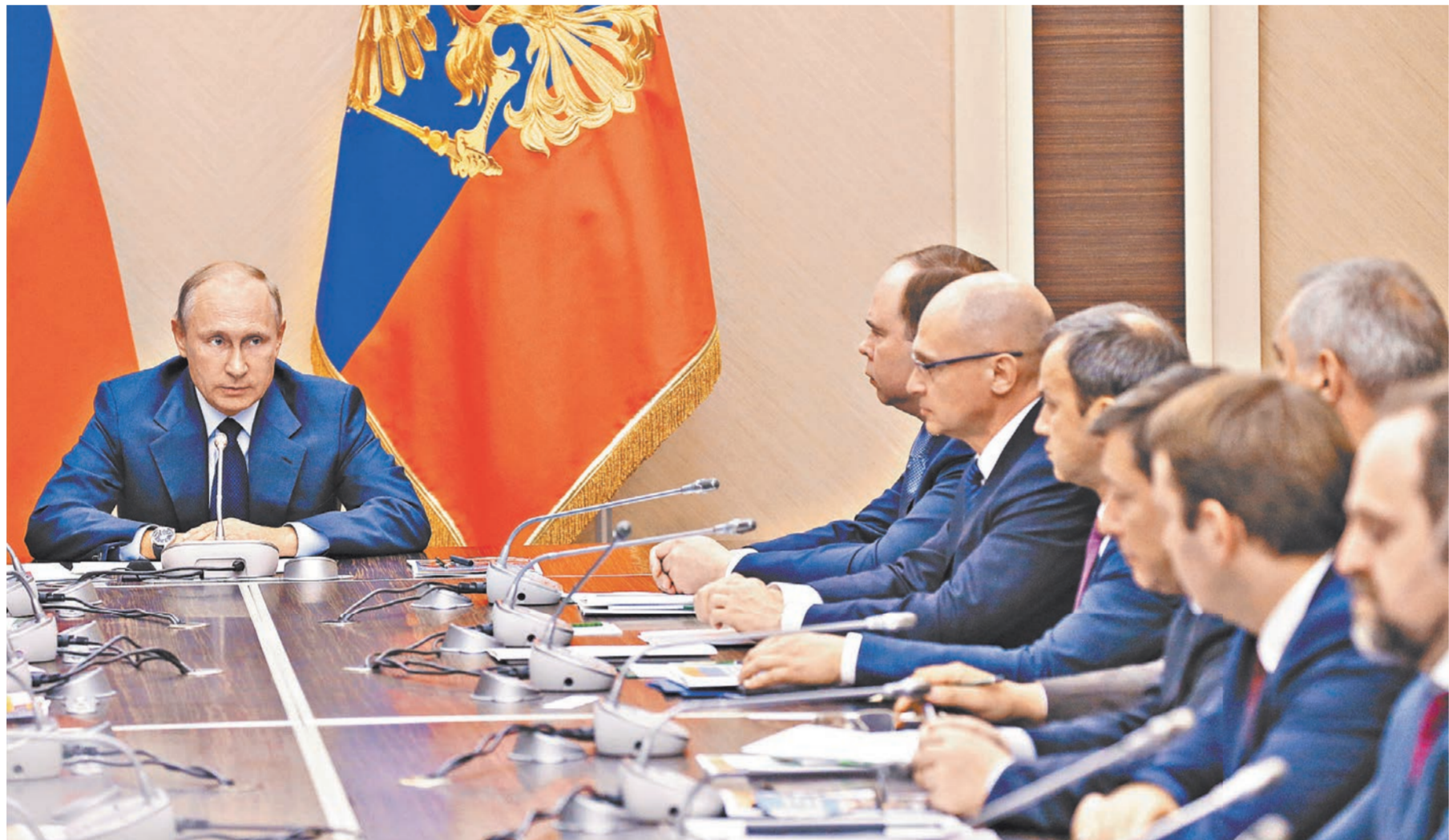
Президент России Владимир Путин раскритиковал вице-преьера Аркадия Дворковича за недостаточное внимание к транспортной системе и объявил главе Максиму Соколову о неполном служебном соответствии.

Для аграриев ежегодно предусмотрят еще по 20 миллиардов рублей