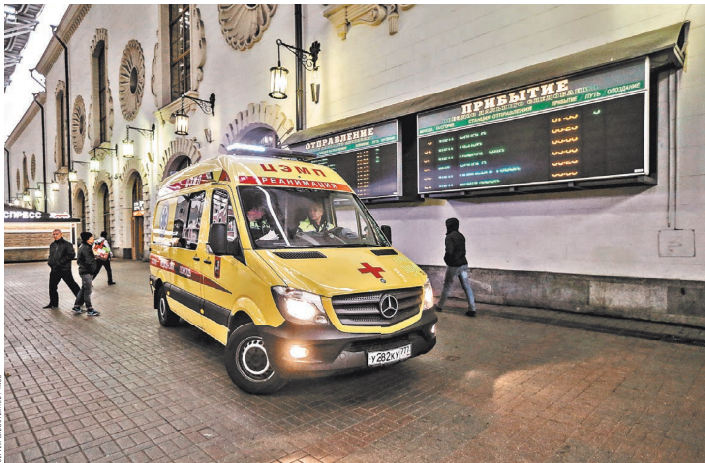
Если заболел в поезде, главное — дотянуть до вокзала, только там сегодня могут оказать помощь.