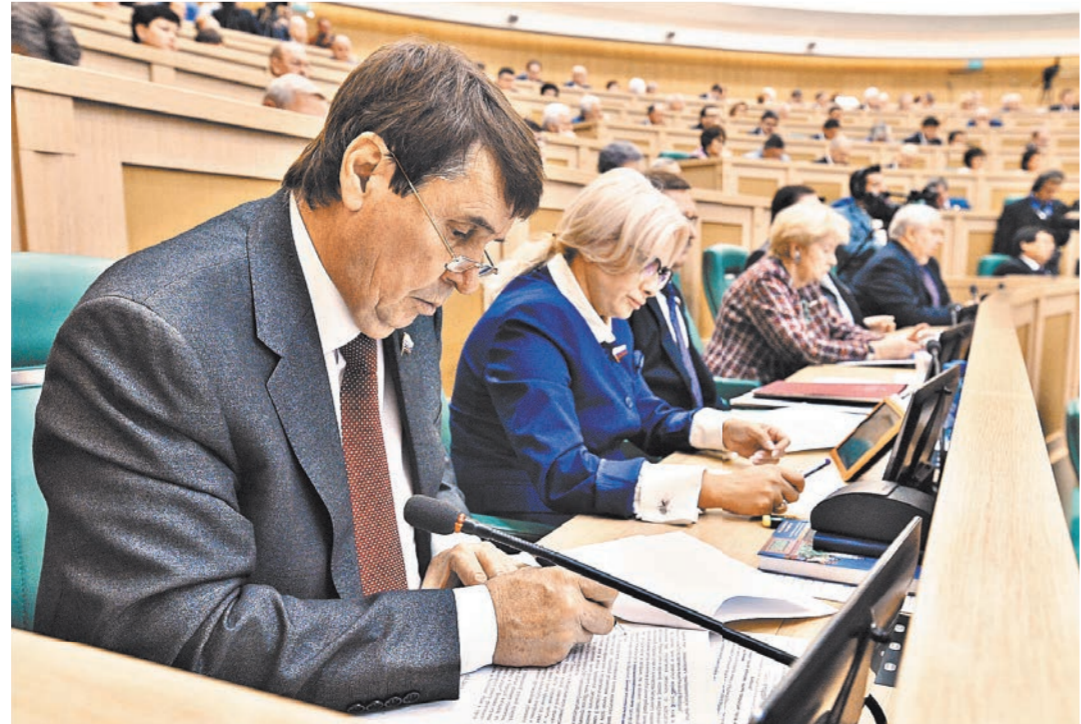
Сенаторам предстоит в эту сессию рассмотреть более 630 законопроектов, из них 136 — приоритетные.

Приступившие к работе члены Совфеда уже распределились по комитетам, трое из них получили руководящие посты. Бывший главком ВКС России Виктор Бондарев возглавил комитет по обороне и безопасности. Бывший посол России в США Сергей Кис-