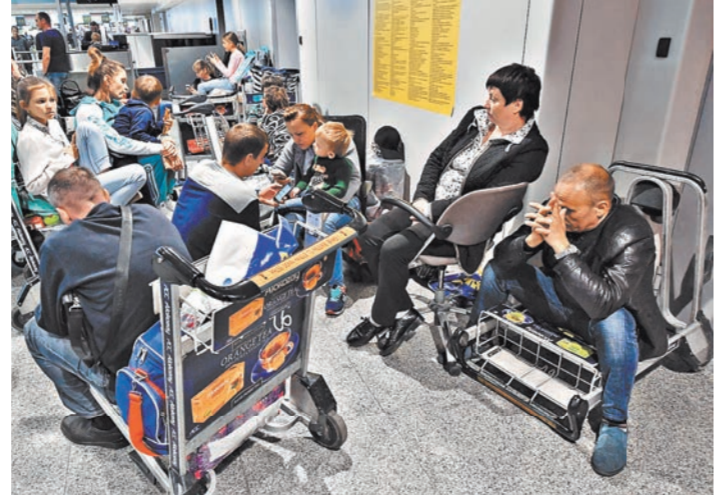
Пассажиры авиакомпании «ВИМ-Авиа» сидят в аэропорту, ожидая рейса.