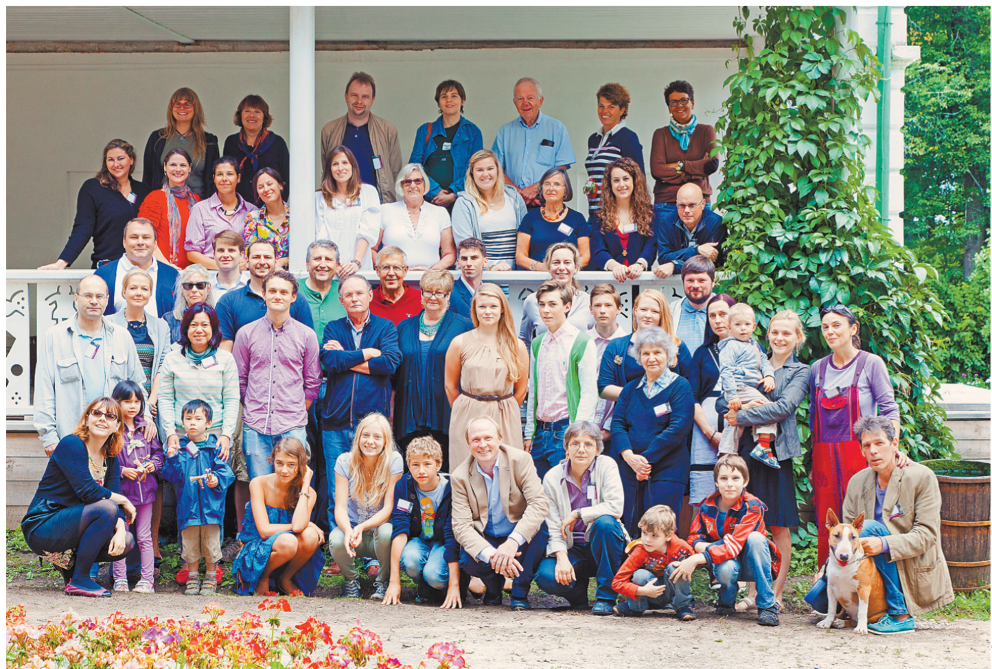
Большая семья в сборе. Раз в два года Толстые со всего мира съезжаются в Ясную Поляну.