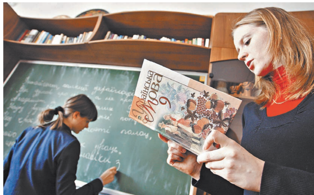
В Киеве не ожидали, что перевод школ нацменьшинств на украинский язык поссорит страну с Евросоюзом.

Если говорить о Болгарии, то на заседании правительства Болгарии министр иностранных дел Екатерина Захариева отметила, что на Украине нет школ, где все обучение ведется на болгарском языке — есть лишь украинские школы, в которых преподают болгарский. В этом, как уточнила Захариева, ключевое отличие от венгров, румын и поляков, у которых на территории Украины расположены школы с обучением детей всем предметам на языках нацменьшинств.