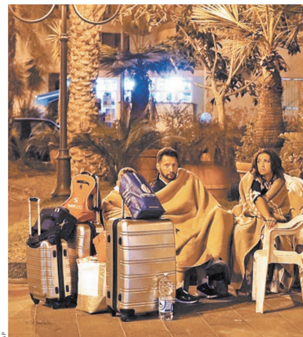
Мощенники лишили 33 миллионов евро пожертвований жителей Апенин, пострадавших от землетрясений.

Между тем заявление мэра Аматыче заинтересовало прокуратуру Риети (область Лацио), которая уже открыла дело по факту исчезновения 33 миллионов евро. Делится версиями этого преступления итальянские следователи пока не спешат, отмечая, что для начала им необходимо выяснить, по какому «маршруту» проходило движение пожертвований. Однако правоохранители заверяют, что, несмотря на запутанность этого деликатного дела, оно будет раскрыто в максимально сжатые сроки.