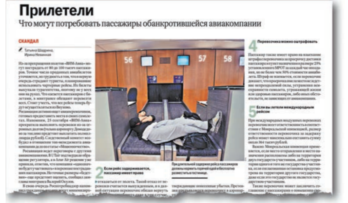
О том, что вправе потребовать пассажиры обанкротившейся авиакомпании, читайте в сегодняшнем номере «РГ-Неделя» на сайте rg.ru/art/1455237