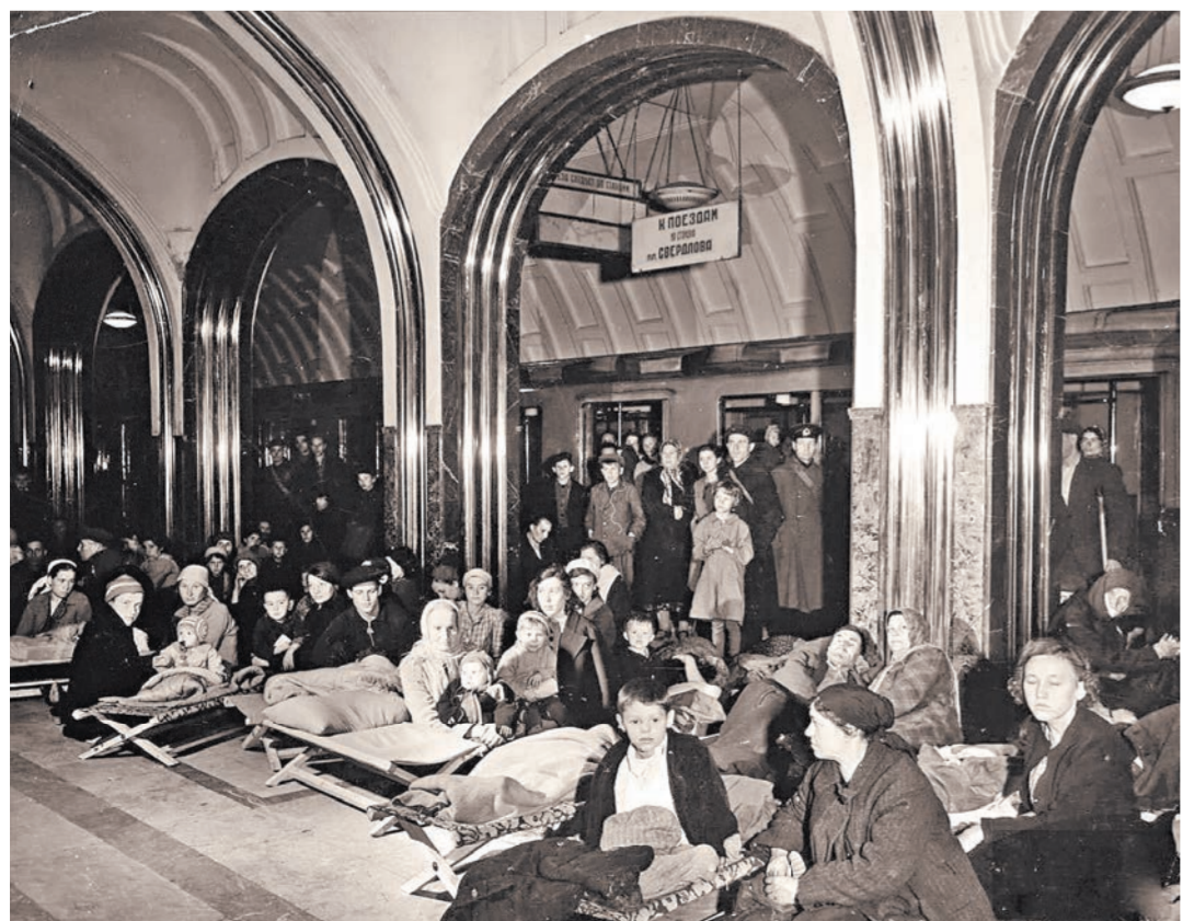
В годы Великой Отечественной войны москвичи спасались от бомбежек в метро. Оно и сегодня считается одним из самых надежных укрытий.