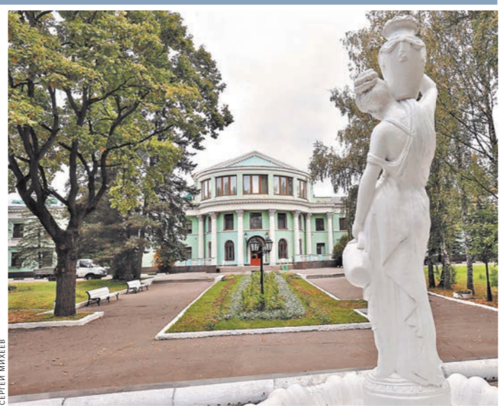
По этим дорожкам гуляла Ахматова, Рождественский и Райкин.

За 22 года до смерти Анна Ахматова написала пророческие стихи: И комната, в которой болю, В последний раз болю на земле, Как будто пошуршит в аллею Высоких белостволных тополей. А тот первый — этот самый главный, Величию своем самодержавный, Но как заплещет, влзкнет он, Когда, минуя тухлог окошце, Моя душа взлетит, чтоб встретить солнце, И смертный уничтожит сон... Последние строки выбиты на мемориальной доске, установленной во втором корпусе «Подмосковья», где Анна Ахматова провела последние дни жизни. Термин «умерла» поклонники ее таланта произносить не разрешают. Позволяют только так: закончилась земная жизнь великой русской поэтессы.