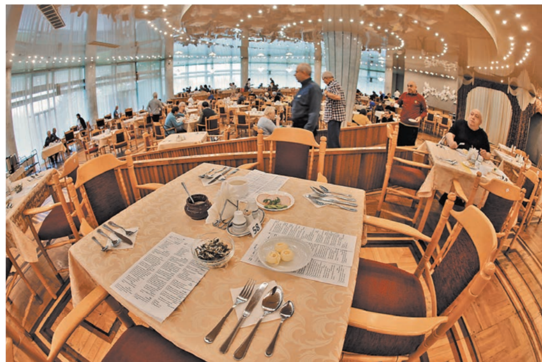
В меню преобладают продукты, выращенные и произведенные в хозяйствах управделами президента.

бекистан, Армения. У нас лечился руководитель соседнего государства, но в силу врачебной тайны я не назову его имя. Есть проекты по приему медицинских туристов из Китая и из Великобритании.