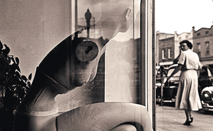
Как и раньше, Эллиотт Эрвитт до сих пор снимает на пленочную Leica.

Впервые в России можно будет увидеть максимально полную ретроспективу известного фотографа, одного из основателей фотоагентства Magnum Photos Эллиотта Эрвитта. Живой