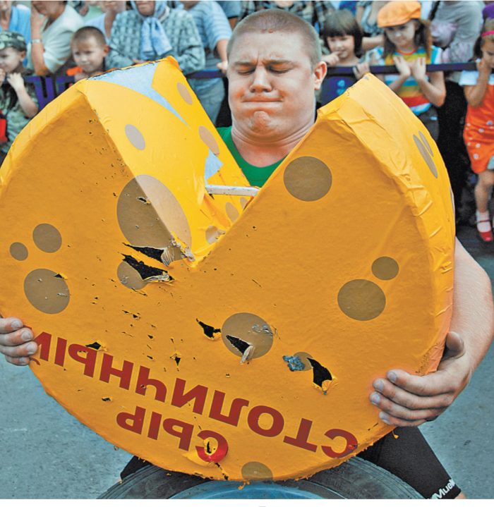
Почти половина сыров в столице — фальсифицированные, говорят в Россельхознадзоре.

Мы провели проверки в ряде регионов. Фальсификат по разным субъектам занимает от 50 до 80 процентов». В частности, в Москве и Московской области доля фальсифицированных сыров достигает 45 процентов.