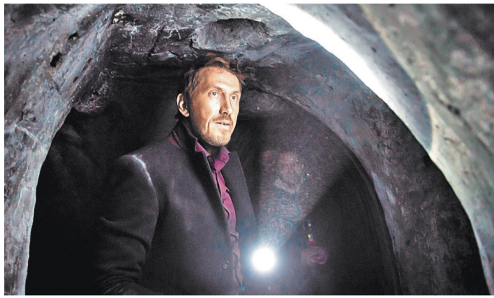
Кирилл Кяро — самый популярный актер нынешней телевизионной осени.