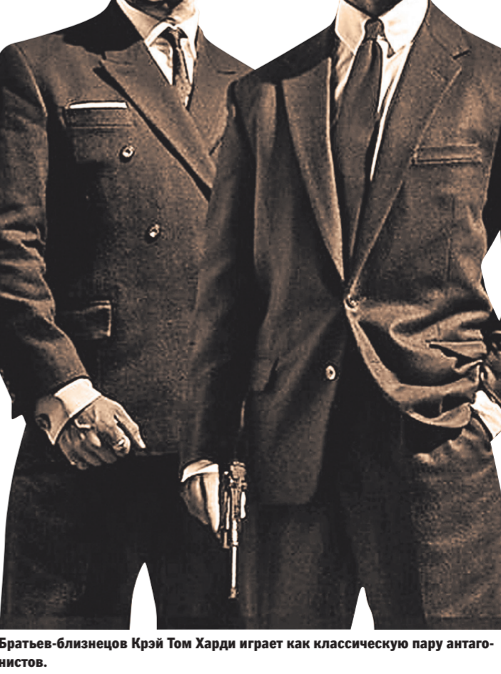
Братья-близнецы Крэй Том Харди играет как классическую пару антагонистов.

Динамичный первый час этой картины смотрится без удовольствия, радуясь за высокую кинематографическую культуру зрелища. Затем, увы, начинаются ти-