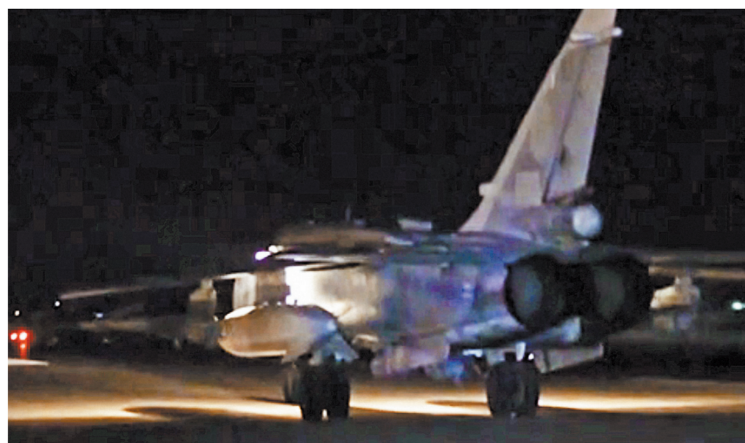
Всего в спецоперации задействовано свыше 50 самолетов и вертолетов. Основа авиапарка — Су-24 «М» и Су-25.

Су-24 «М» может нести широкий спектр управляемых ракет класса «воздух-поверхность» с ядерной боевой частью, включая ракеты с активным и пассивным радиолокационным, лазерным и телевизионным наведением.