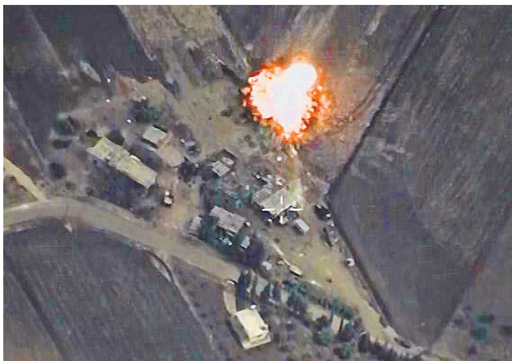
Российским летчикам удалось уничтожить завод по изготовлению взрывчатых веществ. Именно там автомобили начинялись взрывчаткой и направлялись смертниками на мирные объекты.