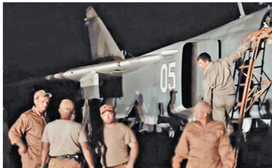
Авиатопливо, военную форму, обмундирование и другое имущество российские летчики получают из России. Сирийцы обеспечивают наших военных фруктами и овощами.