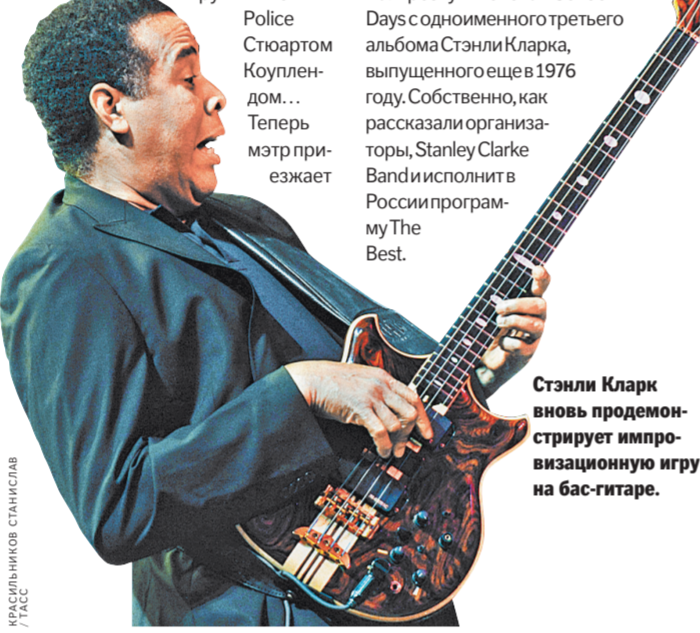
Стэнли Кларк вновь продемонстрирует импровизационную игру на бас-гитаре.