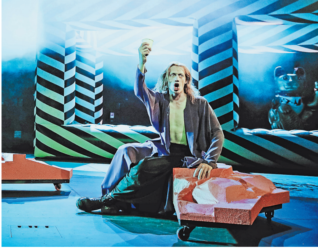
Этот «Макбет» — психоделический двухчасовой опус, в котором зрителю предложена особая попытка.