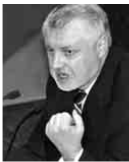
Сергей Миронов, председатель Совета Федерации, лидер партии «Справедливая Россия»:

«Это очень популярная и хорошая идея, но если вы раздадите по гектару земли, то я вас уверяю, не пройдет и нескольких лет, как люди останутся ни с чем, а эти земли будут в собственности новых земельных патифундистов. Нужно быть реалистами».