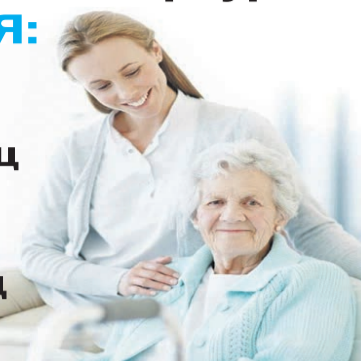
график работы: вахта