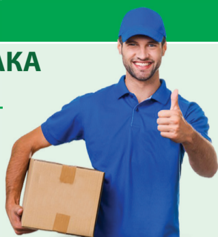
График работы 5/2, з/п 100 000 руб.

МО, Раменский р-н, рп Быково, ул Аэропортовская 14, корп. Е