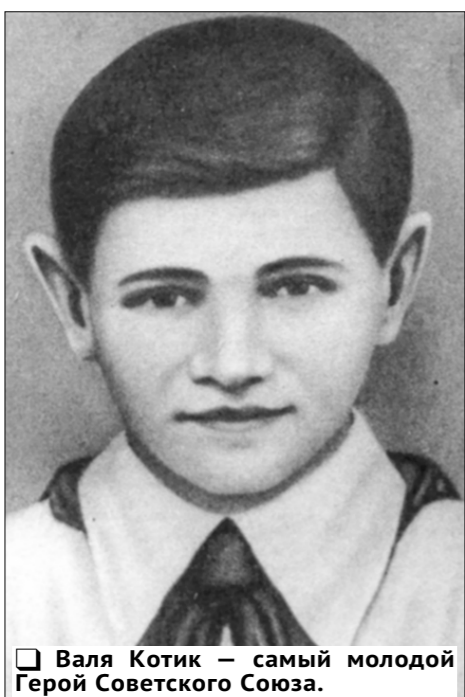
Валя Котик — самый молодой Герой Советского Союза.