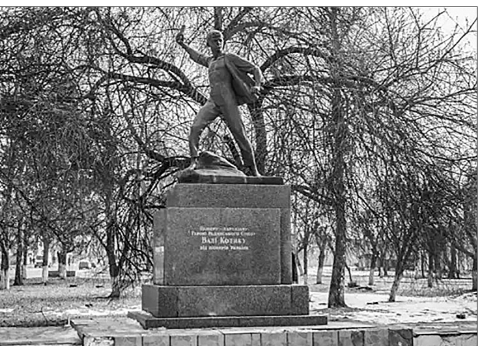
Памятник пионеру-герою Вале Котику в Шепетовке. 1960 год, скульпторы — А. Скиба, П. Флит, И. Самотос.

полю. Шупальца немецкой охранки докучают и до Остапа Горбатюка. Он умер от пыток в кабинете начальника криминальной полиции, предателя Неймана, но никого из товарищей не выдал.