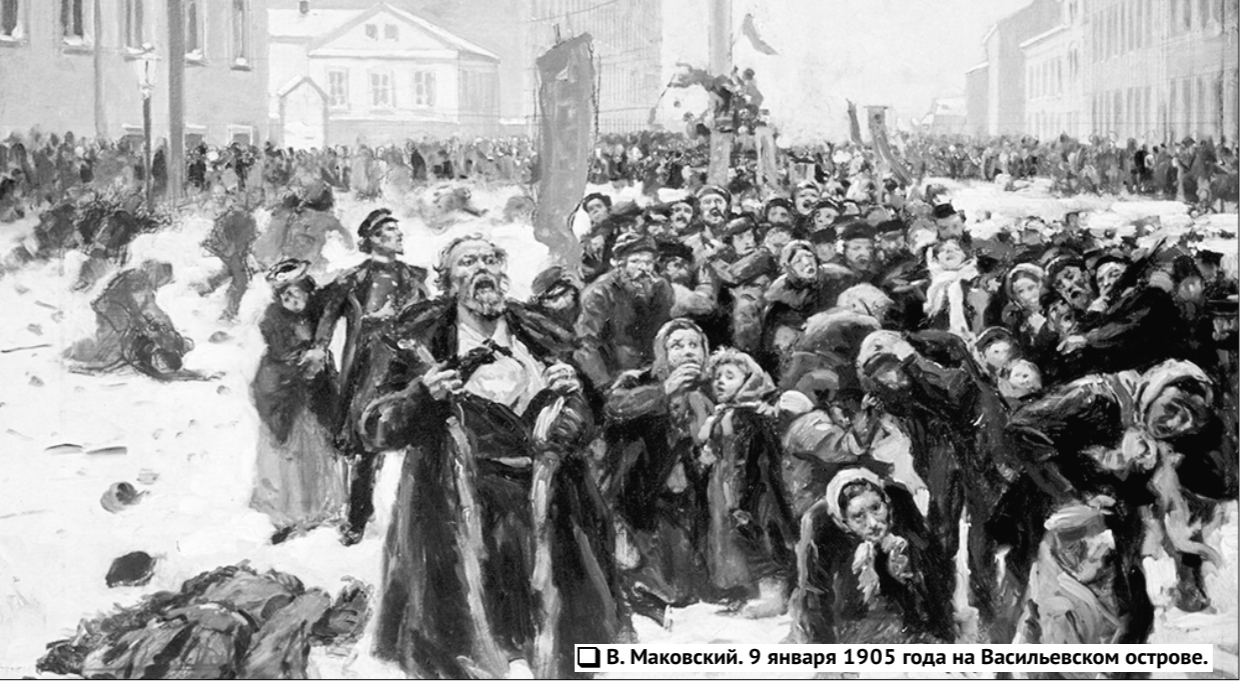
В. Маковский. 9 января 1905 года на Васильевском острове.