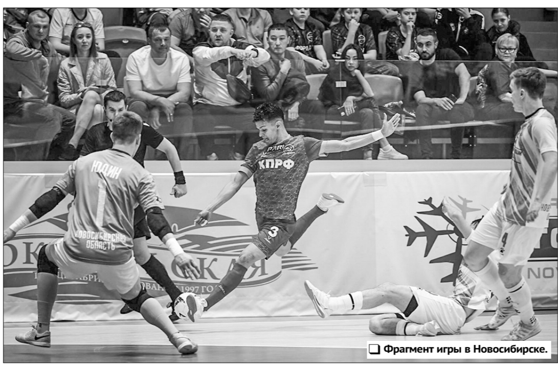
Фрагмент игры в Новосибирске.

недели, и перед последним туром «регуляри» положение в таблице прояснится. Таким образом, цена потерянного очка нашей командой одного очка в Новосибирске оказалась весьма высока и стоила действующим чемпионам страны промежуточного четвёртого ме-