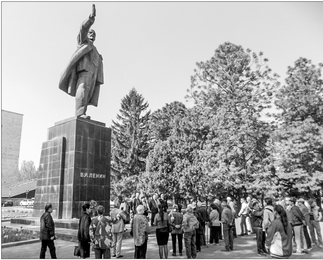
«Сталинские репрессии». Теперь граждане будут работать и во время этого в достоянии ступени исторического праздника. О недопустимости переписывания истории говорят комму-

Сколько глубока разница между капитализмом и социализмом, простые граждане Киргизии ощущают на себе каждый день. Достойная, улучшающаяся день ото дня жизнь уступила место изнуряющему существованию. Миллионы людей вынуждены экономить на самом необходимом и бороться за выживание. Уровень бедности в стране бьёт многолетние рекорды, а скудные подкормки, которые бросает власть, съедаются растущими ценами и тарифами. Фактически ликвидировав оппозицию, руководство страны на этом не успокоилось. Ему не по душе то, что многие жители с ностальгией вспоминают советское прошлое, сравнивая его с нынешней эпохой — разумеется, не в пользу последней. Поэтому ползука антисоветская кампания в Киргизии не прекращается. 12 апреля правительство одобрило внесение поправок в Трудовой кодекс, направленных в том числе на «оптимизацию рабочих и выходных дней». Согласно изменениям, из списка выходных дней исключается 23 февраля. Кроме того, власти сделали ещё один шаг к уничтожению праздника 7 ноября. Напомним, в 2017 году День Великой Октябрьской социалистической революции был переименован в День истории и памяти предков (7–8 ноября), во время которых вспоминались как события 1917 года, так и восстание 1916 года и