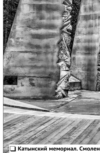
Катынский мемориал. Смоленская область.

тяжении шести месяцев подвергались расстрелам. В приведённых в «Рапорте» воспоминаниях говорится, что это были не допросы, а некие «беседы на политические темы» (о причинах и предполагаемом итоге войны с Германией, о буржуазном и социалистическом строе и т. п.). По итогам этих бе-