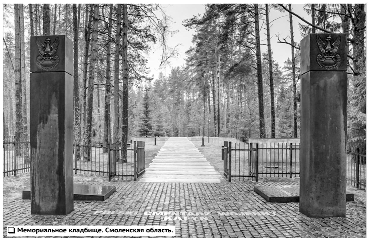
Мемориальное кладбище. Смоленская область.

Принципиально важно отметить, что предложенный на рассмотрение МВТ «Рапорт о резне польских офицеров в лесу Катынь» не был приобщён к материалам процесса. Однако тот факт, что в приговоре Трибунала отсутствует прямое возложение вины за катынское преступление на нацистскую Германию, позволил Западу использовать эту антисоветскую провокацию на всём протяжении «холодной войны». Причём использовать без каких-либо ограничений и юридических последствий. Более того, польские эмигрантские деятели (и стоявшие за их спинами политические силы) использовали это отсутствие решения в политических целях, подняв уровень антисоветской пропаганды на новый — международный — уровень.