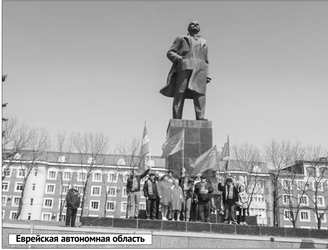
Еврейская автономная область

Насыщенными выдались эти ленинские дни для коммунистов области, сторонников пар-