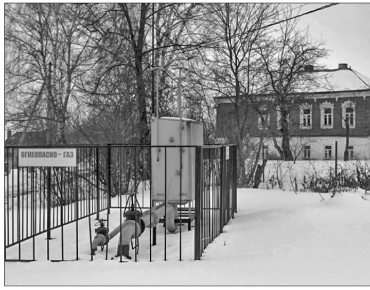
Газовая станция на селе.

Жители Смоленской области по-настоящему благодарны газавикам из соседней Белоруссии.