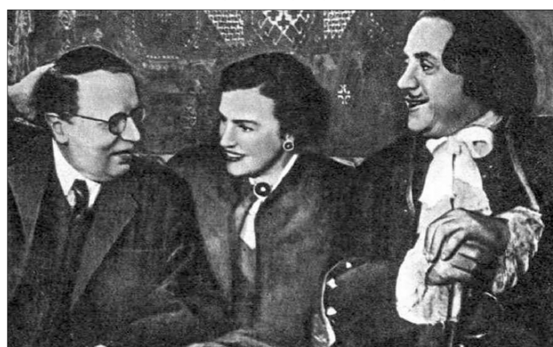
С Алексеем Николаевичем Толстым и его женой на съёмочной площадке «Петра Первого» (1937—1938).

создаёт свои объекты, или приспособляет уже имеющиеся к своим целям.