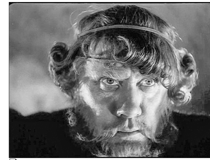
В роли Малюты Скуратова (фильм «Иван Грозный» С. Эйзенштейна).