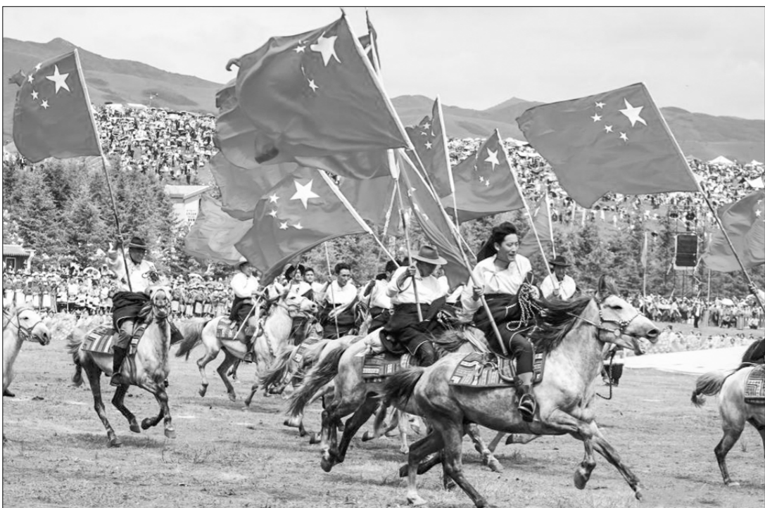
В городе Хэцзо провинции Ганьсу на северо-западе Китая состоялись торжества, посвящённые 70-летию основания Ганьнань-Тибетского автономного округа.