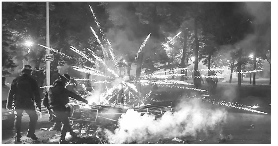
□ А так Париж выглядит сейчас.