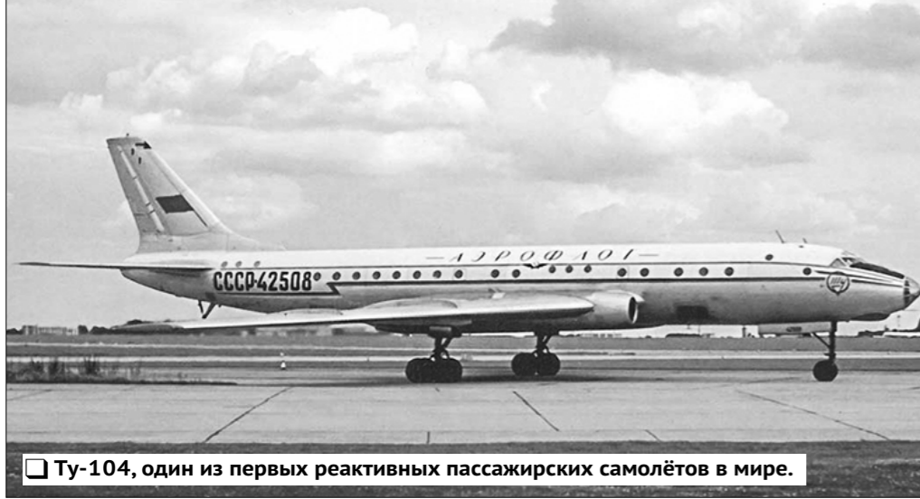
Tu-104, один из первых реактивных пассажирских самолётов в мире.

В Советской стране, которая только что с трудом отразила иностранную военную интервенцию и вышла из тяжелейшей гражданской войны, получились иначе. Первому пассажирскому авиарейсу предшествовал ряд организационных решений. 9 февраля 1923 года Совет труда и обороны РСФСР принял постановление «Об