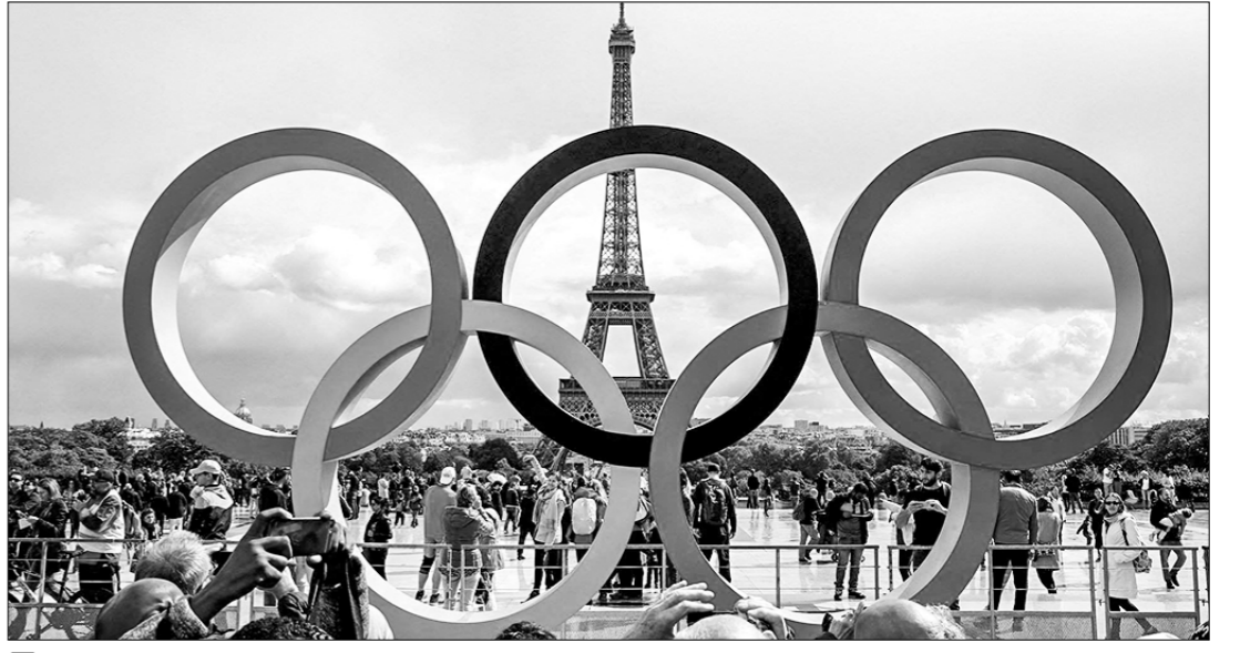
□ Так должен выглядеть Париж в июле 2024 года.

ности введения во Франции чрезвычайного положения. Для этого, впрочем, есть все основания. Погромщики в ответ на жёсткие действия правоохранителей разгромили несколько полицейских участков и завладели имевшимися там оружием. А в самом Париже были разграблены оружейные лавки и магазины, что позволило вооружиться не только хулиганствующим молодёжкам, но и примкнувшим к ним экстремистам различного толка. В столице Франции появились баррикады, сотни магазинов, ресторанов, кафе и офисов были разграблены и подожжены. Многие районы Парижа оказались подобны факалу, который горит отнюдь не мирным олимпийским огнём... Не могло это затронуть и будищие олимпийские объекты. Протестующие устроили беспорядки в непосредственной близости от строящегося к Олимпиаде в северном пригороде Парижа — Обервилье тренировочного центра по водным видам спорта, который, разумеется, не мог не пострадать. Часть окон в здании была выбита, также