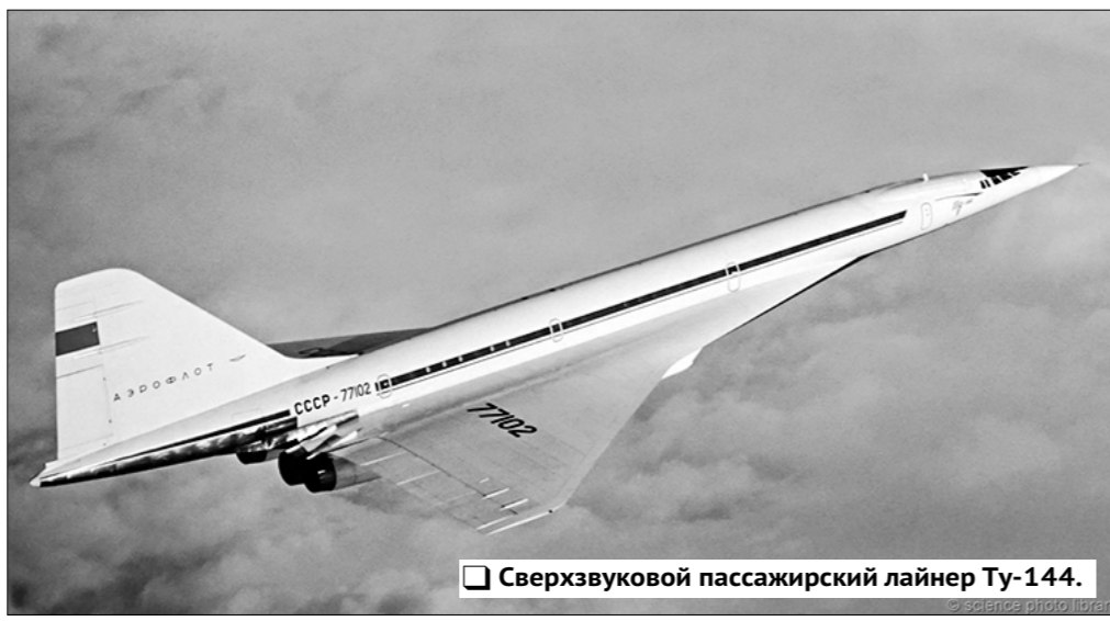
Сверхзвуковой пассажирский лайнер Ту-144.

Период 1958 года советская гражданская авиация стала автором ещё одной мировой сенсации: гран-при на выставке «Экспо-58» в Брюсселе взял