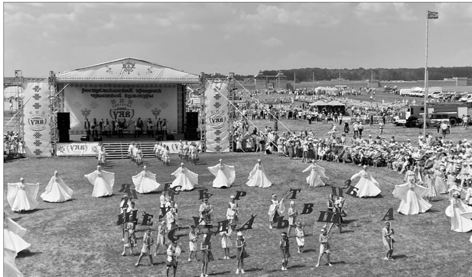
традиционном чувашском хороводе. Он является важнейшей частью национального праздника «Уяв». Свидетелями церемонии открытия торжества стали почти все 12

Торжественному открытию праздника предшествовало приглашение почётных гостей к участию в