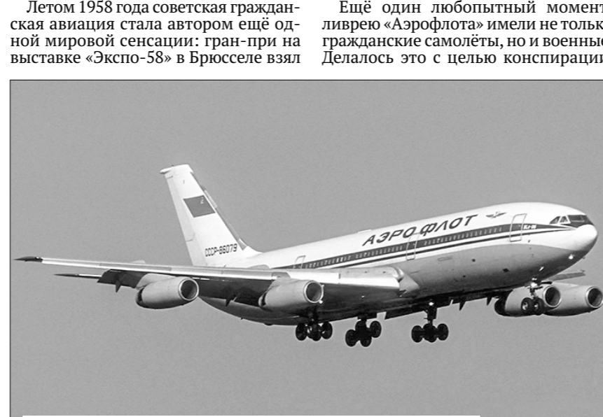
Ил-86 ни разу не разбился с пассажирами на борту.

Ещё один любопытный момент: лайнеры «Аэрофлота» имели не только гражданские самолёты, но и военные. Делалось это с целью конспирации.