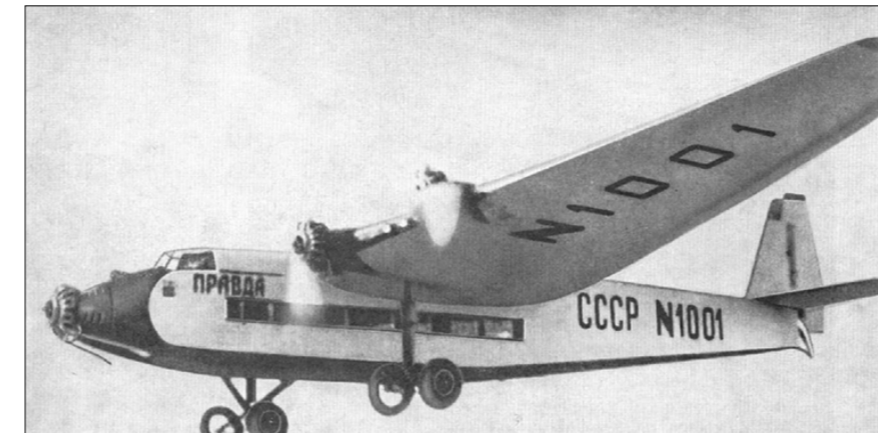
АНТ-14 «Правда» в полёте.

Время в пути по маршруту протяжённостью 11 тыс. км составляло 16 часов. Ни одна авиакомпания мира в то время не делала ничего подобного.