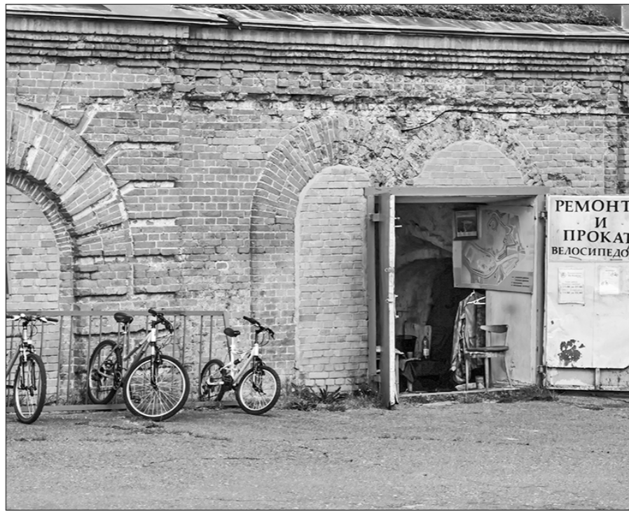
Велосипеды в крепости под запретом, но их прокат — нет.