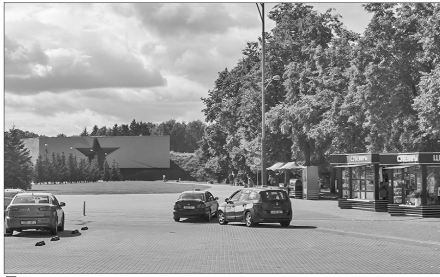
Одна из площадок, где коммунисты предложили установить флагштоки.

Уже несколько месяцев «Правда» следит за развитием ситуации вокруг инициативы Брестской городской организации Коммунистической партии Беларуси установить перед главным входом в ГУ «Мемориальный комплекс «Брестская крепость-герой» три флагштока: со Знаменем Победы, флагами СССР и Республики Беларусь, которые в Год исторической памяти символизировали бы преемственность поколений. В №55 от 26 мая и №69 от 30 июня 2022 года газета подробно рассказала о том, как воплотить безобидную и зорвая идея натолкнулась на непробиваемую стену чиновничьего безразличия и очковитательства.