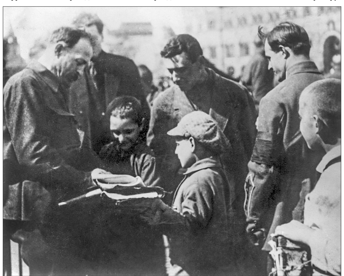
Ф.Э. Дзержинский с воспитанниками трудовой коммуны.