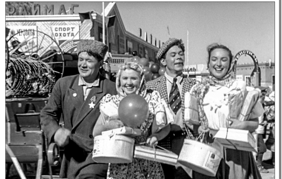
Например, издательствам были подвергнуты народные комедии талантливейшего режиссёра И.А. Пырёва, среди которых «Трактористы» (кадр слева), «Сванарка и пастух» (в центре), «Кубанские казаки» (справа).

Учредители — журналистская организация АНО «Редакция газеты «Правда», Коммунистическая партия Российской Федерации