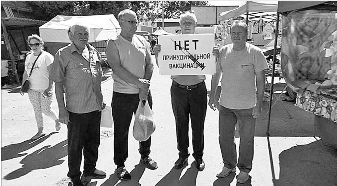
В преддверии Всероссийской акции протеста КПРФ, которая состоится в конце июля, в Тамбове коммунисты проводят одиночные пикеты.

Они вышли на улицы города с плакатами: «Нет — принудительной вакцинации!», «КПРФ: даёшь бесплатную и качественную медицину!», «Коронакризис — порождение капитализма!» и т.д. Увольнения с работы в условиях спада экономики, рост цен, коммерциализация социальной сферы — всё это является приговором для наших граждан. Пикетчики требуют добровольной вакцинации, бесплатной, качественной медицины, и не только в рамках борьбы с коронавирусом, ведь при своевременном выявлении заболеваний, эффективном лечении, профилактике