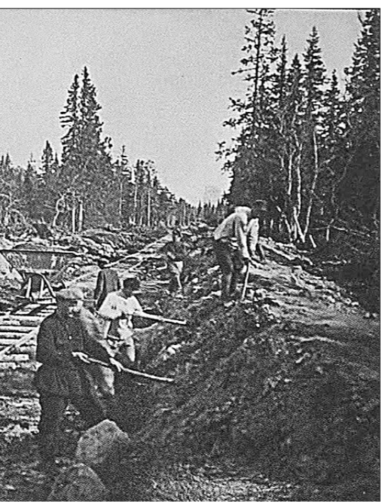
Соловецкий лагерь особого назначения.

Спрямлены до однозначности и отношения Артёма со следователем Галиной. Здесь торжествует любовь плотская. В романе Галина — фигура не менее сложная и противоречивая, чем Артём.