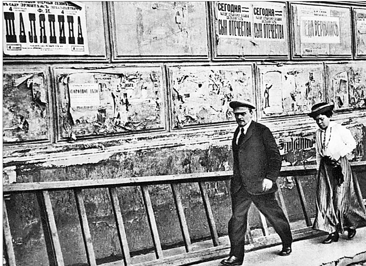
□ В.И. Ленин идёт на съезд.