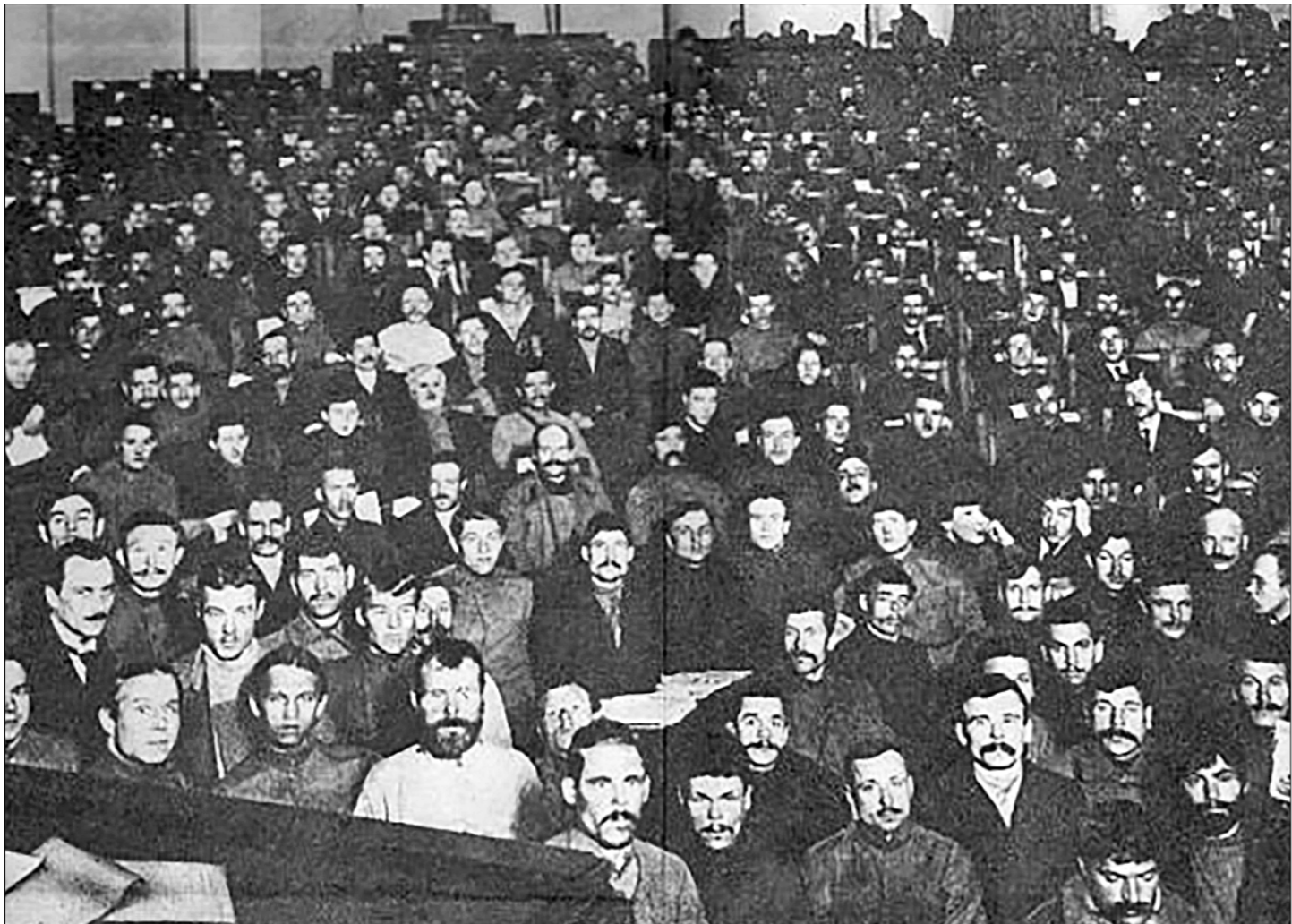
□ Делегаты V Всероссийского съезда Советов, на котором была принята Конституция РСФСР. Июль 1918 года.

ние было распушено. 12 января (25 января по новому стилю) III Всероссийский съезд Советов рабочих, солдатских и крестьянских депутатов утвердил Декларацию прав трудящегося и экс-