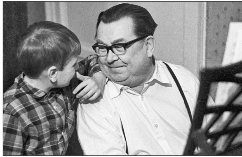
А на этом фото автор музыки к «Вечеру на рейде», классик советской песни Василий Павлович Соловьёв-Седой запечатлён с внуком.