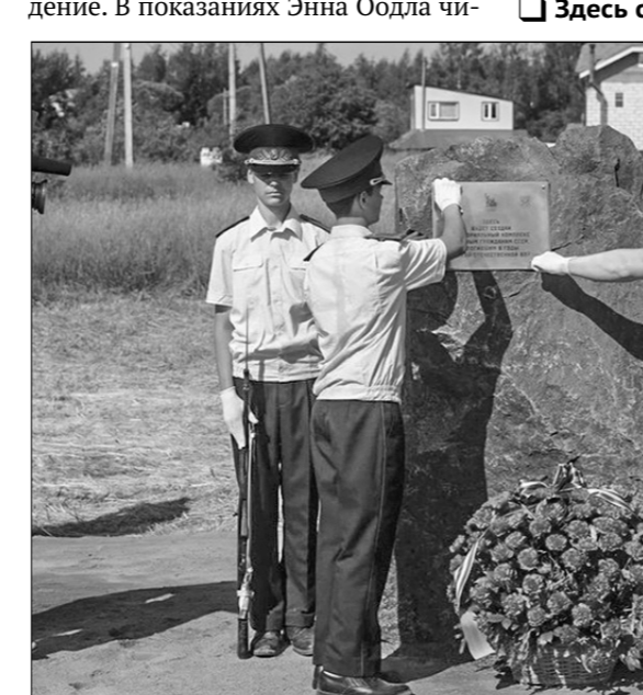
□ Закладной камень на месте будущего памятника жертвам фашистского геноцида. Ленинградская область.