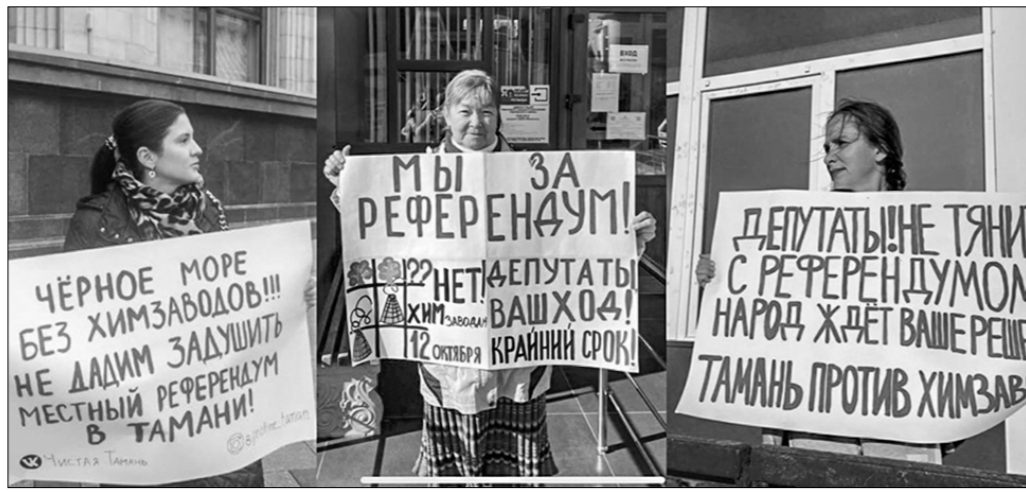
Жители Тамани проводят акцию протеста против строительства химического завода на полуострове.

Таманский полуостров (он же — Тамань) расположен в Краснодарском крае. С севера омывается Тимукским заливом Азовского моря, с запада — Керченским проливом, а с юга — Чёрным морем. На западе полуострова раскинулись станица Тамань, где когда-то возвышался античный греко-сицилийский город Гермонасса. В хазарский период он назывался Самкерш, в византийский — Таматарха, в славянский — Тмутаракань. Сегодня эта древняя земля переживает свой трагический «бельгийский» период. Мишель Литвак — бельгийский предприниматель с русскими корнями — пытается завладеть построенным на государственные средства международным морским грузовым портом Тамань в интересах принадлежащего ему ГК (группы компаний) «ОТЭКО».