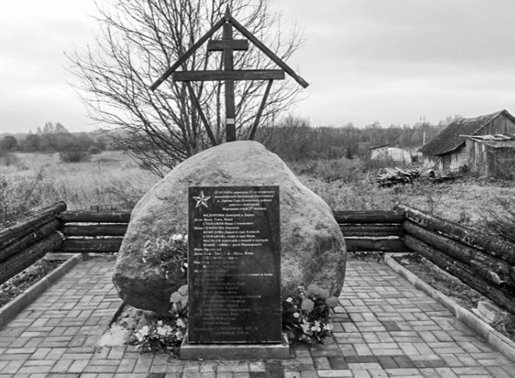
□ Здесь сожгли псковскую Ланёву Гору и её жителей.