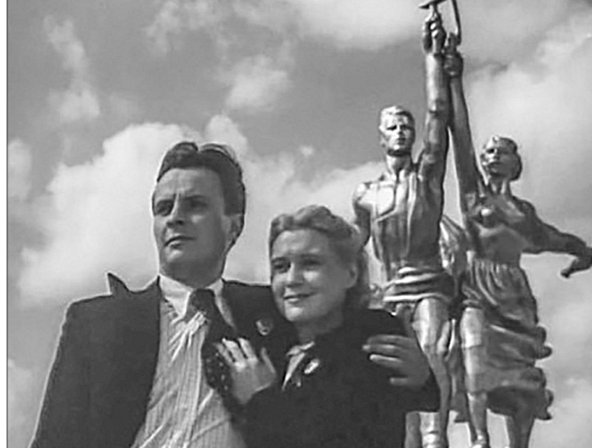
Кадр из фильма «Светлый путь» (1939 г.), где впервые прозвучал «Марш энтузиастов», а в главной роли снялась будущая народная артистка СССР Любовь Орлова.