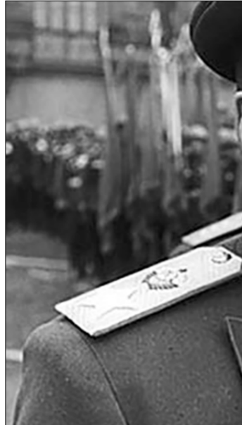
Кирилл Афанасьевич Мерецков.