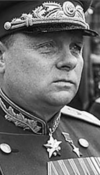
Кирилл Афанасьевич Мерецков.