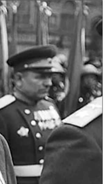
Кирилл Афанасьевич Мерецков.