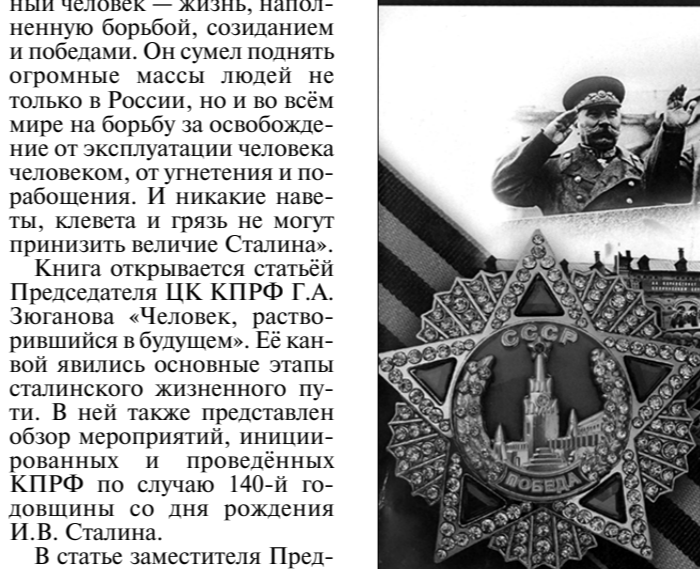
Посвящается 75-летию Великой Победы Великого Советского Народа в Великой Отечественной и Второй мировой войнах над международным фашизмом