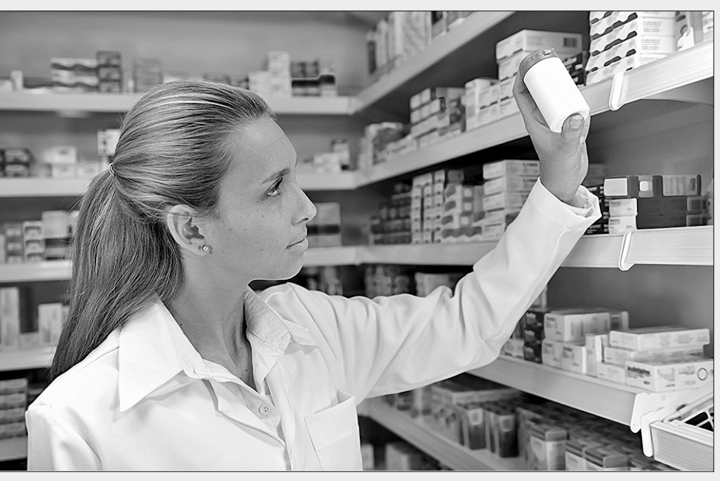
Росздравнадзор предупреждает: «Внимание! Мошенники!»

руках хоть несколько минут, аптека не примет — на то закон есть. Как быть? Пишите жалобы в Росздравнадзор и отправляйтесь в путешествие по горемычным краям жлобиха.