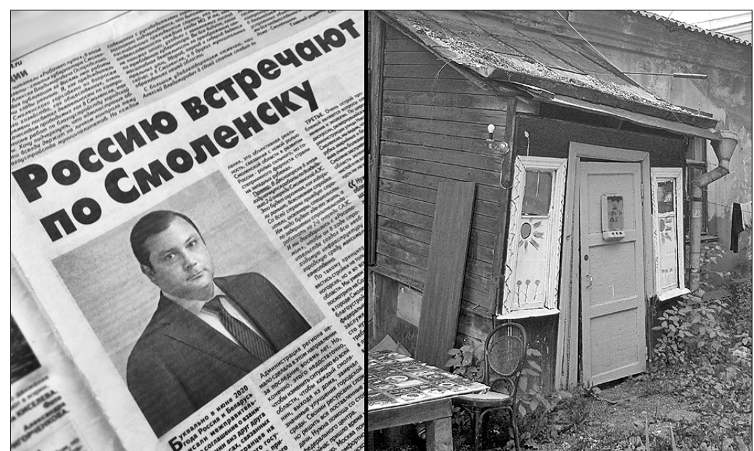
Краснощичье соседство: статья губернатора и дом-конюшня.

Дмитрий ТИХОНОВ, сок. корр. «Правды», г. Смоленск.