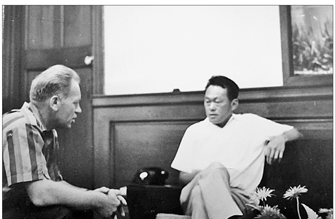
Специальный корреспондент «Правды» Юрий Яснев берёт интервью у премьер-министра Сингапура Ли Куан Ю. 1967 г.

вмешалась матушка-природа: хлынул тропический ливень, зашверкала молния. Артиллерийская подготовка была отменена, и наш взвод пешей разведки двинулся по скользким камням через кусты сопок к укрепляющему японцев».