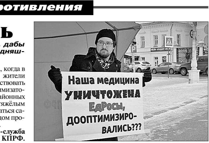
Пресс-служба Костромского обкома КПРФ.

Эта эпоха должна получить оценку как самая недостойная в истории России! Только тогда мы сможем отбросить «наследие» этой эпохи и пойти по пути возрождения сильной и справедливой Державы.