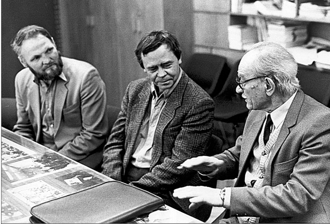
Г. Троепольский (справа) с друзьями-писателями В. Распутиным и В. Крупным.

Учредители — журналистская организация АНО «Редакция газеты «Правда», Коммунистическая партия Российской Федерации