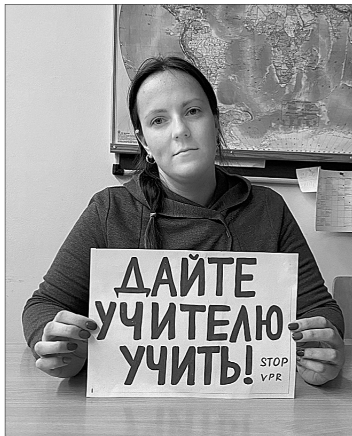
Складывается впечатление, говорят учителя, что это нужно для отчётов чиновников разного уровня друг перед другом, для имитации их бурной деятельности.

Межрегиональный профсоюз работников образования «Учитель» проводит флешмоб в сети с требованием отказаться от проведения Всероссийских проверочных работ (ВПР) в школах в этом учебном году, которые запланированы на весну 2021 года, а также извинить учителей от обязанности анализа результатов уже состоявшихся этой осенью ВПР. Педагоги по всей стране фотографируются с плакатами «Стоп ВПР!», «Дайте учителю учить!» и выкладывают снимки в интернет.