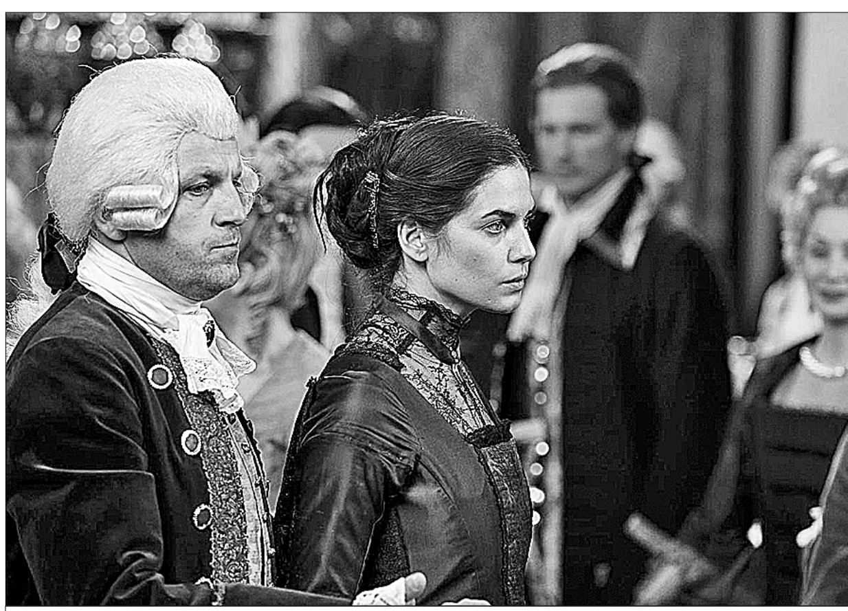
Во всём, конечно же, виновата несчастная любовь...

В «Кровавой барыне» Салтычиха представлена в романтическом ореоле