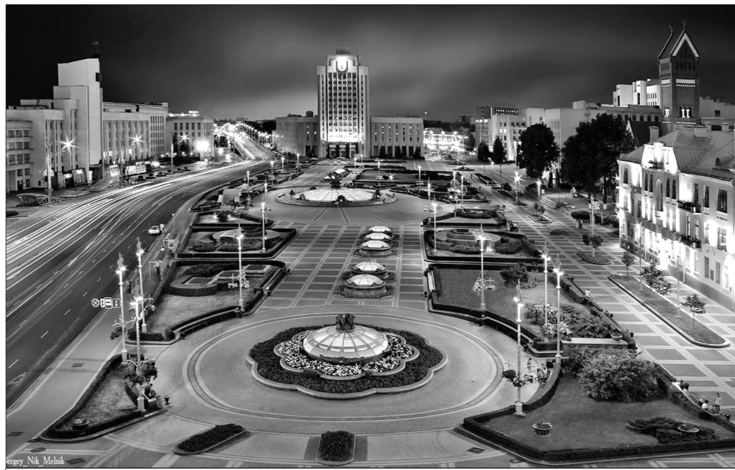
● Площадь независимости в Минске.

Задача — вынужденная. Ещё шестнадцать лет назад, на экстренном совещании 6 ноября 2002 года, проведённом после угрозы «Газпрома» на 50 процентов сократить поставки газа в Белоруссию, Александр Лукашенко дал задание правительству: «Самое главное — немедленно проработать имеющиеся варианты по альтернативным поставкам энерго-ресурсов в Беларусь. Мы не можем дальше терпеть такой зависимости и унижения от одного государства». А затем, после очередных ударов Кремля и откровенных издевательствах, когда российские чи-