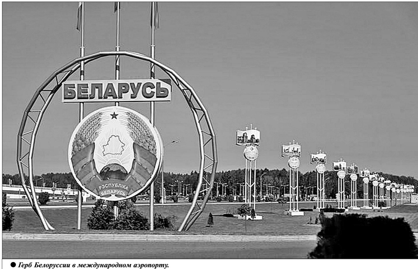
● Герб Белоруссии в международном аэропорту.

Олег СТЕПАНЕНКО. (Соб. корр. «Правды»). г. Минск.