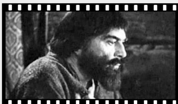
Кадр из фильма «Емельян Пугачёв».