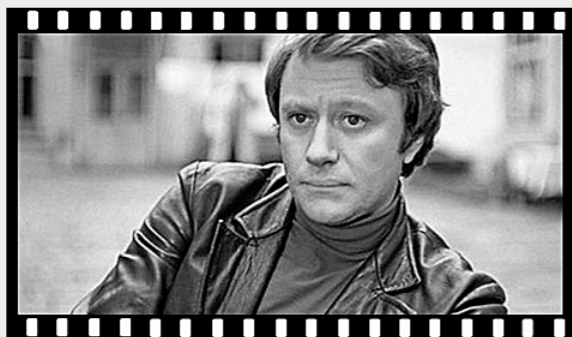
Кадр из фильма «Назначение».

Что общего у Евгения Матвеева, родившегося в далёкой украинской деревне, и Андрея Миронова, сына известных эстрадных артистов? Эти замечательные талантливые актёры были просто обожаемы зрителями — они кинулись в женской любви. Казалось, по праву рождения, а родился он 8 марта, судьба распорядилась стать им любимцами женщин.