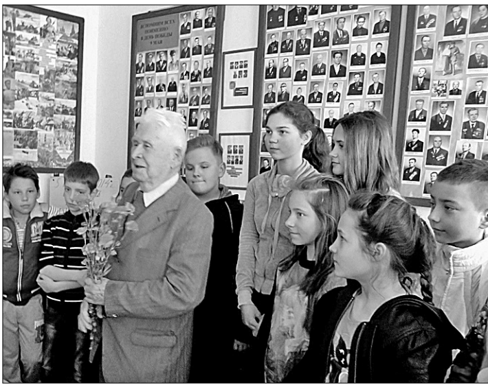
Музей служит сохранению памяти о роли Красной Армии в освобождении народов от немецко-фашистских захватчиков, о героическом подвиге жителей Шальчининского района и всей Литвы в годы Великой Отечественной войны. Юлюс ЯНУЛИС, г. Вильнюс.

За активную работу с ветеранами, участие в патриотическом воспитании молодёжи и большой вклад в подготовку и празднование юбилея Победы 9 мая 2015 года Российский организационный комитет «Победа» наградил музей почётной грамотой и памятной медалью «70 лет Победы в Великой Отечественной войне 1941—1945 гг.».