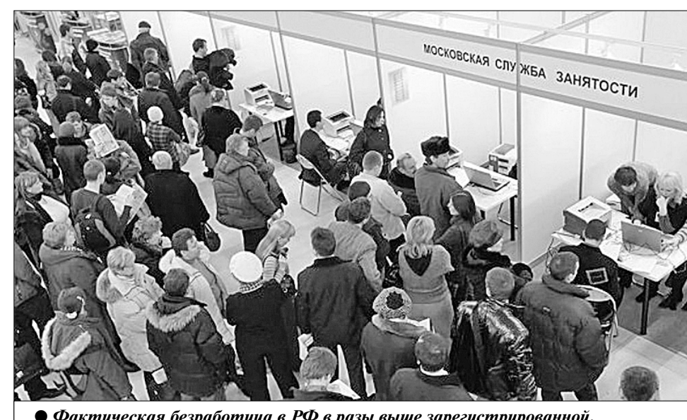
Фактическая безработица в РФ в разы выше зарегистрированной.

Конституция 1993 года декларирует право на бесплатное образование, включая высшее. Однако если в советское время был достигнут переход ко всеобщему полному среднему образованию, то теперь планка понижена: обязательным провозглашено уже только основное общее (по старому — неполное среднее) образование. Более того, государство ушло от обязанности его обеспечения, пережив эту функцию на родителей.