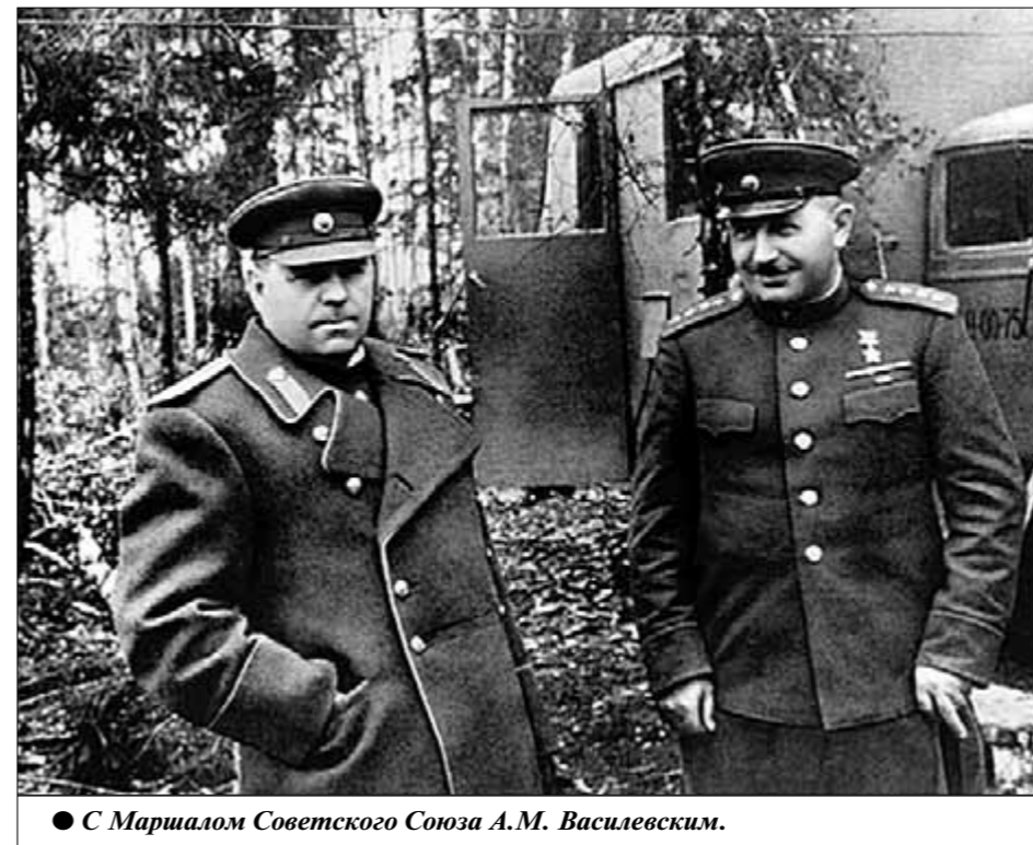
● С Маршалом Советского Союза А.М. Василевским.

— Именно так. Войска 1-го Прибалтийского фронта под командованием генерала армии И.Х. Баграмяна во взаимодействии с войсками 3-го Белорусского фронта (командующий генерал-полковник, а с 26 июня генерал армии И.Д. Черняховский) провели крупную наступательную операцию — Витебско-Оршанскую. Она составляла часть Белорусской стратегической наступательной операции, имевшей кодовое наименование «Баграцион», и целью её было разгромить войска левого крыла немецко-