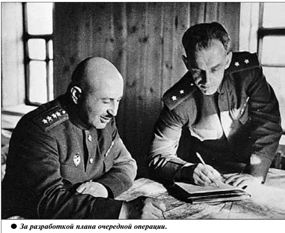
● За разработкой плана очередной операции.

Обстановка требовала прекращения Харьковской операции. Однако командование Юго-Западного направления и фронта недооценило опасность со стороны краморской группировки немецко-фашистских войск и не считало необходимым прекращать наступление. Тогда А.М. Василевский доложил И.В. Сталину о сложившейся критической обстановке и предложил Генеральному штабу — прекратить наступление Юго-Западного фронта, а часть сил из состава его ударной группиров-