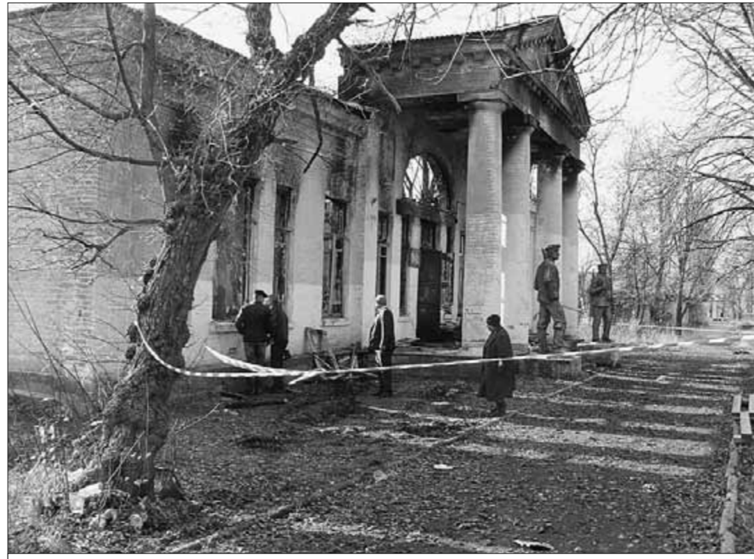
● Здесь выгорела шахтёрская слава.

был всенародным, ныне отменённым в основном представителями старшего поколения. В гимне города, утверждённом «единогласно» большинством городского Собрания депутатов, нет даже упоминания о шахтёрах. Представителей этой героической профессии перестали