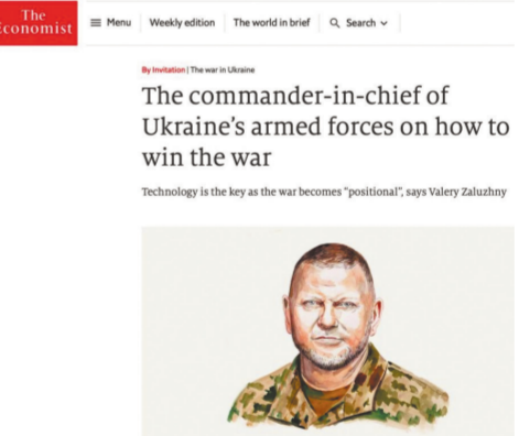
командующий войсками Вооруженных сил Украины

и будет давать — им-то украинцев не жалко. И, как говорят в таких случаях, вишенка на торте. «Для того чтобы мы вышли из этого тупика, нам нужно что-то новое, как порох, который изобрели китайцы и который мы до сих пор используем, чтобы убивать друг друга», — пишет Залужный. Ему хватило ума не использовать слово «вундерваффе», чтобы избежать стопоренной аналогии с последними днями гитлеровской Германии. Там тоже шли лихорадочные поиски чего-то «нового», какого-то «чудо-оружия», которое словно по волшебству переломит ход войны и спасет Третий рейх от разгрома.