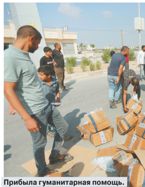
Прибыла гуманитарная помощь.

нужно зарегистрироваться и жить, например, в одном из лагерей для беженцев при ООН. В один такой лагерь людей перестали записывать, когда там оказалось 20 тысяч человек. Свободных мест там не осталось, каждый квадратный метр занят матрасами. Народ соорудил самодельные палатки из тряпок. Люди сидят, стоят, лежат, спят по очереди. Мы с подругой несколько раз ходили туда. Познакомились с одним из начальников. Он, видимо, проникся, что мы иностранки, и пару раз давал