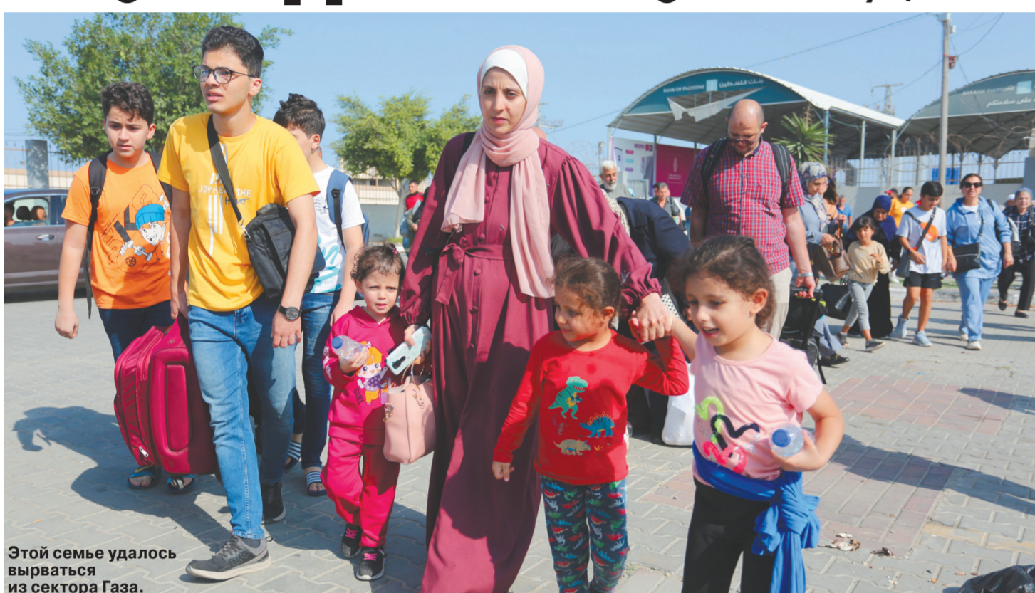
Этой семье удалось вырваться из сектора Газа.

Эвакуация граждан РФ из сектора Газа откладывается. Официальный представитель МИД Мария Захарова отметила, что Россия рассчитывает