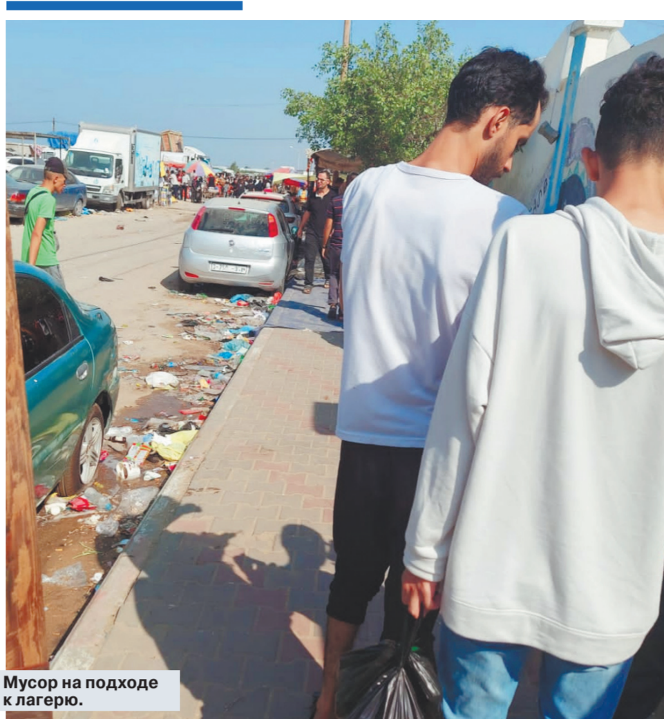
Мусор на подходе к лагерю.