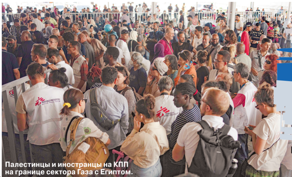
Палестинцы и иностранцы на КПП на границе сектора Газа с Египтом.