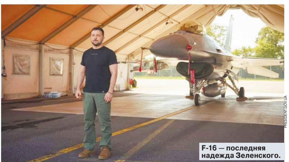
F-16 — последняя надежда Зеленского.