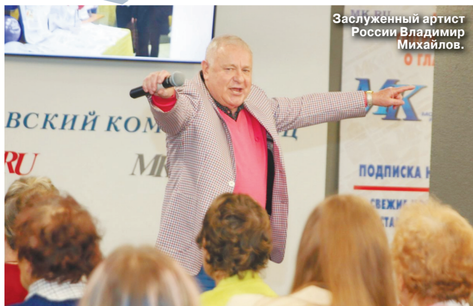
Заслуженный артист России Владимир Михайлов.