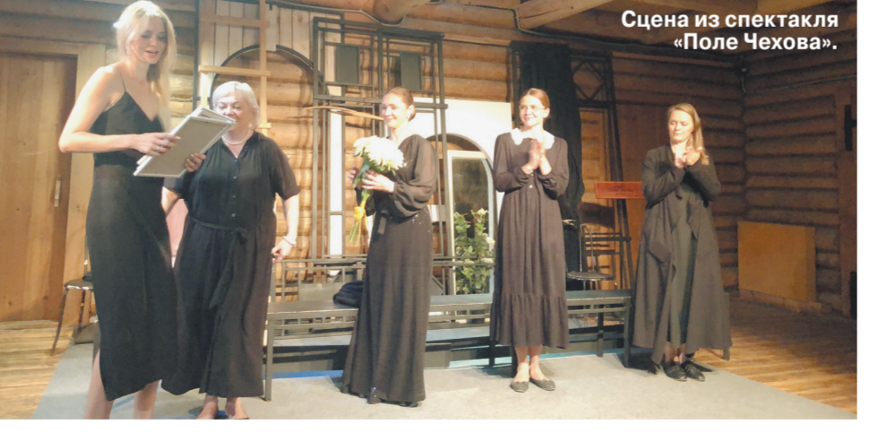
Сцена из спектакля «Поле Чехова».