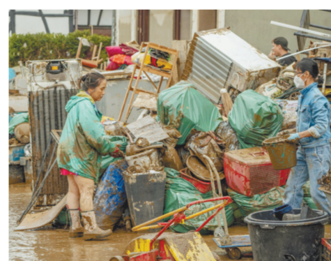
Вода ушла, ущерб остался. Бад-Нойенар (Германия).

Полиция в Германии и Бельгии призвала «туристов-катастрофистов», которые приезжают в пострадавшую местность