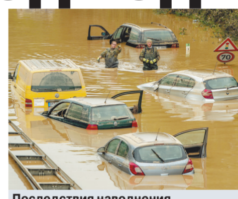
Последствия наводнения в немецком Эрфштадте.

потографировать разрушительные последствия наводнения, в результате которого погибло более 180 человек, держаться подальше, потому что они мешают спасательным операциям.